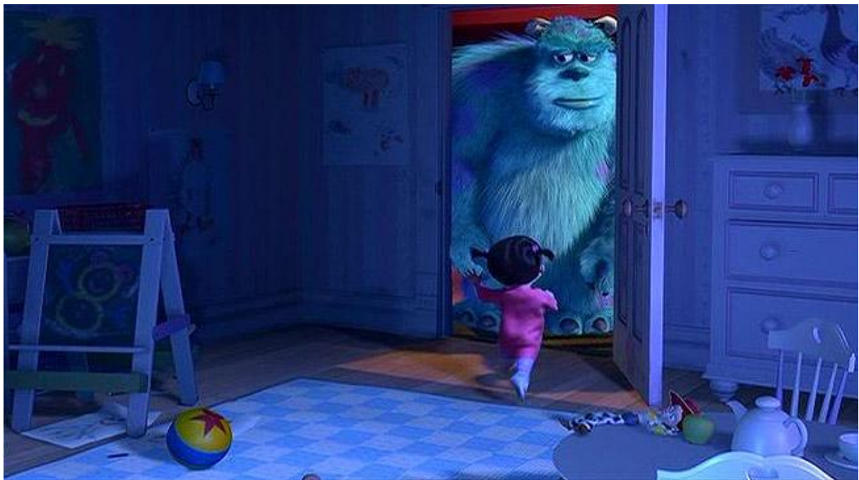
Slika 7. Jessie iz crtanog filma Priča o igračkama 2 u crtanom filmu Čudovišta iz ormara