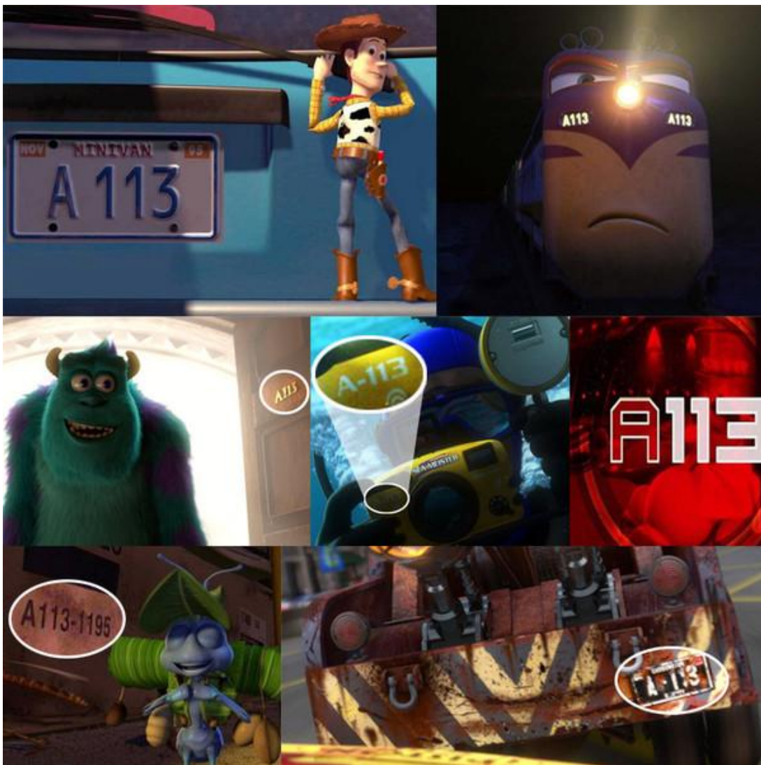
Slika 10. Oznaka „A113“ u Pixarovim crtanim filmovima

Najzanimljiviji je ipak detalj, navodi Williams (2017.) što se u svakom Pixarovom filmu pojavljuje oznaka „A113“ (slika 10) – referenca na učionicu u kojoj je većina Pixarovih animatora učila svoj zanat. Dakle, Pixarovi su zaposlenici ovoj oznaci pridodali osobno značenje, protumačili su je na konotativan način. Ona njima znači nešto sasvim drugačije nego što bi značila djetetu koje gleda crtani film.