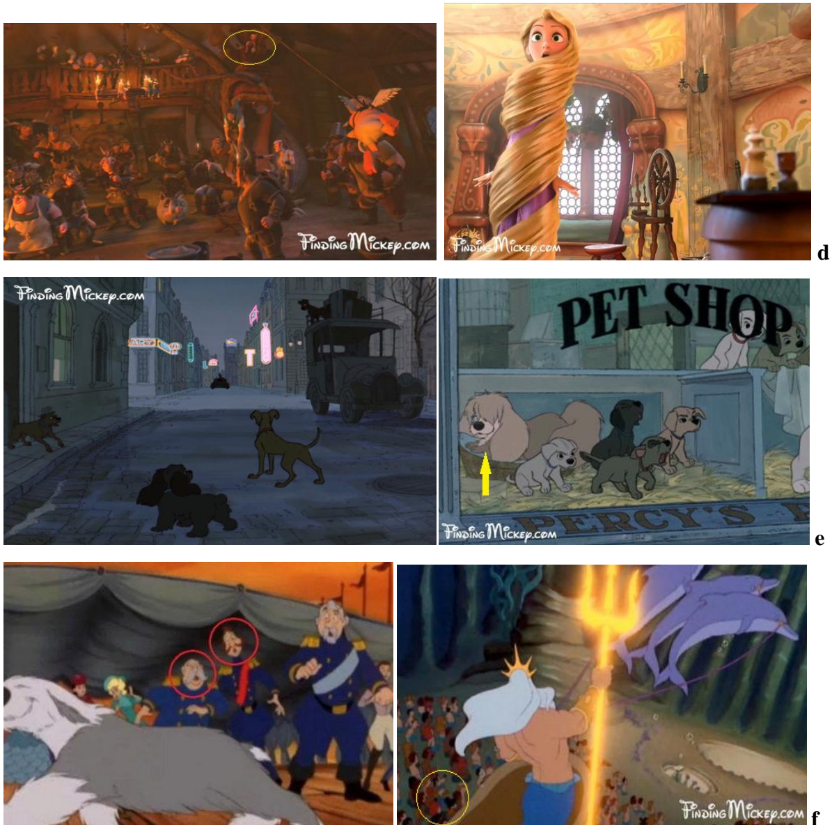
Slika 5 a–f. Easter eggs u Disneyjevim crtanim filmovima

Istu stvar čini i filmski studio Pixar – jedan od brojnih studija pod upravom The Walt Disney Companyja. Pixar, međutim svojim „uskršnjim jajima“ predstavlja nadolazeći film. Publika to dakako ne može znati sve do objave novog filma kada shvate da je lik iz tog filma bio u prethodnom. Jednom kada je uočen obrazac, Pixarovi su easter egg sovi na neki način postali tradicija, a obožavatelji u svakom novom crtanom filmu traže skrivene sadržaje i pokušavaju otkriti što im autori njima poručuju.