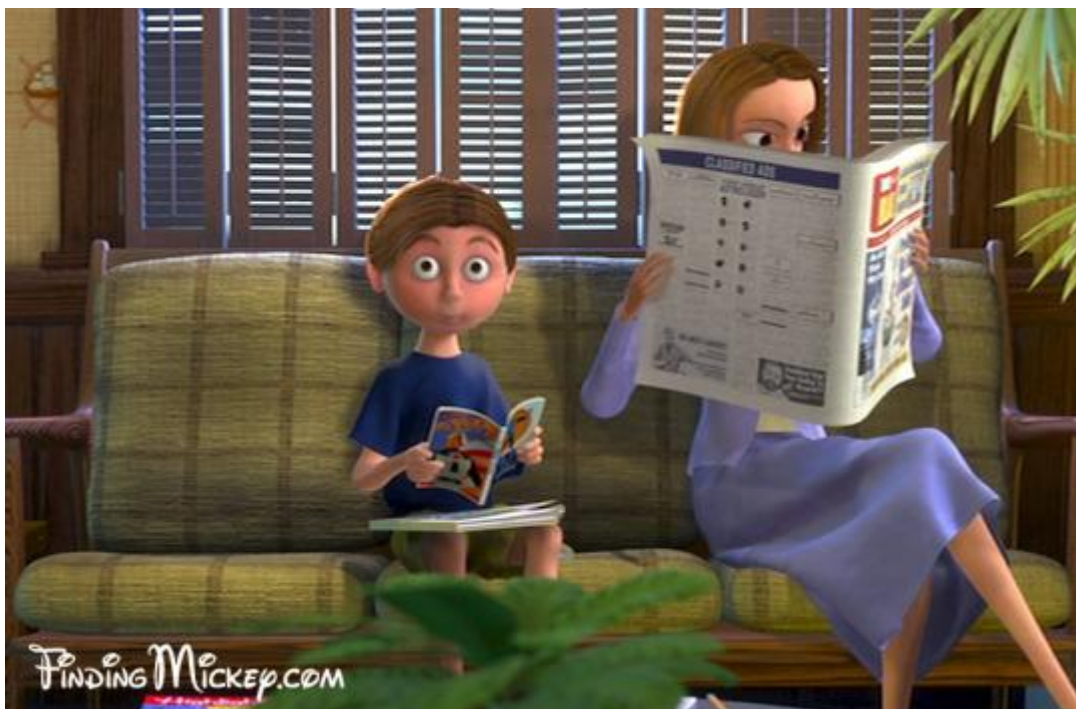
Slika 8. U ovoj sceni crtanog filma Potruga za Nemom dječak čita strip Izbavitelji