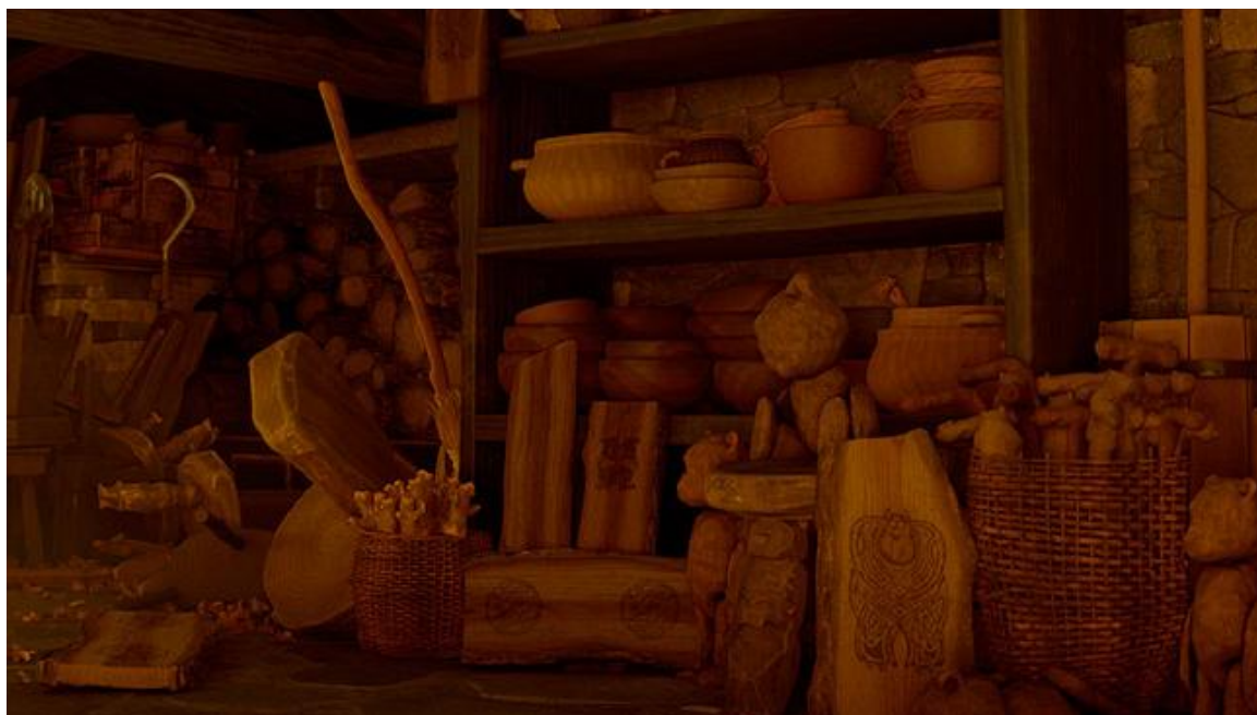
Slika 9. Sully iz crtanog filma Čudovišta iz ormara može se vidjeti izrezbaren u drvu u crtanom filmu Merida Hrabra