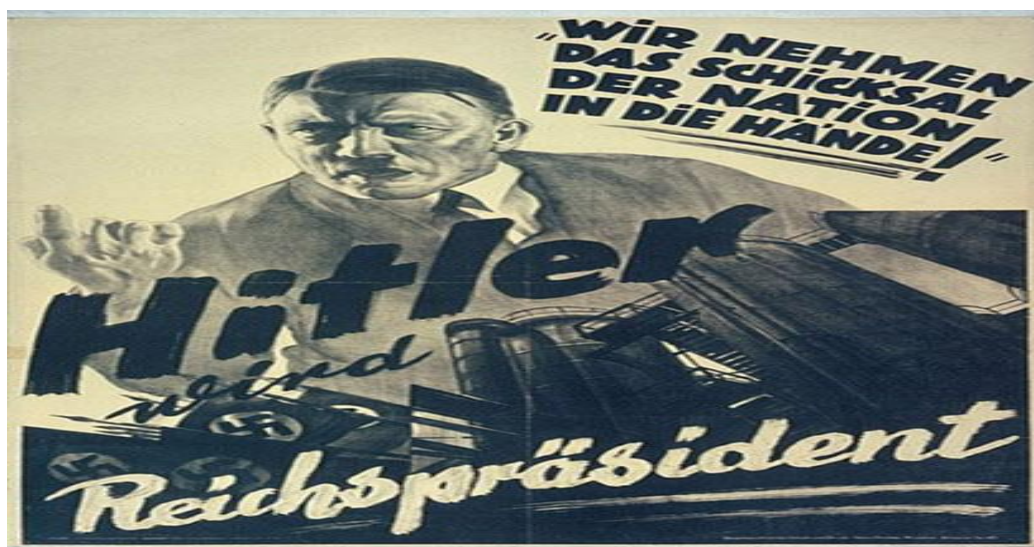
Slika 2: "Uzimamo sudbinu nacije u ruke! Hitler postaje predsjednik Reicha"

Moralnost Hitlerovih djela nije dovedena u pitanje sve do završetka Drugog svjetskog rata- jer je sve ono što je on činio bilo ispravno , u glavama njegovih sljedbenika. U knjizi Ribari ljudskih duša (1990: 50) iznesene su neke od osobina koje odlikuju dobre manipulatore, kao što je to bio Adolf Hitler. Autor ističe da su takve osobe vrlo inteligentne, imaju stila u obrazlaganju i dokazivanju svojih stajališta koja potkrjepljuju dosljednim i logičkim argumentima. Nadalje, u knjizi je napomenuto to da izvanrednog manipulatora čini njegov javni nastup: "Govorio je kao da je vidio istinu, i, držeći se toga zadugo, njemu vjeruju oni koji ga nisu razumjeli i ušutkali one koji su ga razumjeli" (str. 51)