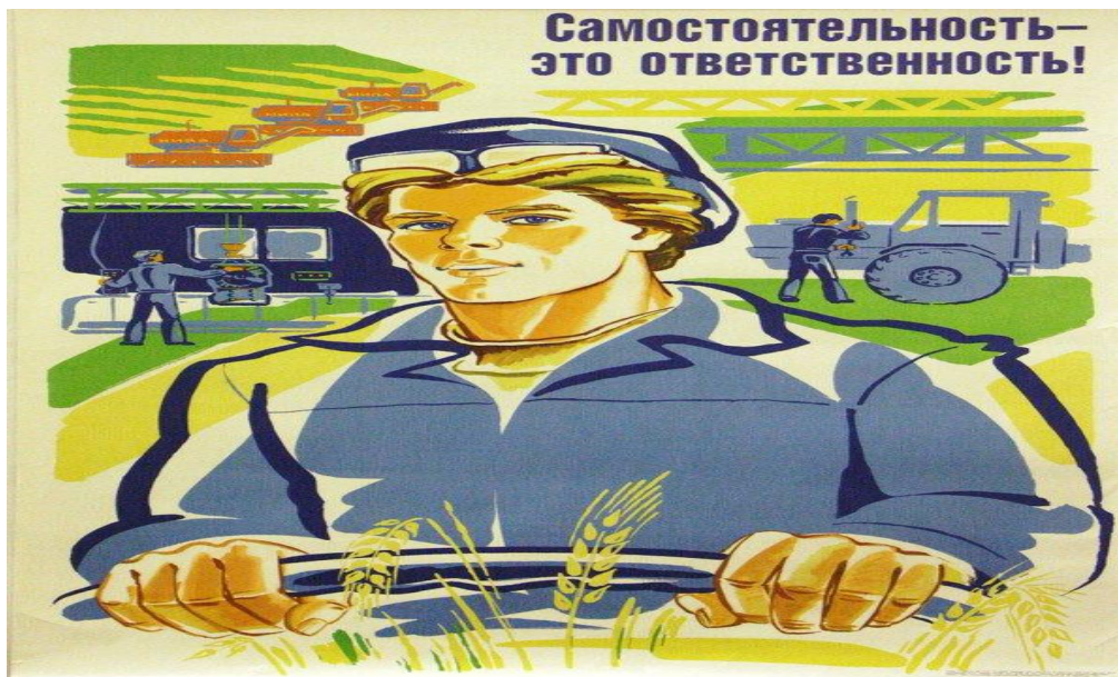
Slika 8 "Perestrojka and the Changing Soviet Workforce"

Razdoblje koje je obilježilo obrat odnosa između SSSR-a i SAD-a je dolazak Mihaila Sergejeviča Gorbačova na vlast, koji je 1985. godine postao predsjedavajući politbiroa i sa svojim dolaskom donio je i mnoge produktivne socijalno– ekonomske reforme, znane kao Perestrojka (Proleksis enciklopedija, zadnji pristup: 21. 8. 2017.).