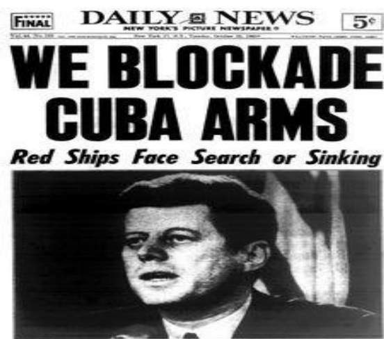
Slika 6: NY Daily News front page, 1962.

Kubanska kriza izbila je 1962. godine kada su "američki špijunski zrakoplovi otkrili sovjetsku raketnu bazu u izgradnji na Kubi", napetost je porasla do razine nuklearnog rata (Proleksis enciklopedija, zadnji pristup: 21. 8. 2017.). Ova kriza smatra se jednom od najvećih prijetnji svijetu, razlog tomu je i prijetnja Sovjeta atomskom bombom s Kube na čelu koje je bio Fidel Castro. Tada na čelu Sjedinjenih Američkih Država bio je J.F. Kennedy koji je odmah "nametnuo blokadu Kube uz prijetnju invazijom". Ovom povijesnom krizom propagandisti s jedne i s druge strane (SAD-a i SSSR-a) iskoristili su sva raspoloživa sredstva kako bi širili propagandu (Proleksis enciklopedija).