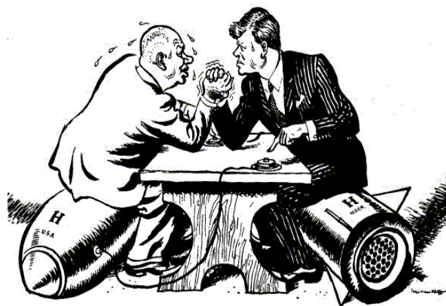
Slika 7: "OK Mr.. President, let's talk"

Jedan od plakata aktualnih za vrijeme Kubanske krize je i ovaj pod slikom 8 na kojoj se sukobljavaju američki predsjednik J. F. Kennedy i predsjednik SSSR-a Nikita Hruščov. Obojica vođa sjede na raketama (nuklearnom oružju) i "drže jedan drugoga u šaci". Dok je SAD brinuo o tome kako svrgnuti Castra s vlasti u Kubi, Sovjetski Savez postavio se kao "model za postignuće modernizacije u jednoj jedinog generaciji". (CHOMSKY, 2002:88). Međutim, tijekom napetosti koje su mogle rezultirati nuklearnim ratom, papa Ivan XXIII. uputio je apel mira putem Vatikanskog radija. Papa je 25. listopada 1962. godine, obrativši se na francuskom jeziku, molio za mir jer je znao kakvi će ishodi biti ako se ne smiri situacija između SSSR-a i SAD-a. Njegov apel je uspio uvjeriti katoličkog predsjednika Sjedinjenih Američkih Država i komunističkog vođu SSSR-a da se povuku, o ovom povijesnom apelu piše portal Vatican Radio (SCARISBRICK, datum objave: