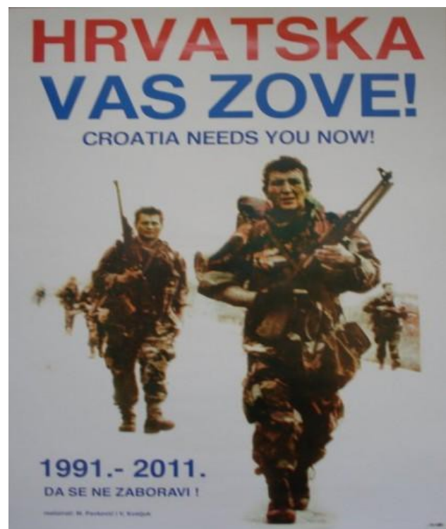
Slika 10: "Hrvatska vas zove!"