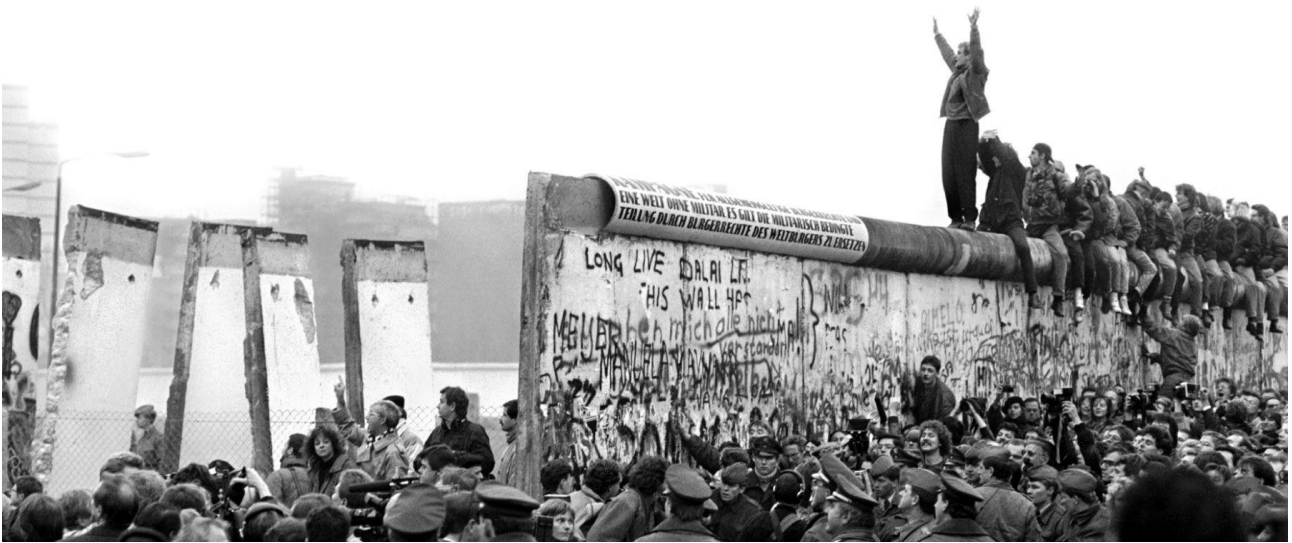
Slika 5: "The Fall of Berlin Wall, 1989."

Također, portal navodi podatak da je prvu godinu pobjeglo oko 10 000 ljudi, a one ljude koje bi uhvatili bili bi ubijeni. Nadalje, jedan od takvih slučajeva bio je i pokušaj osamnaestogodišnjeg mladića Petera koji je htio prijeći zid, ali nije uspio jer su ga čuvari uočili i ubili. Zapravo, ovo teško razdoblje Njemačke u hladnom ratu, koje je opisano u dokumentarnom filmu The Wall , cijelo se vrijeme vrti oko jedne rečenice: "We can't be together". Odijeljenost obitelji i naroda koji je nekad živio zajedno, postala je nova, neugodna svakodnevnica za njemački narod. Međutim, 1989. godine berlinski zid je srušen, i čini se da je revolucija naroda urodila plodom.