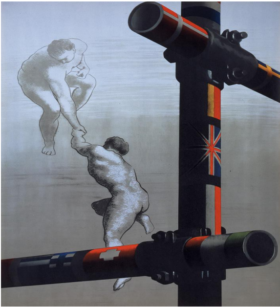
Slika 3: Construction bearing the flags of European nations