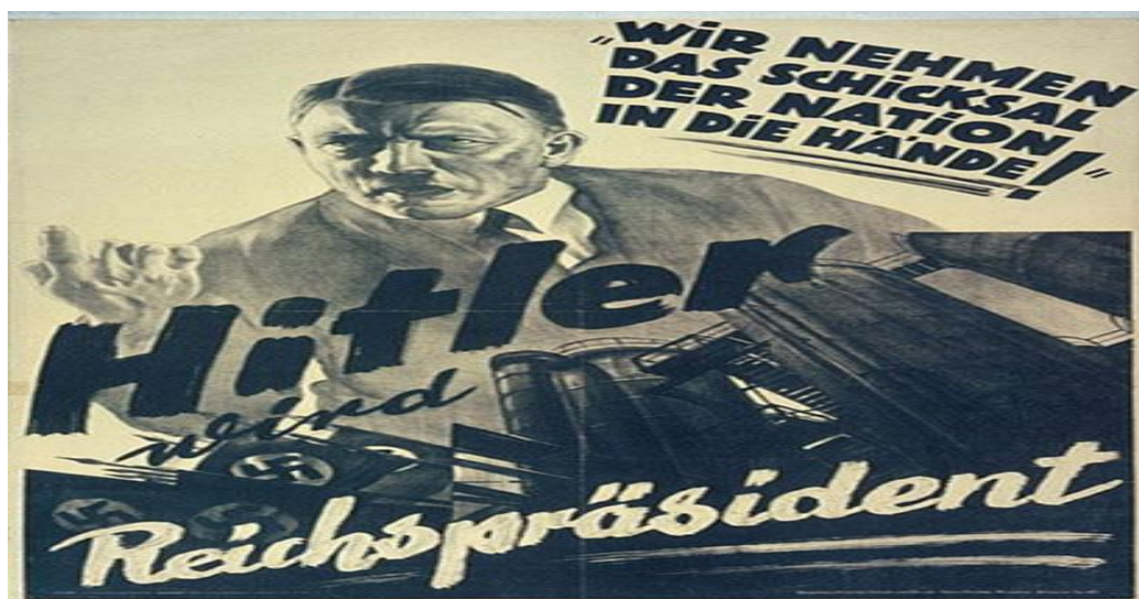
Slika 2: "Uzimamo sudbinu nacije u ruke! Hitler postaje predsjednik Reicha"

Moralnost Hitlerovih djela nije dovedena u pitanje sve do završetka Drugog svjetskog rata- jer je sve ono što je on činio bilo ispravno , u glavama njegovih sljedbenika. U knjizi Ribari ljudskih duša (1990: 50) iznesene su neke od osobina koje odlikuju dobre manipulatore, kao što je to bio Adolf Hitler. Autor ističe da su takve osobe vrlo inteligentne, imaju stila u obrazlaganju i dokazivanju svojih stajališta koja potkrjepljuju dosljednim i logičkim argumentima. Nadalje, u knjizi je napomenuto to da izvanrednog manipulatora čini njegov javni nastup: "Govorio je kao da je vidio istinu, i, držeći se toga zadugo, njemu vjeruju oni koji ga nisu razumjeli i ušutkali one koji su ga razumjeli" (str. 51)