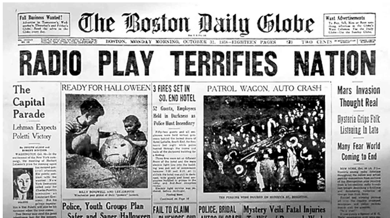
Slika 1: The Boston Daily Globe, October 31, 1938.

Nakon Prvog svjetskog rata nastavilo se s emitiranjem propagandnih sadržaja, bitan primjer jakog utjecaja medija na ljude je radio-drama Orsona Wellesa, Rat svjetova (The War of the Worlds). Ova radio-drama emitirana je 1938. godine na CBS-u, trajala je 60 minuta i izazvala je opću hysteriju među slušateljima (History, zadnji pristup:16. 8. 2017.). Portal The Telegraph (CHILTON, 2016.) ističe činjenicu da je simulacija dolaska izvanzemaljaca na Zemlju, rušenje zgrada, ljudska vriska te sveopće opsadno stanje, koje su glumci uspjeli dočarati, stvorilo paniku među slušateljima. Nadalje, spominje se i to da je Rat svjetova prilično dobar primjer kako mediji mogu manipulirati ljudskom psihom (CHILTON, 2016.). Ova radio-drama dobar je pokazatelj medijske moći. Iako, potrebno je napomenuti da je Orson Welles prije početka Rata svjetova naglasio da je riječ o radio-drami. Unatoč tome, ljudi su počeli širiti paniku koju nije očekivao nitko, osim Orsona Wellesa.