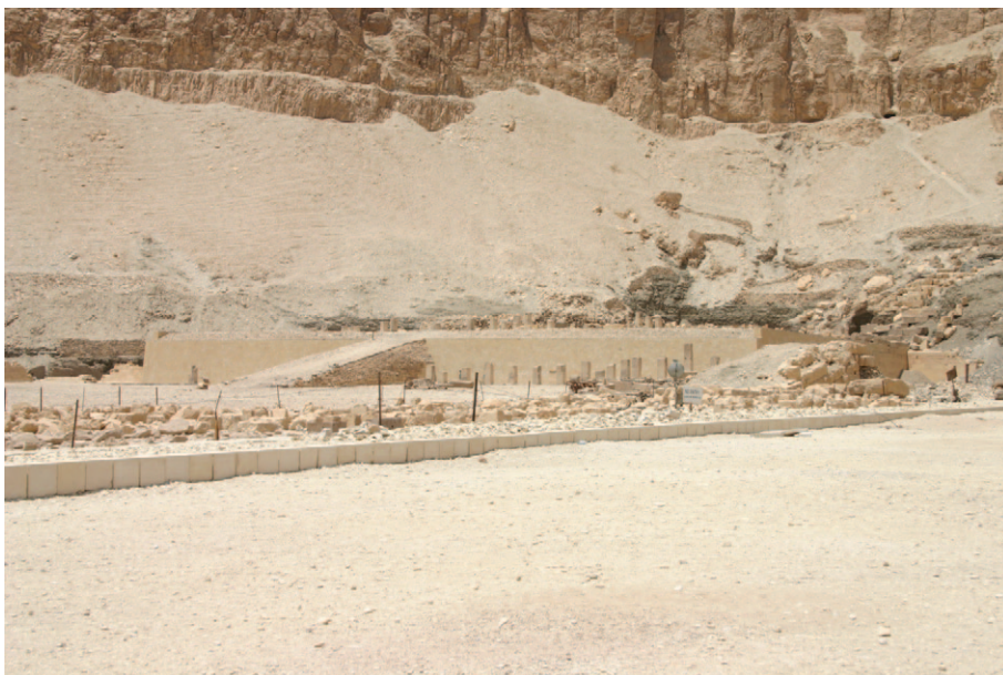
Slika 4. Ostatci posmrtnog hrama Nebhepetre Mentuhotepa II. u Deir el-Bahriju

Osnovna namjena hramskih kompleksa bila je stvaranje svijeta potrebna za izvođenje religijskih i magijskih rituala povezanih uz pojedina božanstva ili božanskog vladara. 10 Ali bez obzira je li osnovna funkcija hrama bila vezana uz pogrrebne običaje ili uz kult, svaki je hram također bio mjesto stabilnosti i božanskog poretka koji svoje podrijetlo crpi iz staroegipatskoga mitološkog koncepta „Otoka stvaranja“. Hramski su svećenici svakodnevno upravo služili tom božanskom stabiliziranju svijeta, odnosno zadovoljavanju svih potreba božanstva kojem je hram bio posvećen. Bog se manifestirao u obliku božanske statue koja je bila smještena uz svetištu hrama u kojem su svakodnevno prinošene žrtve koje su trebale zadovoljiti boga ili bogove kako bi on ili oni bili udobrovoljeni otjerati snage kaosa od egipatskog stanovništva. 11