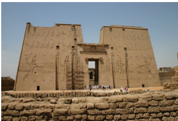
Slika 10. Ptolemej XII. usmrćuje svoje neprijatelje na pilonskim vratnicama hrama Horusa u Edfu 18

Put koji vodi u hramove Novog kraljevstva obično je ukrašen sfingama s glavama čovjeka, ovna ili sokola, a same sfinge predstavljaju zaštitni element hrama. U Tebi danas poznata „Avenija sfinga“ spajala je južni hramski kompleks Luksora s kompleksom Karnaka na sjeveru. Ispred velikog pilona također su obično postavljeni obelisci te statue boga ili faraona u sjedećem položaju. Na primjer, ispred hramskog kompleksa Luksora dva kolosa Ramzesa II 19 stoje ispred glavnog ulaza u hram (Slika 11). U slučaju hrama Horusa u Edfu, jednog