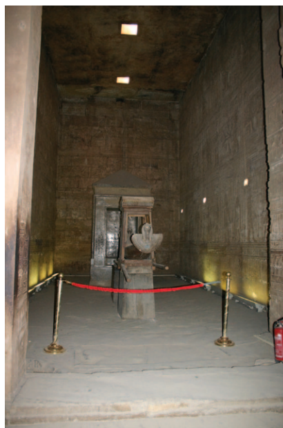
Slika 19. Sveta barka u hramu Horusa u Edfu