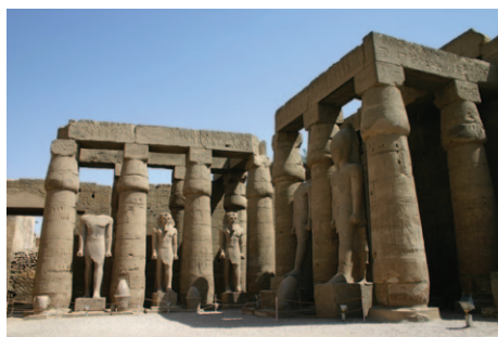
Slika 14. Unutrašnje dvorište hramskog kompleksa u Luksoru

od najbolje očuvanih staroegipatskih hramova, ispred ulaznih pilonskih vratnica stoji statua Horusa (Slika 12).