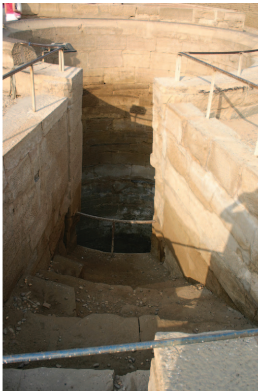
Slika 21. Nilometar iz hrama Sobeka i Haroeris u Kom Ombou

„Kuća rođenja“ ili mammisi bili su također uobičajeni dio staroegipatskih hramova. Obično je to bio neovisan mali hram unutar hramskog kompleksa korišten za izvođenje rituala božanskog vjenčanja i rođenja djece bogova. Takve građevine izgrađene su, na primjer, u kompleksu hrama Horusa u Edfu, u hramu Izide na File i hrama Hator u Denderi gdje je izgrađen mammisi posvećen božici Izidi. 28