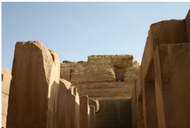
Slika 2. Ostaci posmrtnog hrama faraona Kafre 8 na platou Gize

Od arhajskog razdoblja pa do kraja Starog kraljevstva, 4 hramovi su bili usko povezani s pogrebnim kompleksima božanskih vladara koji su danas poznati kao faraonski posmrtni hramovi. Bila su to mjesta u kojima su svećenici izvodili razne pogrebne običaje i rituale, ali također i prostor gdje su se stavljale žrtve posvećene preminulima. Podrijetlo ovih vrsta hramova može se pronaći u ograđenim pogrebnim kompleksima arhajskog razdoblja 5 koji su bili povezani s kraljevskim grobnicama ranih staroegipatskih vladara. Tijekom Starog kraljevstva, 6 ova je vrsta hrama bila povezana s kompleksima piramida, poput onih koji se danas mogu vidjeti na platou Gize (Slika 2). 7