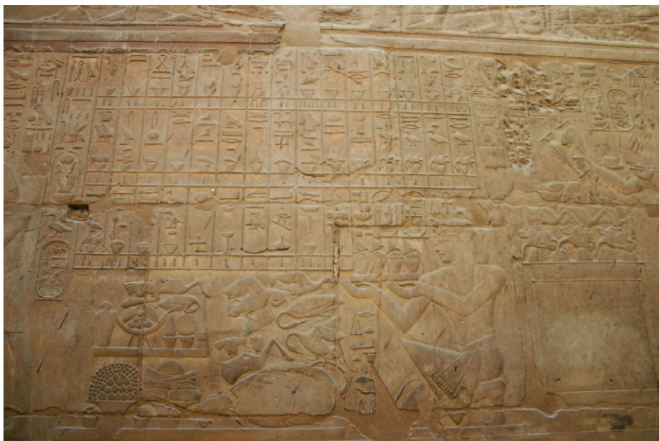
Slika 23. Amenhotep III. Prinosi žrtve bogovima u hramskom kompleksu Luksora

Svećenici su svakodnevno (tijekom jutra i večeri), kao sluge bogova, izvodili rituale cikličkog rođenja bogova tijekom kojeg se sveti prikaz boga koji je stajao u svetištu pročišćavao. Tijekom tog rituala glavni svećenik uz pomoć svojih pomoćnika ulazio je u svetište gdje je izgovarao riječi himne divljenja i klanjanja