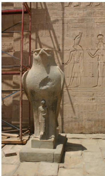
Slika 12. Statua Horusa ispred pilona hrama Horusa u Edfu