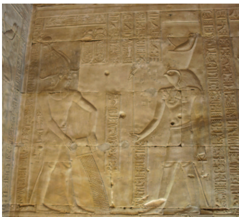
Slika 7. Zidna rezbarija sa scenom osnivanja hrama. Hram Horusa u Edfu.