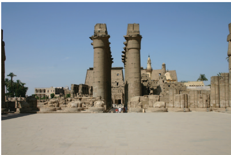
Slika 3. Muslimanska džamija u dijelu hramskog kompleksa Luksor.

Staroegipatski hramovi koje danas poznajemo uglavnom su se očuvali zbog vrlo kvalitetne gradnje i tvrdih građevinskih materijala (kamen, opeka). Očuvani hramovi uglavnom su pravokutne strukture koje su izrađene u dugome vremenskom razdoblju od Novog kraljevstva do kraja rimske vladavine Egiptom (395. god.). Danas su najbolje očuvani kulturni hramski kompleksi: File, Kom Ombo, Edfu, Luksor, Karnak, Dendera i Abidos te posmrtni hramovi vladara Novog kraljevstva (npr. Ramezej, Medinet Habu, Deir el-Bahri) smješteni na zapadnoj obali Tebe. Većina tih hramskih kompleksa građena je i pregrađivana tijekom dugoga vremenskog perioda. Na primjer, neki su dijelovi hramskog kompleksa u Luksoru ponovno bili u funkciji, kršćani su ih tijekom rimskog perioda pregrađivali, a nakon arapskog osvajanja Egipta sredinom 7. stoljeću i muslimani (Slika 3)