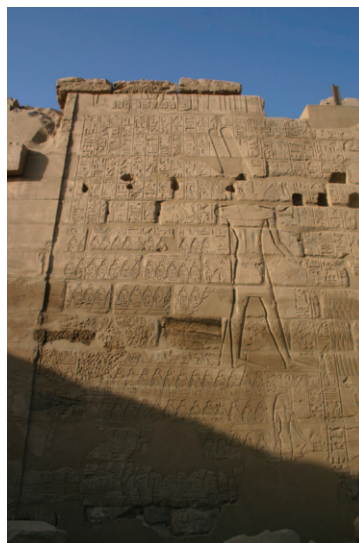
Slika 8. Zidna rezbarija sa scenom plemena i naroda koje je Ramzes II 14 pokorio u jednoj od svojih vojnih akcija. Hramski kompleks u Karnaku