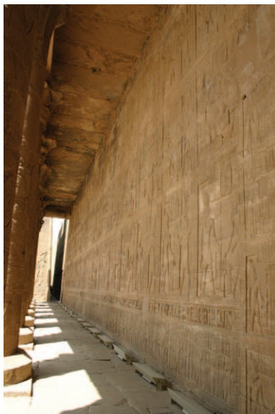
Slika 15. Zidne dekoracije s mitološkim scenama borbe Horusa i Seta u hramu Horusa u Edfu

Cijeli vanjski i unutrašnji zidovi hrama ukrašeni su raznim prikazima i natpisima njihove velike borbe. Unutrašnji zidovi ukrašeni su scenama i tekstovima koji uključuju rituale tijekom kojih Horus konačno poražava Seta. Takve scene predstavljaju novi element koji se na staroegipatskim religijskim reljefima i scenama prvi put pojavio tijekom razdoblja dinastije Ptolemejevića kao forma religijske drame koja se svake godine izvodila tijekom „Festivala pobjede“.