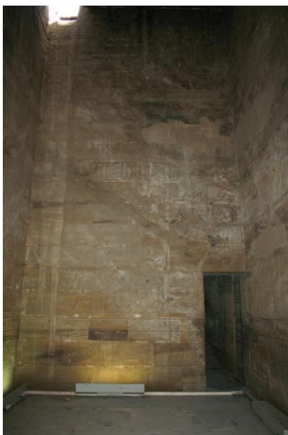
Slika 17. Jedna od unutrašnjih odaja hrama Horusa u Edfu

Ovaj dio hrama bio je samo dostupan svećenicima koji su živjeli s jedinom svrhom da služe bogovima (Slika 17) i obitelji faraona. Nakon ulaska iz hipostilne dvorane nalaze se prostorije u kojima su nekoć stajale statue mnogobrojnih božanstava, potom spremišta za kulturnu opremu, svećeničke pomoćne prostorije u kojima su se oni pripremali za izvođenje svakodnevnih rituala ili festivala. U ovom dijelu hrama također se nalazio prilaz stepeništu koje je vodilo na krov hrama. U nekim hramovima ovdje je bila smještena i neka vrsta kuhinje u kojoj su se pripremala raznovrsna jela od mesa, povrća i voća koja su služila kao žrtve bogovima prilikom izvođenja raznih rituala. Prilikom arheoloških istraživanja ovih dijelova hramova također su pronađene i brojne skrivene odaje skrivene iza zidova i ispod poda, ali njihova funkcija još uvijek nije do kraja rasvijetljena.