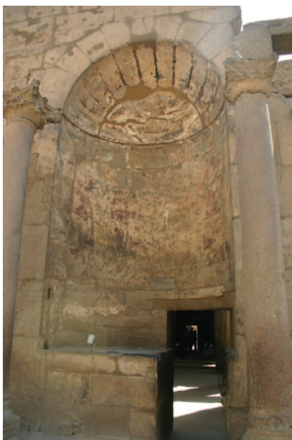
Slika 18. Svetište hramskog kompleksa u Luksoru

U stražnjem dijelu svetišta nalazi se i mala prostorija u kojoj se čuvala pomična sveta barka bogova. Kako je ona izgledala, moguće je vidjeti u hramu Horusa u Edfu gdje se nalazi replika jedne takve barke (Slika 19). Barka se koristila za transport božanskih prikaza (statua, stela) tijekom raznovrsnih ceremonija i procesija te je u drevnim vremenima bila nošena na ramenima svećenika. Scene jedne takve procesije urezane su na zidove hrama Horusa u Edfu (Slika 20).