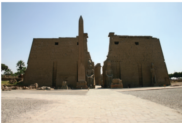
Slika 11. Obelisk i kolosalni kipovi Ramzesa II. ispred ulaza u hramski kompleks Luksora