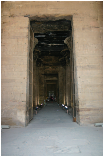
Slika 16. Ulaz u hipostilnu dvoranu hrama Horusa u Edfu

Iza otvorenog dvorišta prostire se nadsvođeni sveti dio staroegipatskog hrama koji nije bio dostupan običnom puku. Prvi dio ovoga svetog područja je hipostilna dvorana koja slijedi glavnu središnju os svakoga staroegipatskog hrama i u koju se ulazi kroz centralna vrata u vanjskom dvorištu hrama. Hipostilna je dvorana mračno mistično mjesto s brojnim dekoriranim ispisanim stupovima koji stoje u redovima (Slika 16).