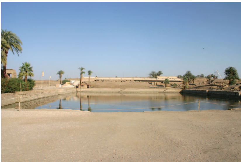
Slika 22. Sveto jezero u hramu Amona u sklopu hramskog kompleksa Karnaka (Fotografija: M. Tomorad 2006)

(npr. Pompeji u Italiji) ovakva su jezera također služila prilikom izvođenja raznih mističkih rituala. 30 Najbolje očuvana sveta jezera danas su vidljiva u kompleksu u hramskom kompleksu Karnaka u hramu Amona (Slika 22) i hramu Montua.