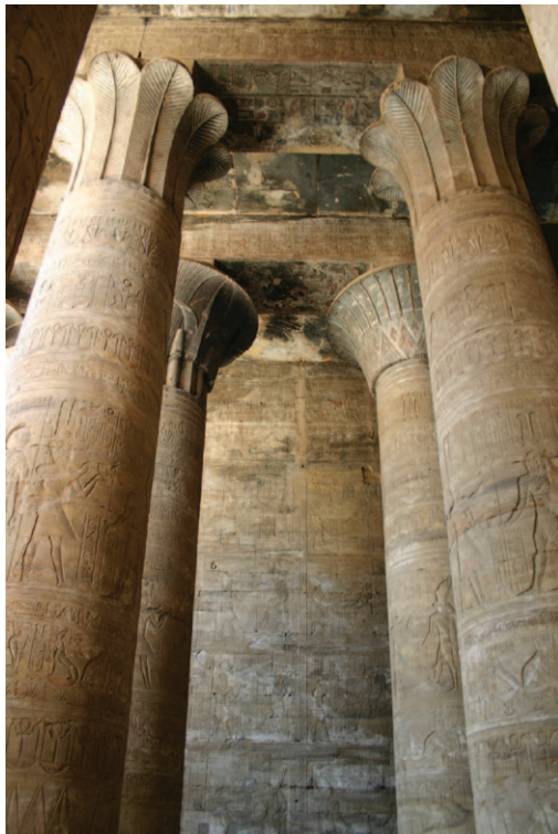
Slika 9. Stupovi u obliku papirusa. Hram Horusa u Edfu

Hram također sadrži simboliku solarnog kruga i njegova glavna os simbolizira sunčev put: od jutarnjeg izlaska, koji je simboliziran hramskim pilonom koji predstavlja horizont (eg. akhet ), do večernjeg zalaska u tami unutrašnjeg svetišta. 15 Obelisci i stupovi, izrađeni u formi papirusa, simboliziraju pak sunčevu putanju i otvaranje biljaka dodirnete od svjetlosnih zraka (Slika 9). 16