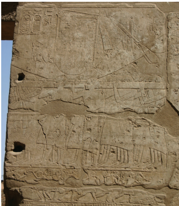
Slika 25. Scene festivala „Predivne svetkovine Opet“ u hramskom kompleksu Luksor

Neki festivali bili su također vezani uz kult Ozirisa poput Festivala „Odlaska“ Ozirisa iz Abidos i svetkovine Hilaria ili Inventio Osiridis . Ove svetkovine zaokružuju krug tuge nakon ubojstva Ozirisa i ponovne radosti nakon njegova uskrsnuća. 39