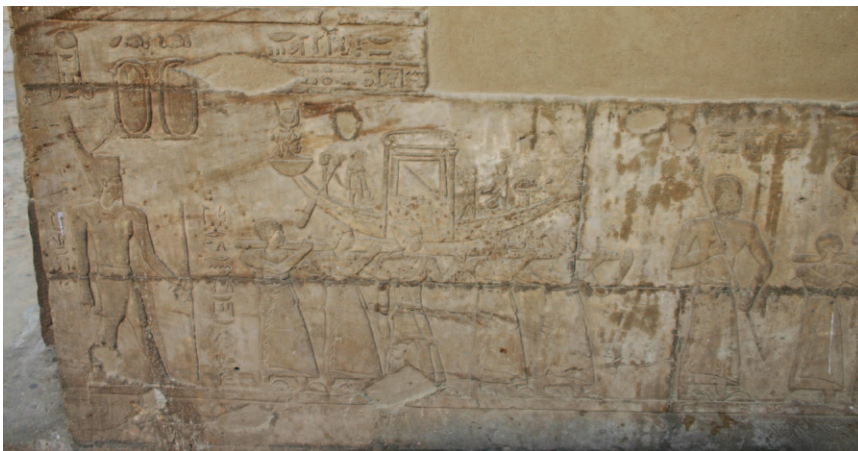
Slika 20. Procesija svete barke tijekom festivala „Svetkovine lijepog susreta“ urezane uzduž zidova hrama Horusa u Edfu

U nekim hramovima također su se nalazile svete prostorije posvećene kultu pojedinih bogova. U hramu Setija I 26 u Abidosu tako se nalazi kompleks posvećen kultu Ozirisa.