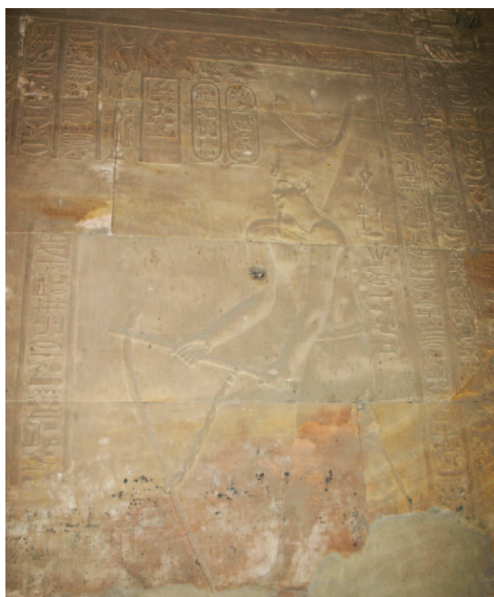
Slika 24. Ceremonija osnivanja hrama. Zidni freska iz hrama Horusa u Edfu

Uz dnevne rituale, tijekom godine su se u raznim hramovima izvodili i festivali posvećeni pojedinim bogovima. 35 Festivalski rituali bili su povezani uz neko božanstvo u čije su ime i izvođeni. Bila je to ujedno i jedinstvena prilika da običan egipatski puk ima direktan doticaj s bogovima i ritualima tijekom kojih se puk okupljao izvan hramskih zidina te sudjelovao u procesija koje su tamo izvođene. 36