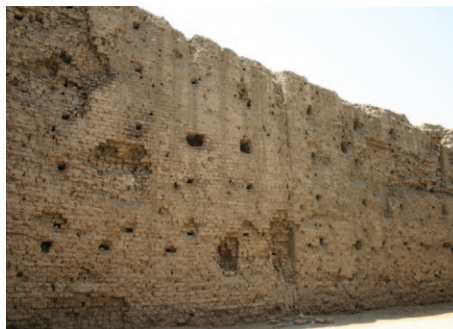
Fig. 13 Ostatci vanjskih zidova hrama Horusa u Edfu (Fotografija: M. Tomorad 2006)