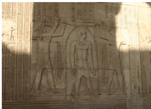
Slika 6. Scena pročišćenja faraona. Hram Sobeka u Kom Ombu