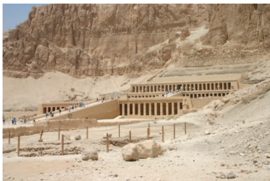
Slika 1. Posmrtni hram kraljice Hatšepsut 2 u Deir el-Bahriju

U suvremenom je Egiptu očuvano na stotine staroegipatskih hramova koje su u drevnim vremenima posjećivali vjernici i vladari, a danas ih uglavnom posjećuju znanstvenici i turisti iz cijeloga svijeta (Slika 1).