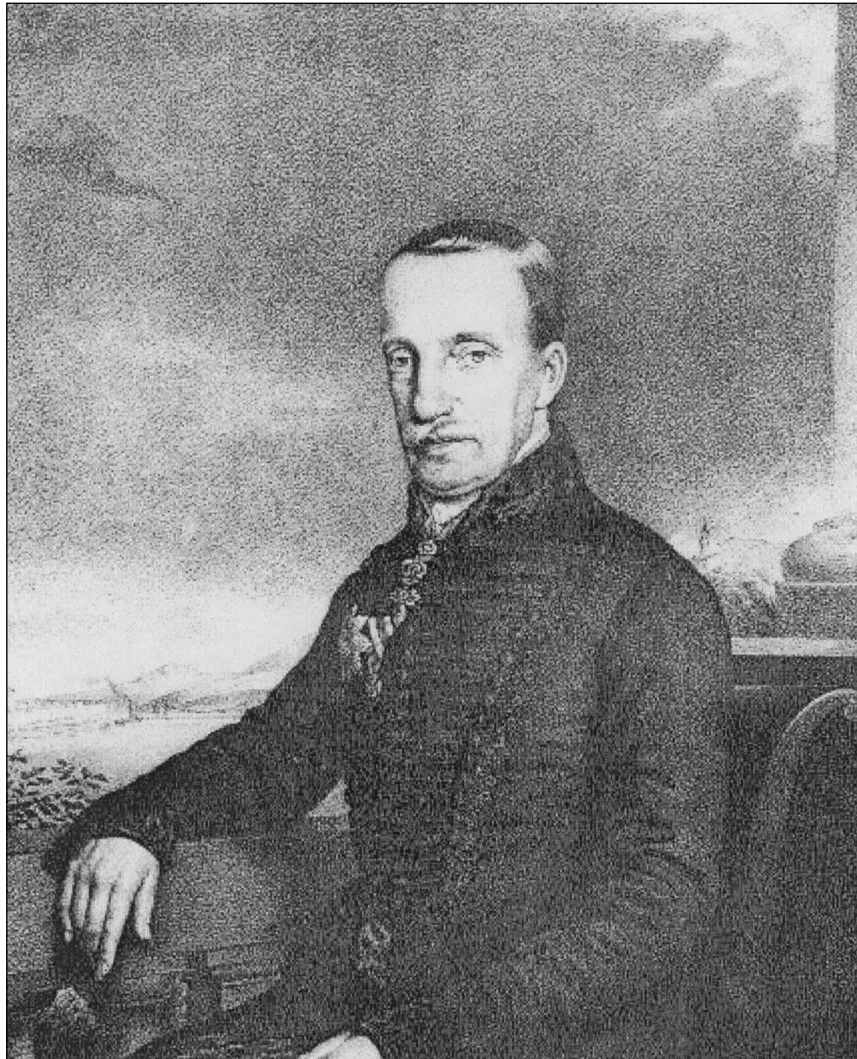
Austrijski nadvojvoda i ugarski palatin Josip Antun Ivan (Krstitelj)