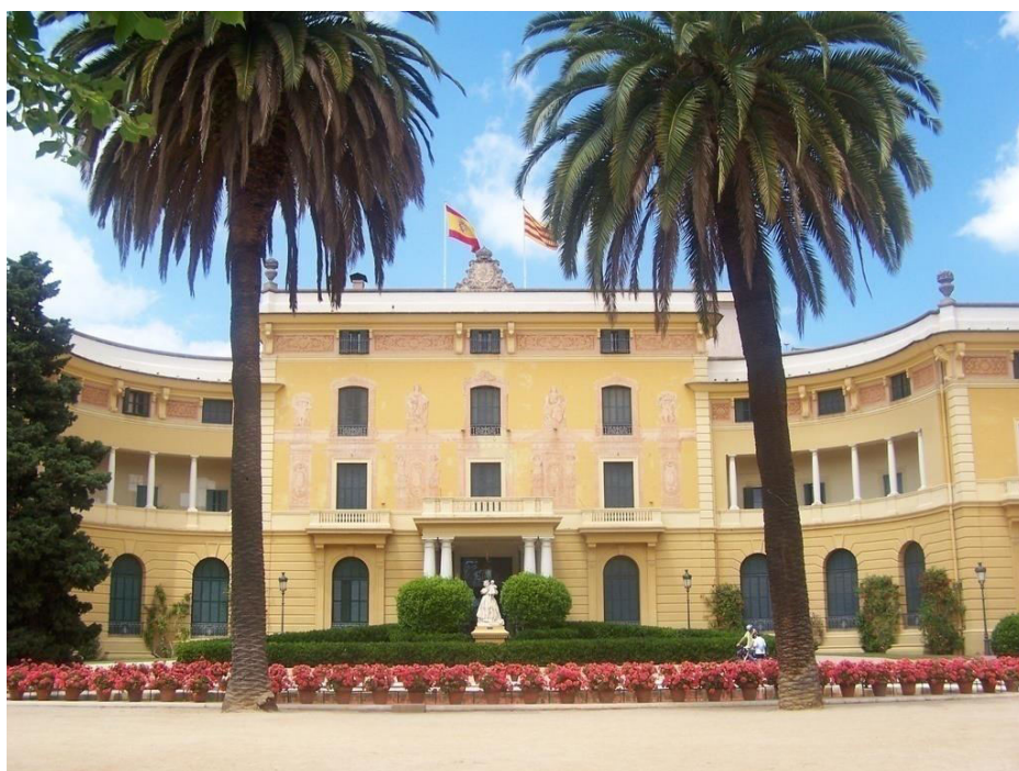
Sl.6. Kraljevska palača u Pedralbesu (Barcelona), sjedište Unije za Mediteran

Unija za Mediteran je multilateralno partnerstvo 43 zemlje iz Europe i Sredozemnog bazena, 28 država članica Europske unije i 15 mediteranskih zemalja partnera iz sjeverne Afrike, Bliskog istoka i Balkana.