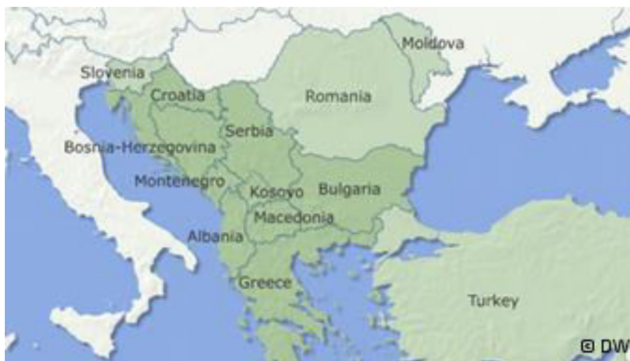
Slika 2. Karta regije Jugoistočna Europa