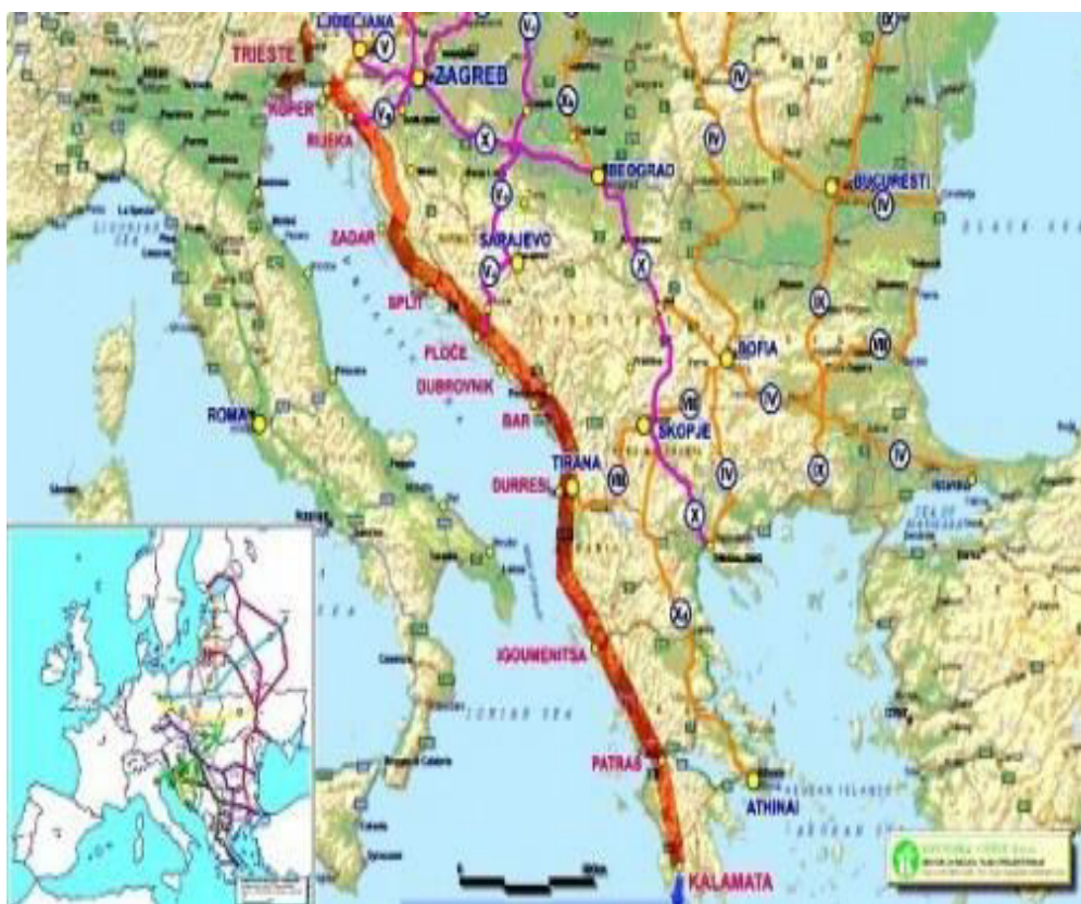
Slika 4. Trasa Jadransko-jonske autoceste, preuzeto s www.dubrovnikpress.hr/index.php?option=com_k2&view=item&id=1041:što-je-to-zapravo-jadransko-jonska-autocesta?Itemid=68 (10.srpanj 2013.)

izgradnjom prometnog pravca Ploče-Budimpešta. Kako drugačije protumačiti izjave bivšeg hrvatskog premijera Zorana Milanovića kako će Dubrovnik povezati s Hrvatskom preko susjedne BiH kad je poznato da je to teritorij kojim dijelom prolazi upravo trasa Jadransko-jonske autoceste. 259 Na svojoj balkanskoj turneji (po zemljama bivše Jugoslavije) bivši hrvatski predsjednik Ivo Josipović sastao se s predsjednikom Crne Gore Filipom Vujanovićem (3. rujna 2013) te su razgovarali o projektu jadransko-jonske autoceste i o regionalnim inicijativama u kojima sudjeluju dvije zemlje. O ovoj cesti razgovaralo se i unutar sastanka u Dubrovniku u sklopu inicijative Brdo-Brijuni 15. srpnja 2014. godine. Prometni pravac često je spominjala i sadašnja hrvatska predsjednica Kolinda Grabar-Kitarović. Jadransko-jonska cesta često je aktualna tema na regionalnim sastancima političara (premijera, predsjednika), ali nema pomaka prema napretku tog važnog projekta.