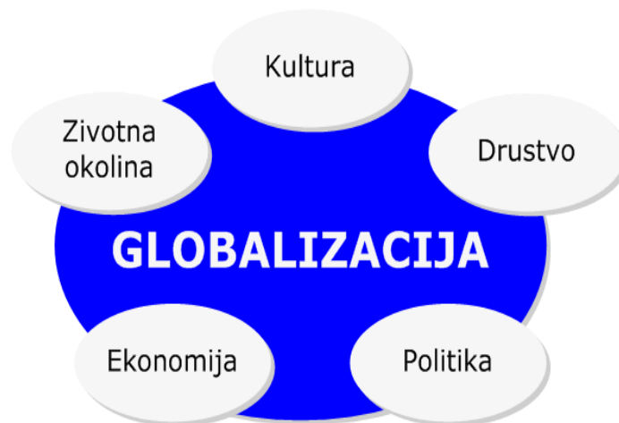
Slika 1. Prikaz područja svakodnevnog života koje je zahvatila globalizacija,

Globalizacija se kao pojam upotrebljava u sociološkoj, političkoj i ekonomskoj znanosti, a usko je povezana uz proces modernizacije i tranzicije. Priznata i važeća definicija tog pojma ne postoji ni u znanstvenoj ni u javnoj debati. Riječ globalizacija upućuje na nešto globalno, planetarno zaokruženo, nešto što se odnosi na čitav planet. Ona je posljednji stadij u neprestanom procesu društvene promjene. 92 Termin je nastao prije trideset godina za objašnjenje novog vala promjena u gospodarstvu, tehnologiji i društvu. Pravi povijesni početak globalizacije je 1989. godina, potaknut novim informatičkim tehnologijama i uvezivanjem svijeta u mrežu. Većina se slaže da je globalizacija stara – nova pojava. Stara zbog čovjekova nastojanja glede širenja moći, a nova zato što je povezivanje i osnaživanje danas, zahvaljujući modernim tehnologijama, čovjeka izdiglo iznad svih minulih epoha. 93 Brže su se mijenjale naprednije i modernije zemlje.