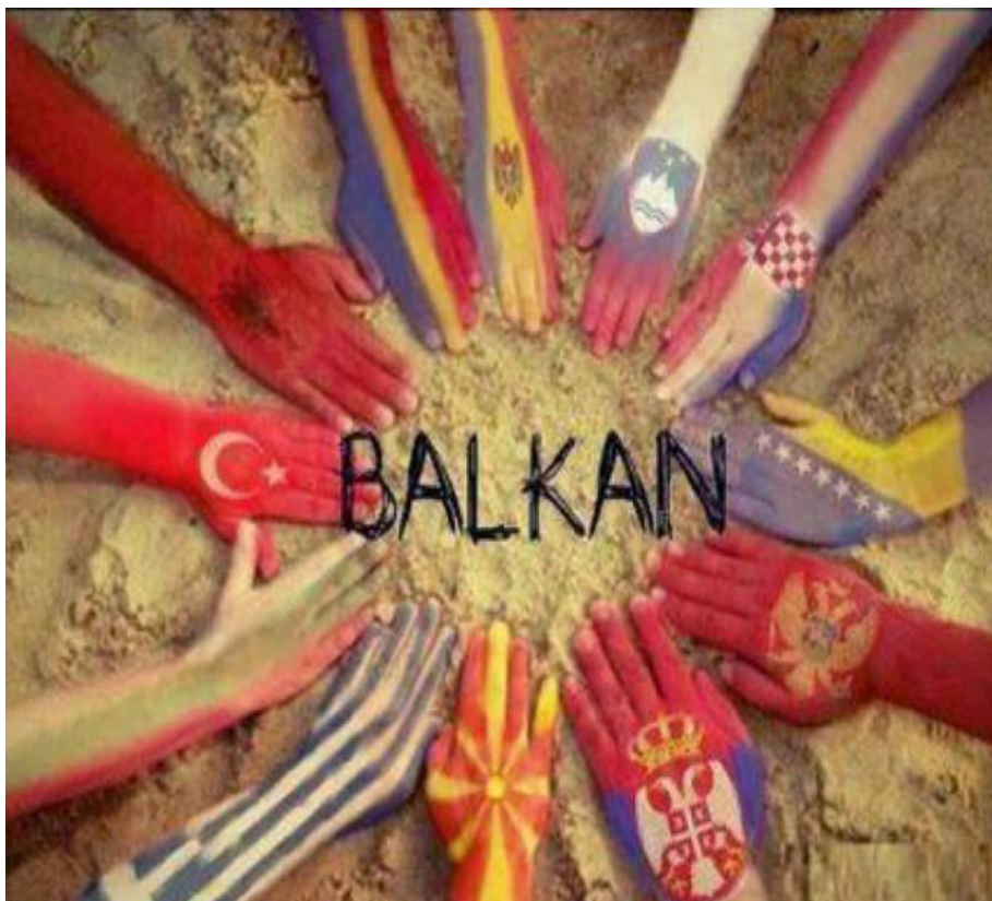
Slika 3. Fotografija koja prikazuje suradnju zemalja jugoistočne Europe

Napomena: Skraćene nazive regionalnih organizacija i inicijativa pisani su prema njihovom službenom nazivu na engleskom ili njemačkom jeziku.