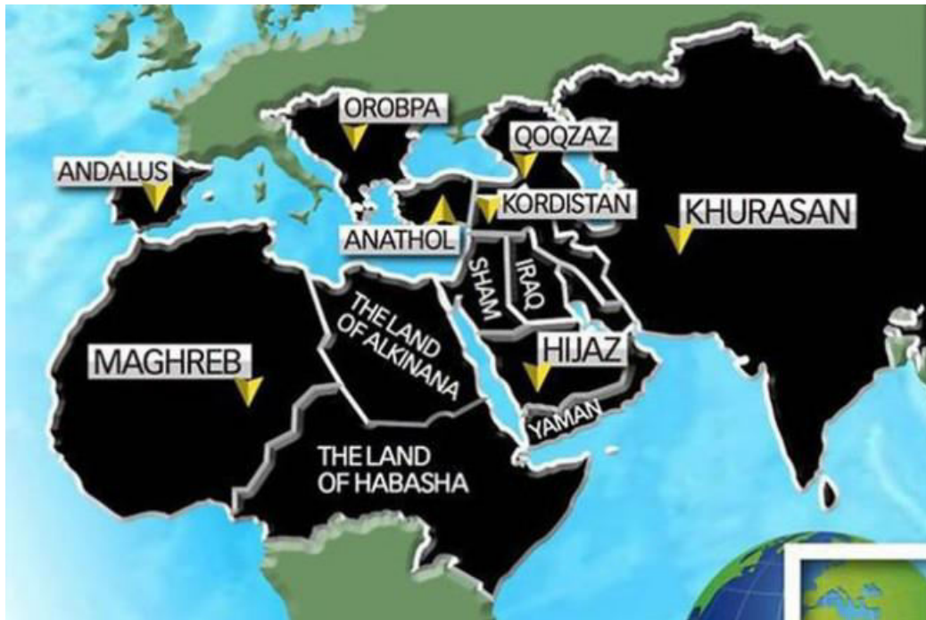
Sl.7. Karta kako bi do 2020. trebala izgledati Islamska država

Nju će već netko uništiti, muslimani ili nemuslimani (SAD – Iran), pitanje je samo cijene koja će biti plaćena u ljudskim životima i uništenim resursima. 506 Marokanski teolog Omar al-Haduči nazvao je ISIL „otpadnicima vjere“ jer zagovaraju ubijanje ostalih muslimana.