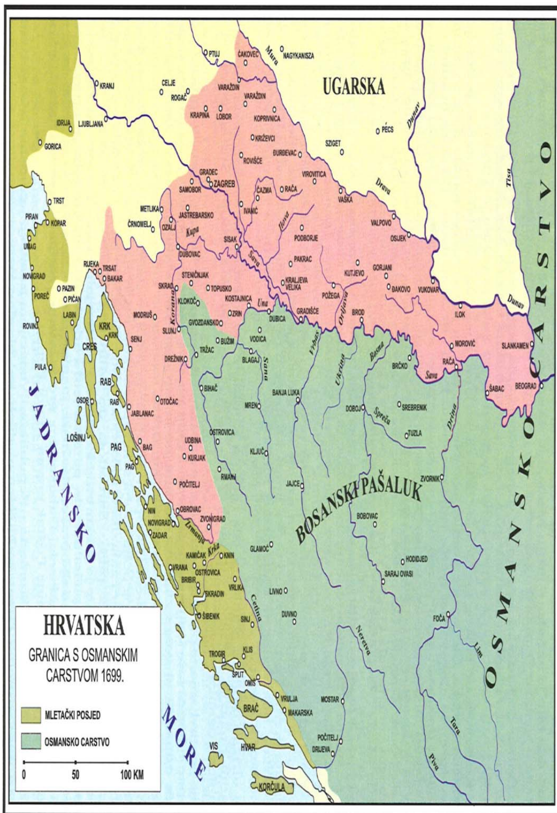
Karta 4. Granica razgraničenja prema miru u Srijemskim Karlovcima 1699.