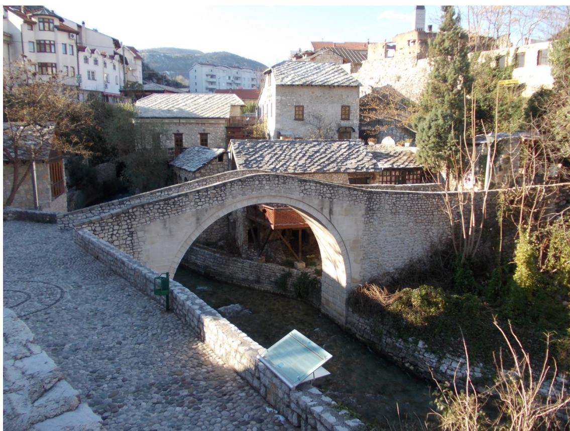
Slika 5. Kriva ćuprija na donjem toku rijeke Radobolje u Mostaru