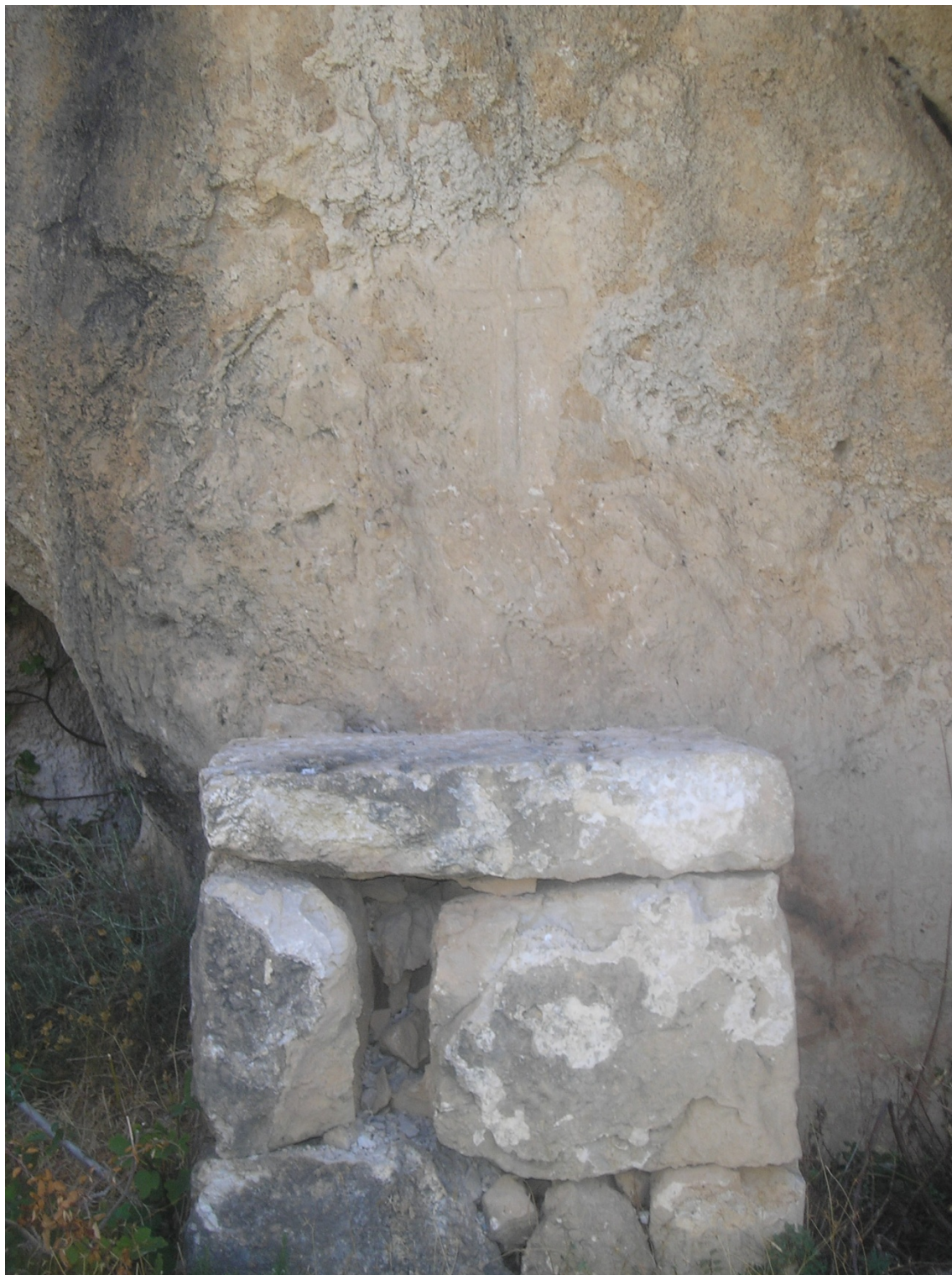
Slika 1. Kameni oltar iz 16. st. u Hutovu, mjesto Vrutak. U stijeni iznad oltara uklesan je znak križa.