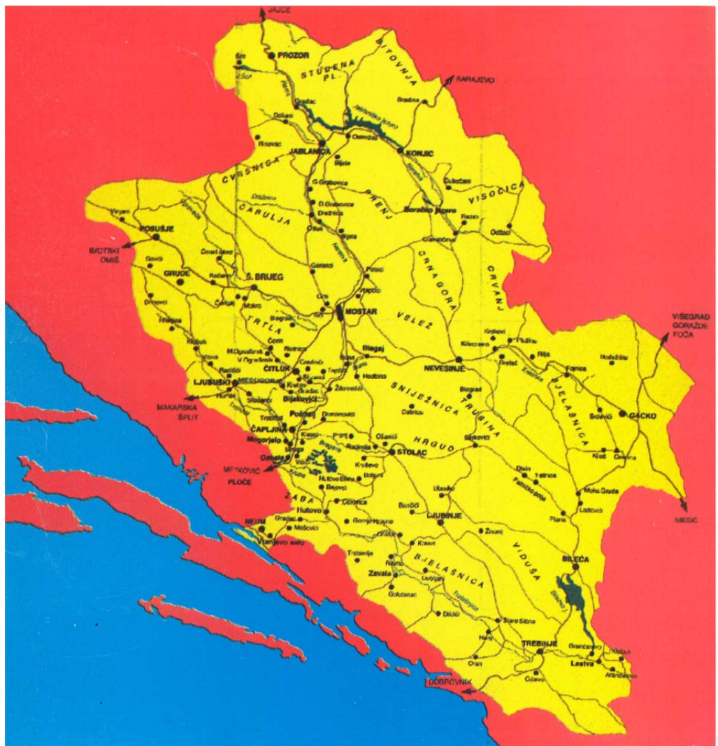
Karta 5: Granice današnje Hercegovine