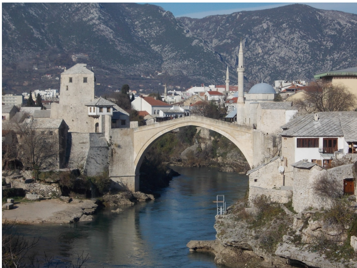
Slika 4. Stari most u Mostaru kojeg je na molbu građana Mostara polovicom 16. st. dao izgraditi sultan Sulejman Zakonodavac