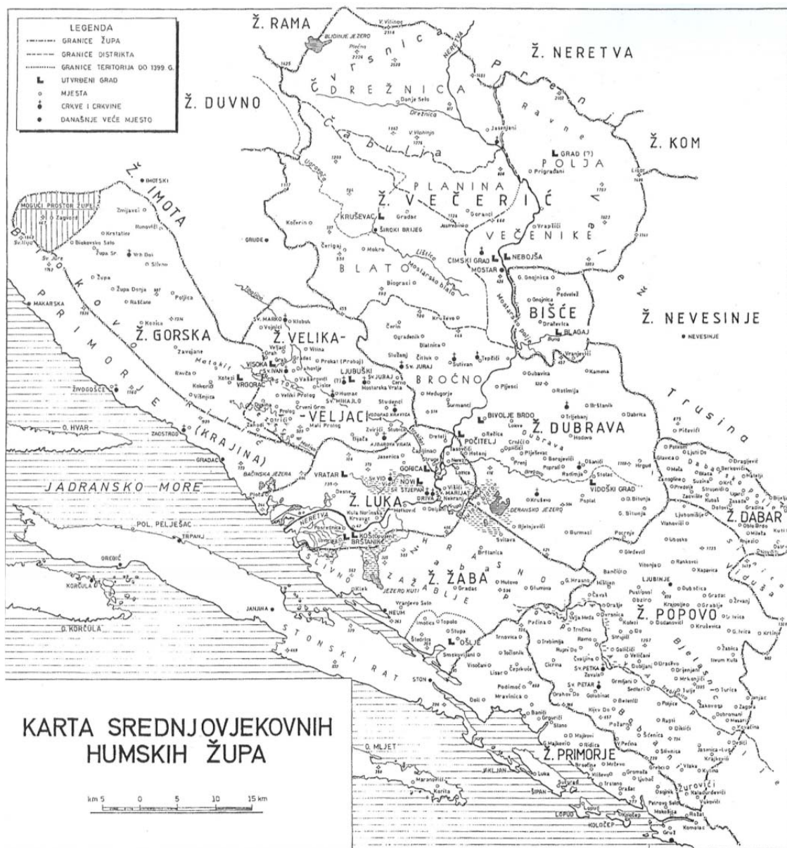
Karta 1: Srednjovjekovne humske župe