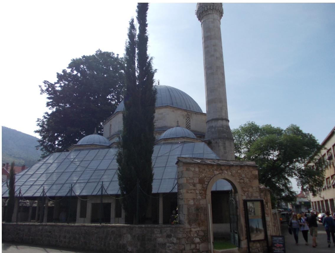
Slika 2. Karadoz-begova džamija u Mostaru, izgrađena 1557./58.