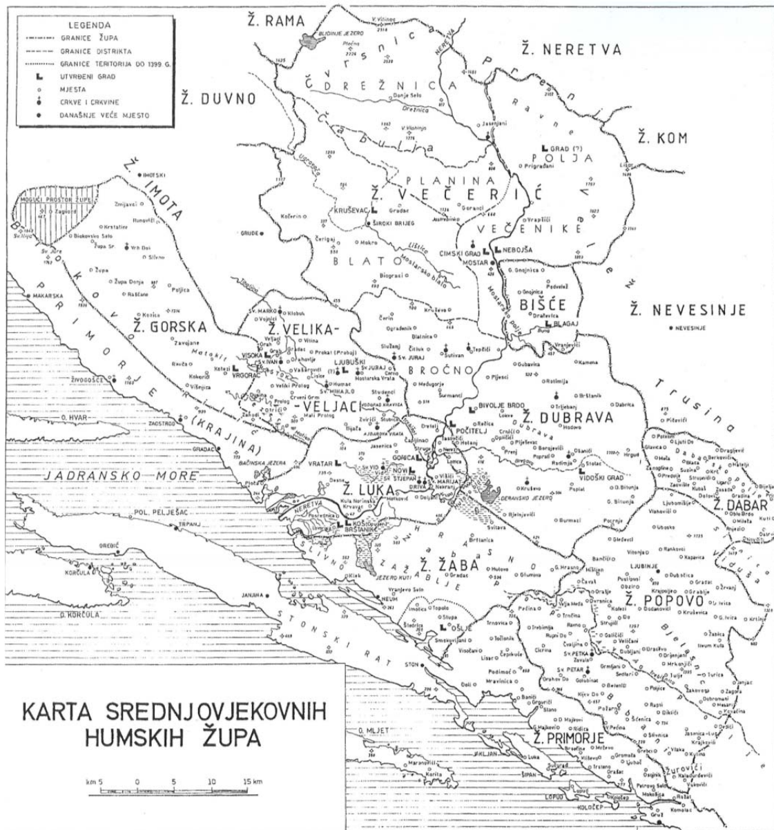
Karta 1: Srednjovjekovne humske župe