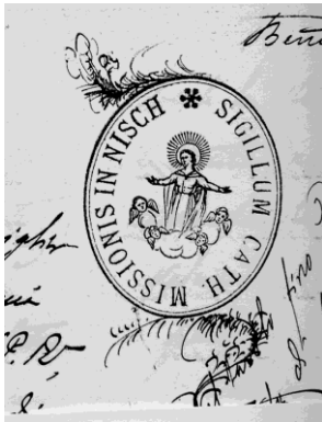
Figura 2: Contrassegno della missione cattolica di Niš, ASBR.