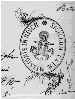
Figura 2: Contrassegno della missione cattolica di Niš, ASBR.