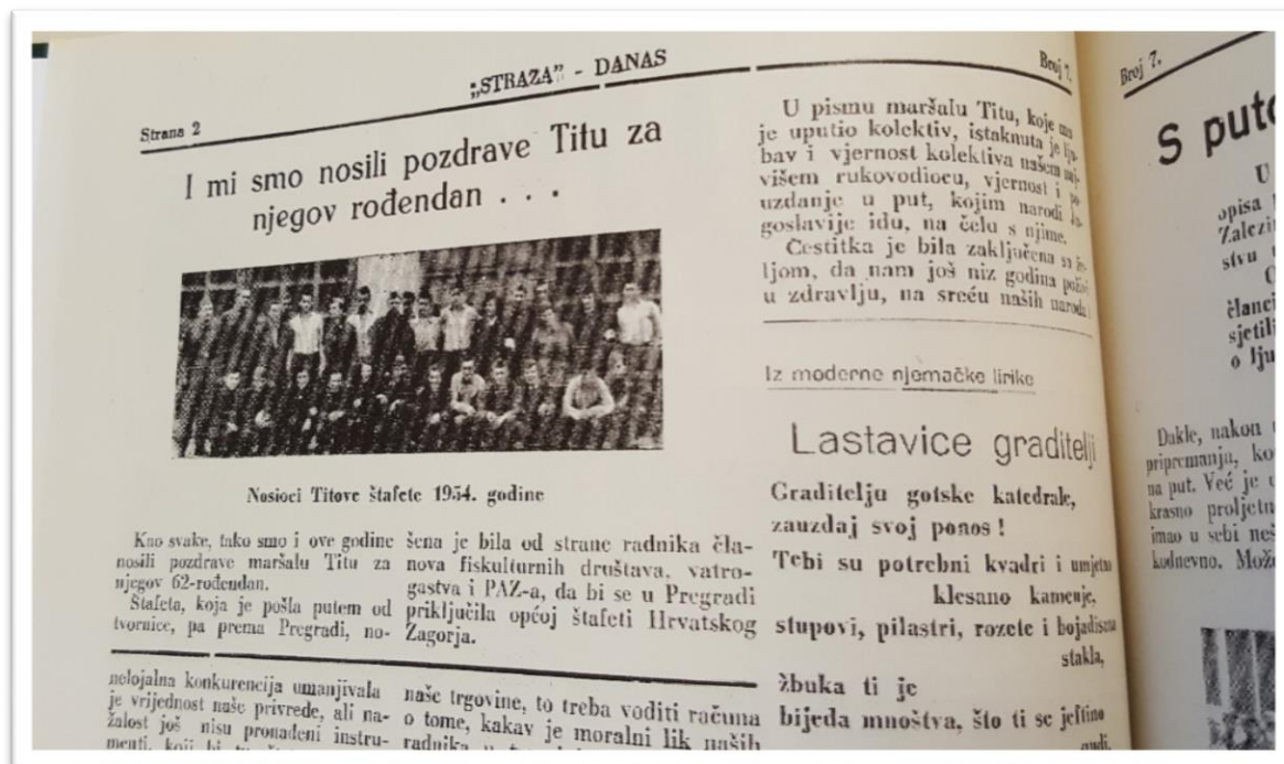
Slika 4. Dio poglavlja iz humskog časopisa Stráža danas iz 1954. godine, o sudjelovanju odraslih Humčana u nošenju štafete.