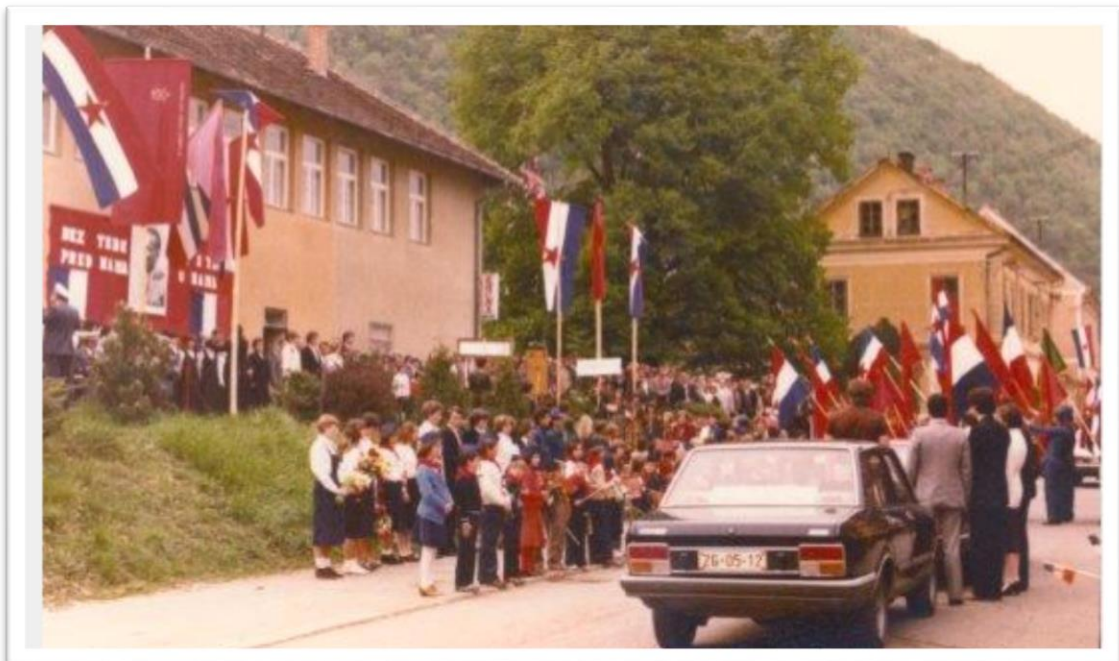
Slika 2. Slavljenje 1. Maja u Pregradi, u kojem sudjeluju i humski pioniri, godina nepoznata.