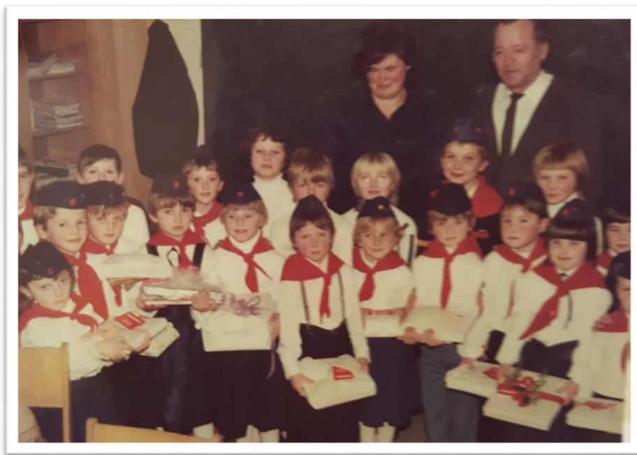
Slika 3. Pioniri područne škole Taborsko, godina nepoznata, fotografija u vlasništvu Zorice Korbar.