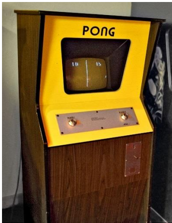
Slika 2. Igra Pong