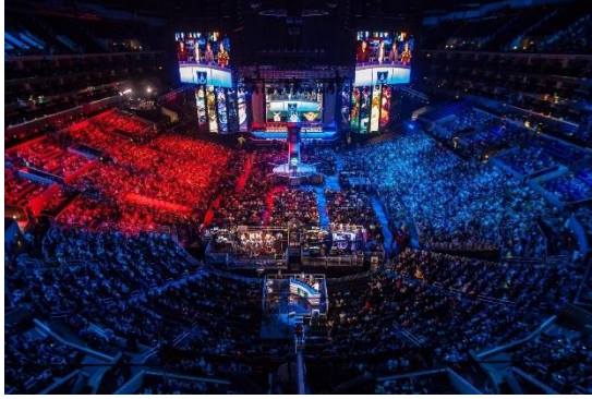
Slika 7. Finale svjetskog LoL prvenstva 2013. godine