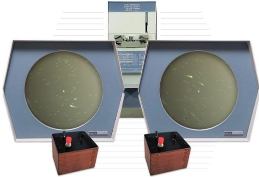
Slika 1. Igra Spacewar!