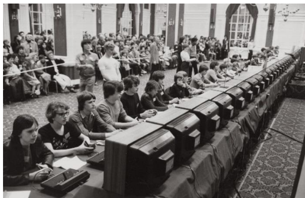
Slika 6. Prvo natjecanje u računalnim igrama