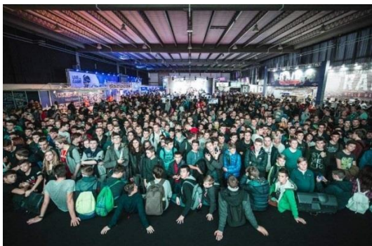
Slika 10. Reboot InfoGamer u Zagreb