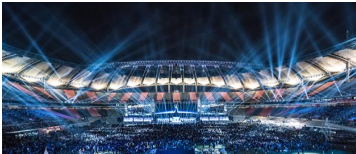
Slika 8. Svjetsko LoL prvenstvo u Južnoj Koreji 2014. godine