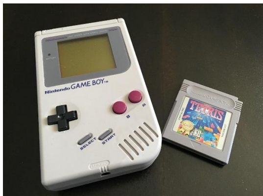
Slika 4. Prvo izdanje Gameboy-a s igrom Tetris