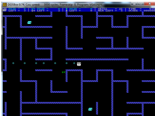
Slika 3. Igra Snipes