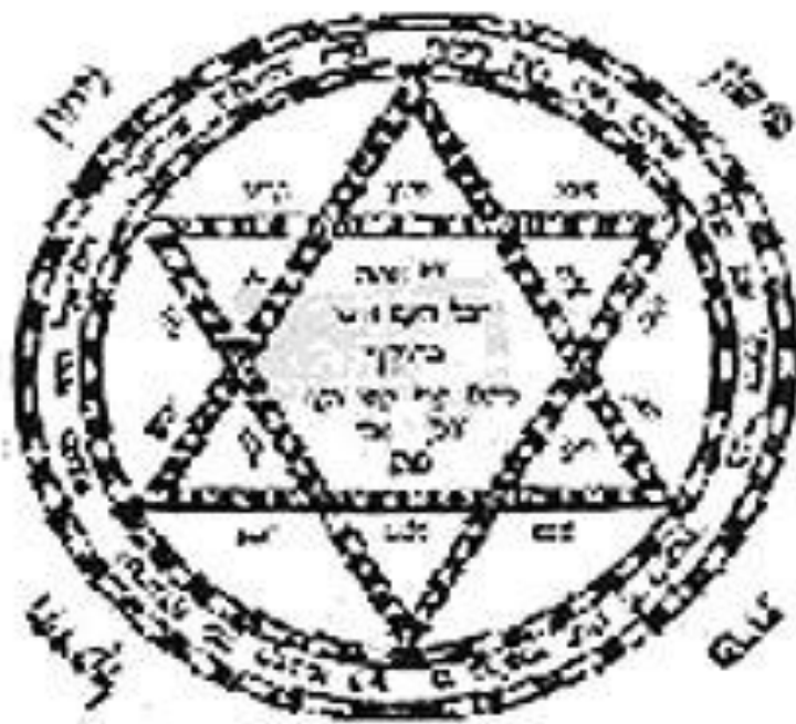
Slika 1. Amulet iz srednjeg vijeka, prikazan u djelu Sefer Raziel 32