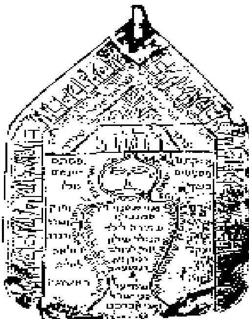
Slika 2. Perzijski amulet iz 19. stoljeća na kojemu je napisano oko ljudske figure „Van, Lilit prva Eva“ 33