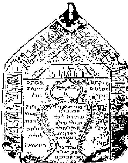
Slika 2. Perzijski amulet iz 19. stoljeća na kojemu je napisano oko ljudske figure „Van, Lilit prva Eva“ 33