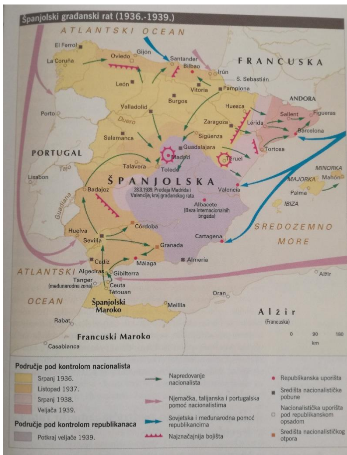
Slika 1. Prikaz područja pod kontrolom dviju strana.

Početak sukoba predvodi general Sanjurjo, no on ubrzo pogiba, a u tome svoju priliku vidi general Franco. Njega na čelo pobune biraju ostali generali, a pobunjenici svoj glavni tabor uspostavljaju na teritoriju Španjolskog Maroka. Državni udar trebao je biti munjevit te iz više smjerova, a započinje istovremeno 17. srpnja 1936. u Španjolskom Maroku, Španjolskoj te na Kanarskim otocima. 5 Iako je prvotni pokušaj udara revolucionarna strana uspjela zaustaviti i obraniti Madrid i ostale velike gradove, kontrarevolucionari odnosno pobunjenici protiv legalne vlasti Narodnog fronta, uspijevaju se zadržati na jugu Španjolske te na sjeveru u pokrajini Navarra odakle će predvoditi daljnje operacije u krvavom trogodišnjem sukobu.