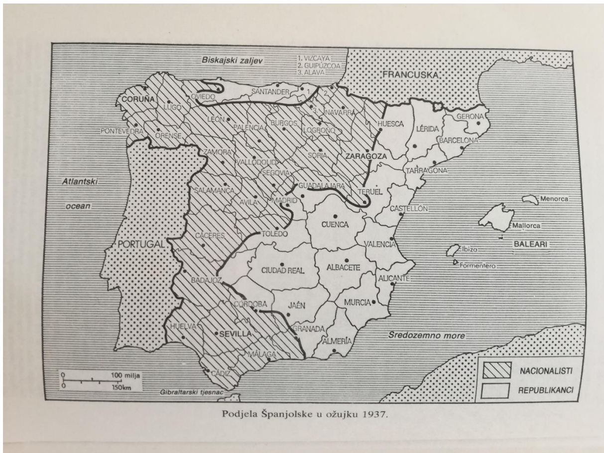
Slika 2. Podjela Španjolske u ožujku 1937. g.

Godine 1938. Komitet donosi odluku o povlačenju svih stranih brigada i „dobrovoljaca“ iz Španjolske, no zemlju su napustile samo internacionalne brigade što je uvelike oslabilo republikanske snage koje su ostale bez svojih najboljih postrojbi. 23 Nacionalisti redom osvajaju područja jugozapadne Španjolske, sjeverni dio države te na koncu dolaze i do obale Sredozemnog mora te osvajaju Kataloniju koja će nakon rata doživjeti tešku represiju kao odgovor na najžešći otpor koji je dolazio iz te pokrajine za vrijeme rata.