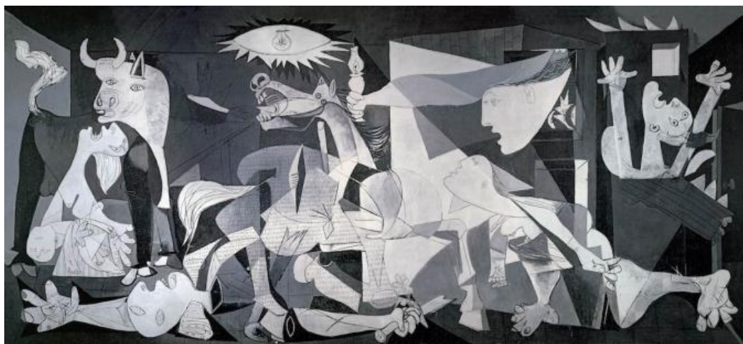
Slika 4. Picasso – Guernica.

Kada govorimo o umjetnosti i Španjolskom građanskom ratu, moramo spomenuti jedan od simbola tog razdoblja, a to je Picasso i njegova slika Guernica.