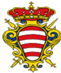
Slika 1. Grb Dubrovnika