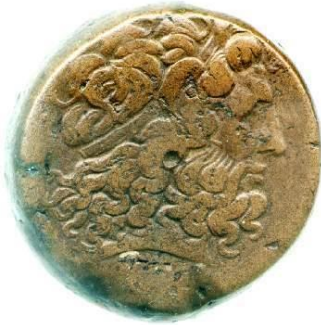
Slika 6. Ptolemej VI. kao Zeus-Amon

Njega nasljeđuju Ptolemej VI. Filometor (180. – 145. g. pr. Kr.), Ptolemej VIII. Euerget II. (170. – 116. g. pr. Kr.) i Kleopatra II. (132. – 130. g. pr. Kr., 124. – 116. g. pr. Kr.). 36 Njihove vladavine su opterećene neprestanim dinastičkim sukobima. 37 U jednom trenutku cijeli Egipat, osim Aleksandrije, bit će u rukama Antioha IV. iz dinastije Seleukida, koji se nakon intervencije rimskog senata povlači. 38 Libija i Cipar od tog vremena više nisu pod direktnom kontrolom Egipta, već se često nalaze pod upravom prognanih Ptolemejevića. 39 Slabi mir se postiže oko 124. g. pr. Kr., kada Ptolemej VIII. i Kleopatra III. (116. – 101. g. pr. Kr.) prekidaju rat sa Kleopatrom II. te oni svi počinju zajedno vladati. 40