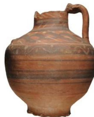
Slika 11. Amfora iz Aleksandrije