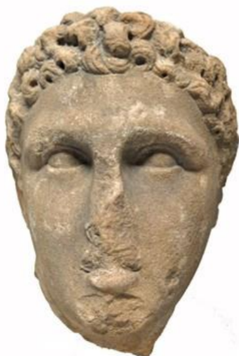
Slika 7. Ptolemej Apion

Njega nasljeđuju Ptolemej VI. Filometor (180. – 145. g. pr. Kr.), Ptolemej VIII. Euerget II. (170. – 116. g. pr. Kr.) i Kleopatra II. (132. – 130. g. pr. Kr., 124. – 116. g. pr. Kr.). 36 Njihove vladavine su opterećene neprestanim dinastičkim sukobima. 37 U jednom trenutku cijeli Egipat, osim Aleksandrije, bit će u rukama Antioha IV. iz dinastije Seleukida, koji se nakon intervencije rimskog senata povlači. 38 Libija i Cipar od tog vremena više nisu pod direktnom kontrolom Egipta, već se često nalaze pod upravom prognanih Ptolemejevića. 39 Slabi mir se postiže oko 124. g. pr. Kr., kada Ptolemej VIII. i Kleopatra III. (116. – 101. g. pr. Kr.) prekidaju rat sa Kleopatrom II. te oni svi počinju zajedno vladati. 40