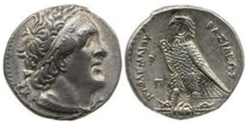
Slika 2. Ptolemej I.

velebne projekte izgradnje gradova i obnove hramova, koje uglavnom dovršavaju njegovi nasljednici. 19 Tako na pustom i kamenitom otočiću Faru, pored Aleksandrije, započinje izgradnju svjetionika, koji će postati najveća naseljiva struktura na svijetu. 20 Ipak, glavno obilježje njegove vladavine su neprestani ratovi s drugim dijadosima i rivalima. Zbog želje da