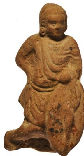
Slika 12. Vojnik naslonjen na galski štit

„domaći“ se podrazumijevalo konjanike koji su imali svoja zemljišta na području Egipta (većinom u nomama Fajum i Oksirink). 138 Oni su uglavnom dolazili iz Makedonije i drugih dijelova Grčke, a zemlja im je bila dodijeljena u zamjenu za vojnu službu. 139 Temelj vojske su sačinjavali teški pješaci čiji je sastav bio osobito mješovit. Osim kraljevske straže, falanga, Libijaca i najamnika iz Grčke također je bio prisutan i znatan broj Egipćana (koji su po prvi put bili teško oklopljeni). 140 Ptolemej I. već uvodi Egipćane u svoju vojsku (u bitki kod Gaze 312. g. pr. Kr.), ali tada nisu imali izraženu ulogu ili čak dostatnu opremu. 141 Treću skupinu kod Rafije su činili laki pješaci iz Krete, Trakije i Galacije. Kelti iz Galacije su često služili kao najamni vojnici na području istočnoga Sredozemlja te su se neki čak naselili u Egiptu. 142 Slonovi su dio egipatske vojske od vladavine Ptolemeja I. koji je prve slonove nabavio od poraženih neprijatelja. 143 Treba napomenuti da su egipatski slonovi (šumski slonovi) kod Rafije bili slabiji (manji) od onih indijskih koje su Seleukidi imali na raspolaganju. 144