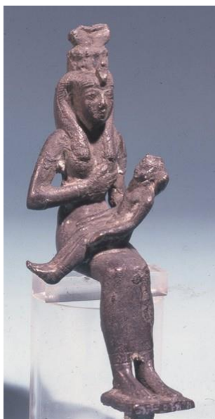
Slika 14. Izida i Harpokrat

Staroegipatski kultovi Izide i Ozirisa počeli su se štovati među grčkim polisima (Atena i Pirej) na Egejskom moru barem od početka IV. st. pr. Kr. 168 , a bili su poznati na tim prostorima i ranije (Izida). 169 Od početka III. st. pr. Kr. počinje naglo širenje istočnih kultova, uključujući i egipatskih, po Sredozemlju što se prvenstveno može pripisati propadanju ahemenidske države. 170 Prodiranje egipatskih artefakata i pogrebnih običaja na istočnom Sredozemlju zabilježeno je još u kasnom razdoblju čemu svjedoči mumija Nesu-hensu omotana lanom koji je ispisan etruščanskim pismom. 171 U helenističkom periodu (ali i ranije), grčka božanstva su se poistovjećivala sa egipatskim (Zeus-Amon, Apolon-Horus, i dr.) 172 te se postepeno tijekom vladavine Ptolemeja I. uvode prvi sinkretistički bogovi, od kojih je „sveti bog“ Serapis 173 postao