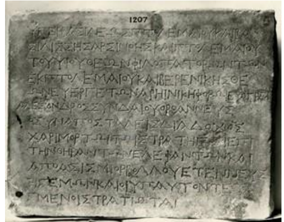
Slika 13. Stela koja slavi uspješan lov na slonove

Egipatsku vojsku u tom razdoblju možemo podijeliti u dvije skupine. Prva grupa su posade vojnika raspoređenih po zemlji u cilju da se suzbiju pobune. 152 Imali su sve važniju ulogu od 2. st. pr. Kr. kada ustanci na području Gornjeg Egipta postaju sve učestaliji. 153 Drugu grupu čine vojni naseljenici koji su služili kao rezerve te oni sve više zamjenjuju najamnike u standardnoj vojsci. Prvotno su to bili došljaci iz egejskih prostora, koji su zemlju dobivali na temelju svojeg statusa u vojsci 154 , a od 2. st. pr. Kr. zemljišta na kraljevom posjedu su dobivali i egipatski vojnici, iako su njihova bila puno manja. 155 Postojale su također razne paravojne postrojbe, koje su isto dobivale zemljišta, što bi moglo sugerirati strogi nadzor nad svakodnevnim životom. 156