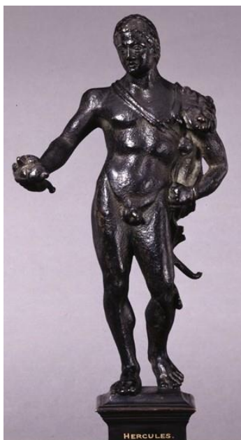
Slika 3. Ptolemej III.

velebne projekte izgradnje gradova i obnove hramova, koje uglavnom dovršavaju njegovi nasljednici. 19 Tako na pustom i kamenitom otočiću Faru, pored Aleksandrije, započinje izgradnju svjetionika, koji će postati najveća naseljiva struktura na svijetu. 20 Ipak, glavno obilježje njegove vladavine su neprestani ratovi s drugim dijadosima i rivalima. Zbog želje da