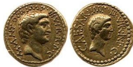
Slika 8. Marko Antonije (lijevo) i Oktavijan (desno)

Julijem Cezarom i Markom Antonijem. Godine 47. pr. Kr. rodio se Ptolemej XV. Cezarion (44. – 30. g. pr. Kr.), za kojeg Kleopatra tvrdi da je Cezarov sin. 48 Kasnije da sebi osigura vlast, Kleopatra daje ubiti svoga mlađeg brata Ptolemeja XIV. (47. – 44. g. pr. Kr.). 49 Tijekom njezine veze sa Markom Antonijem, izgledalo je da će ptolemejski Egipat doživjeti uspon na položaj najmoćnije sile na istočnom Sredozemlju. Ipak, nakon bitke kod Akcija 50 , Kleopatra i Antonije bježe u Aleksandriju, gdje će ubrzo počinuti samoubojstvo. 51 Njihova smrt označava kraj faraonskog razdoblja povijesti Egipta.