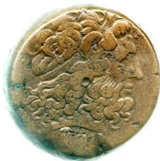
Slika 6. Ptolemej VI. kao Zeus-Amon

Njega nasljeđuju Ptolemej VI. Filometor (180. – 145. g. pr. Kr.), Ptolemej VIII. Euerget II. (170. – 116. g. pr. Kr.) i Kleopatra II. (132. – 130. g. pr. Kr., 124. – 116. g. pr. Kr.). 36 Njihove vladavine su opterećene neprestanim dinastičkim sukobima. 37 U jednom trenutku cijeli Egipat, osim Aleksandrije, bit će u rukama Antioha IV. iz dinastije Seleukida, koji se nakon intervencije rimskog senata povlači. 38 Libija i Cipar od tog vremena više nisu pod direktnom kontrolom Egipta, već se često nalaze pod upravom prognanih Ptolemejevića. 39 Slabi mir se postiže oko 124. g. pr. Kr., kada Ptolemej VIII. i Kleopatra III. (116. – 101. g. pr. Kr.) prekidaju rat sa Kleopatrom II. te oni svi počinju zajedno vladati. 40