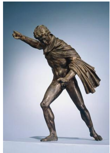
Slika 1. Aleksandar III. Veliki

Početak vladavine makedonske dinastije nad Egiptom započinje kasno u jesen 332. g. pr. Kr. 1 Aleksandar III., poslije smrti nazvan Veliki, pojavio sa svojom vojskom kod grada Peluzija, koji se nalazio na istočnom rubu Nilske delte. 2 Aleksandar je bez sukoba preuzeo i uspostavio svoju vlast. 3 Za razliku od drugih osvojenih područja na zapadu ahenidskog kraljevstva Aleksandar je odlučio vlast nad Egiptom podrediti direktno sebi, dok je lokalnu ekonomiju i administraciju stavio u nadležnost Kleomena, Grka iz Naukratija. 4 U cilju da dodatno ozakoni svoju vlast, Aleksandar je posjetio razna svetišta, čija su se božanstva često poistovjećivala sa grčkim. U oazi Siwa, koje se nalazilo u Libijskoj pustinji, poklonio se bogu Amunu, kojega su Grci poistovjećivali sa Zeusom. 5 Ubrzo nakon posjeta proročištu u Siwi, Aleksandar će biti