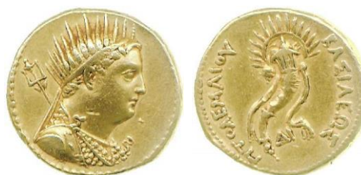
Slika 9. Ptolemej IV.

Proizvodnja kovanica nije bila novost na području Egipta. Nakon što je Psametik I. (664. – 610. g. pr. Kr.) dao dopuštenje Grcima iz Mileta da osnuju grad Naukratij, tamo se ubrzo pojavljuje kovnica novca. 100 U helenističkom periodu vladari su kovali vlastiti novac s izraženim grčkim stilom i natpisima. 101