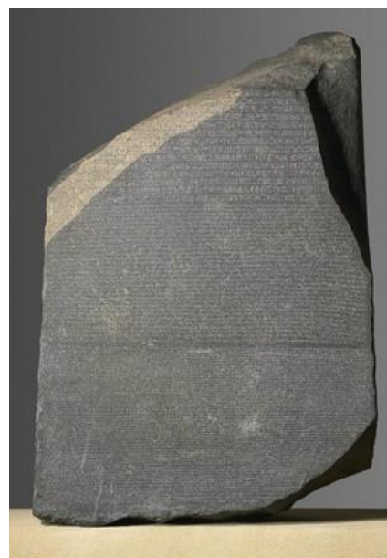
Slika 5. Kamen iz Rozete