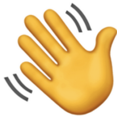
(slika 1., Waving hand , ruka koja maše)

uporaba ovisi o dobi korisnika, spolu i ekonomskome stanju. Emotikoni , kao i geste i znakovi u neverbalnoj komunikaciji, nisu transkulturalni. Na primjer, jedan emotikon u širem smislu, „ruka koja maše“ (slika 1.) u zapadnim zemljama predstavlja pozdrav, a u Kini predstavlja raskid veze ili prijateljstva.