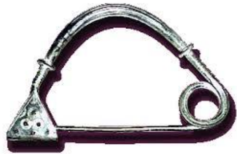
Slika 2. Brončana fibula tipa Golinjevo

Kao što je već spomenuto, Delmati, odnosno Dalmati je bio narod koji je obitavao na području srednje Dalmacije. Nakon što su se preselili na područje srednje Dalmacije dolazi do razvoja tzv. delmatske grupe u starijem željeznom dobu. 36 Važno je spomenuti da se već u kasnom brončanom dobu krenuo razvijati stil koji će obilježiti delmatsku grupu idućih par stoljeća. Primjer za to je brončana fibula tipa Golinjevo koja ima strmo uzdignuti i asimetričan luk. 37