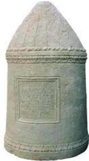
Slika 4. Liburnski cippus

Što se tiče religije kod Liburna susreću se neka božanstva koja se poklapaju sa rimskim božanstvima, poput Anzotice koja se poklapa sa rimskom božicom Venerom. 70 Također, povjesničar Aleksandar Stipčević u svom djelu Iliri navodi da se kod Liburna susreće i božica