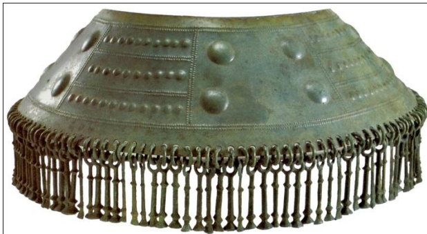
Slika 5. Japodsko pokrivalo za glavu

Japodi su bili narod koji je nastanjivao područje Like i Velebita. Njihova najpoznatija ostavština iz starijeg željeznog doba su dobro poznata oglavlja. Oglavlja su bila nošena i među ženama a pretpostavlja se da su pokazivali kojem društvenom sloju pripada osoba. 89 Prva oglavlja su se vjerojatno izrađivala od kože, no kasnije se izrađuju od brončanog lima. 90 Bili su ukrašeni geometrijskim motivima a na vrhu su bili otvoreni, tako da se vidjela kosa ili je glava na tom dijelu bila prekrivena nekakvom tkaninom. 91 Karakteristično za japodska pokrivala je bilo to što su im sa rubova visili metalni štapići. 92 Važno je