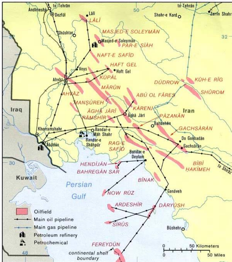
Slika 2: Nafta i plinska polja u Iranu, 1978. godine

uvijek tajnim revolucionarnim vijećem, Sullivan je 9. studenog poslao State departmentu dugi telegram naslovljen Misleći nezamislivo, u njemu je gurnuo Muhameda Rezu u stranu ... Homeni bi imao ulogu poput Gandija i na visoke položaje imenovao bi ljude koji bi bili prihvatljivi prozapadnoj vojsci, a ne ljude tipa Nassera ili Gadafija koje bi on vjerojatno preferirao. Takvim bi se sporazumom izbjegao kaos, bio bi osiguran kontinuiran integritet zemlje, bilo bi spriječeno radikalno vodstvo u preuzimanju vlasti te bi se učinkovito blokiralo sovjetsko gospodarstvo u Perzijskom zaljevu.“ (Bunchan, 2012, pp. 200-215)