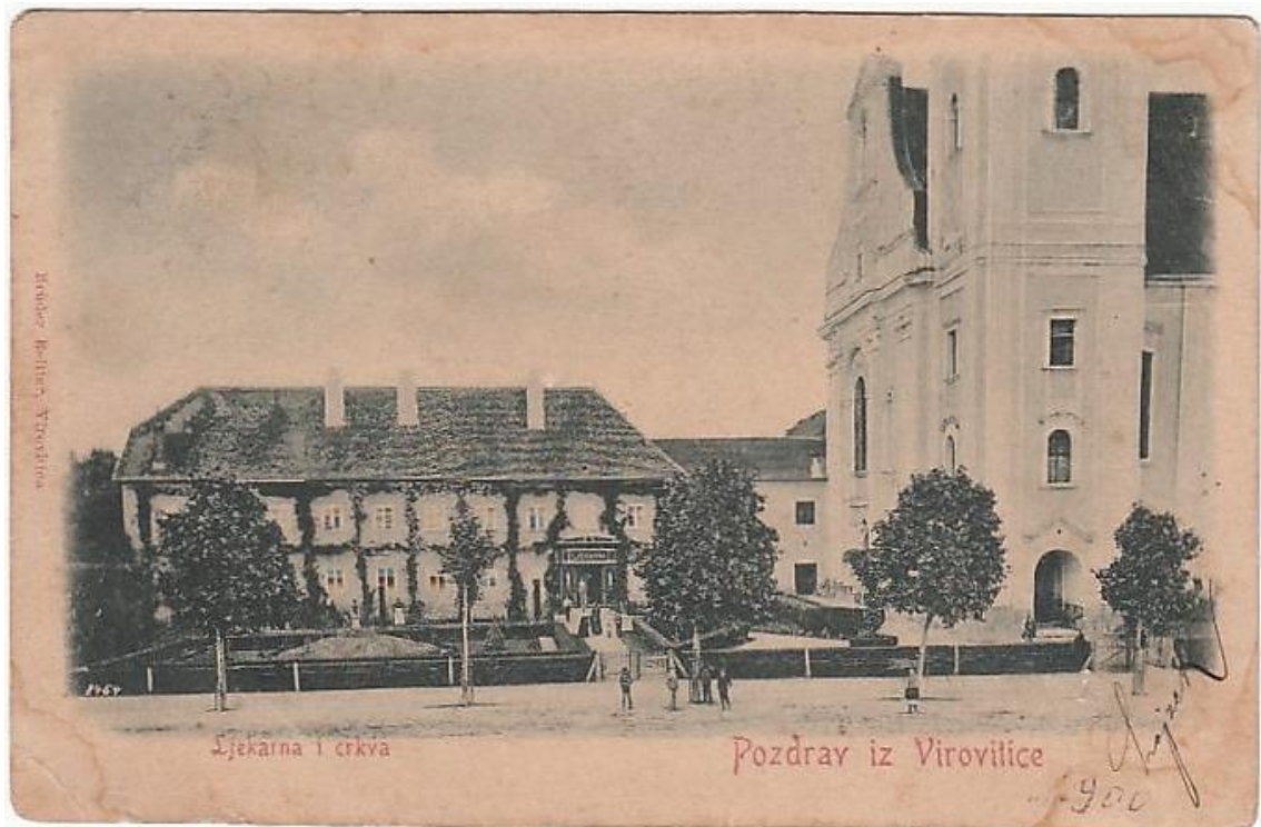
Slika 5. Razglednica iz 1900. god. koja prikazuje sjeverno pročelje franjevačke ljekarne, samostana i dio crkve sv. Roka. Ispred ljekarne je bio lijepo uređeni tzv. „francuski vrt“ s niskim ukrasnim biljem i raslinjem, što nam dodatno potvrđuje status i uvaženost franjevaca među Virovitičanima.