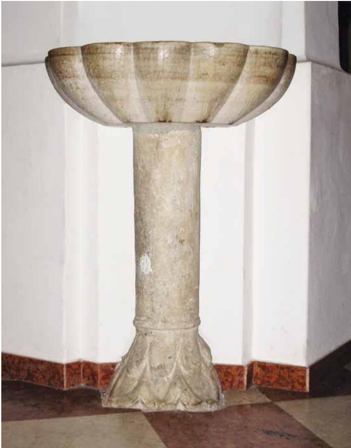
Slika 1. Romanički stup iz XIII. st. u današnjoj crkvi sv. Roka u Virovitici, Foto Silvija Salajić, 2008.