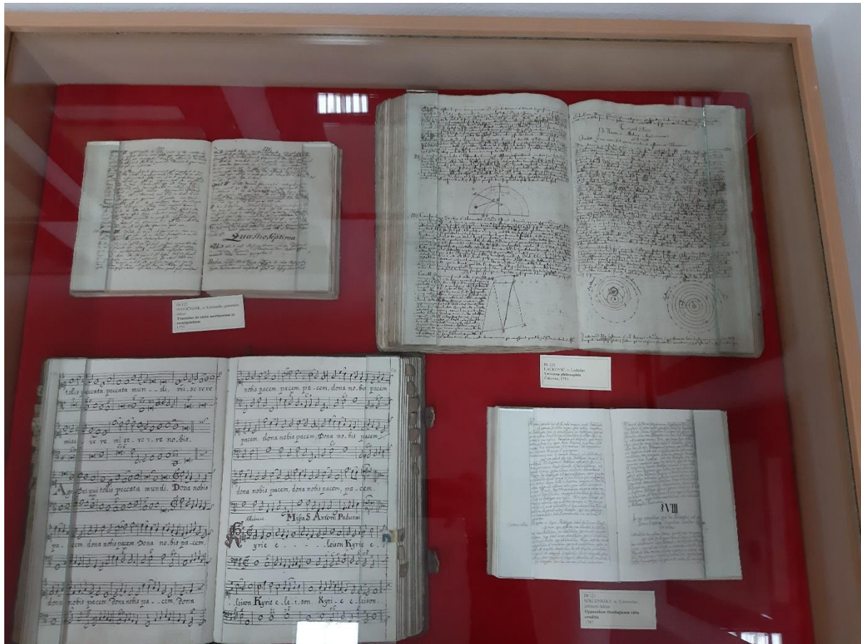
Slika 8. Vrijedna knjižna izdanja izložena u stalnom postavu franjevačkoga muzeja u Virovitici. Gore lijevo je Tractatus de statu mortuorum et resurgentium generalnoga lektora Leonarda Potočnjaka iz 1775. god. Gore desno je Universa philosophia Ladislava Lackovića iz 1781. god. Dolje lijevo je Kantual iz XVIII. st. Dolje desno je Opusculum theologicum viris eruditiss jubilarnoga lektora Vjenceslava Szklenszkyja.