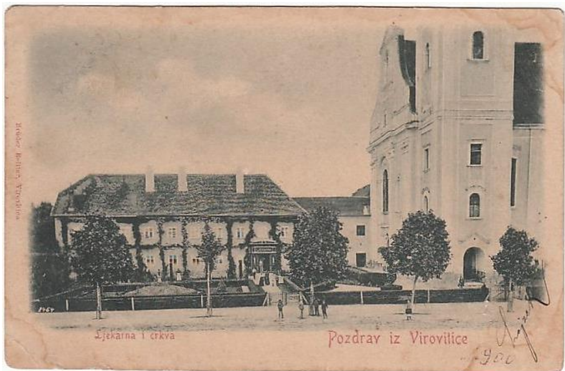
Slika 5. Razglednica iz 1900. god. koja prikazuje sjeverno pročelje franjevačke ljekarne, samostana i dio crkve sv. Roka. Ispred ljekarne je bio lijepo uređeni tzv. „francuski vrt“ s niskim ukrasnim biljem i raslinjem, što nam dodatno potvrđuje status i uvažnost franjevaca među Virovitičanima.