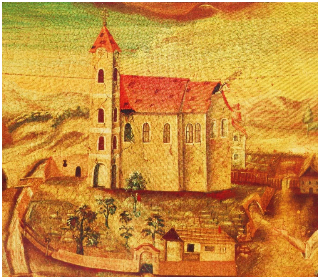
Slika 3. Crkva sv. Roka u Virovitici poslije potresa 1757. god. Slika Franje Čagljevića je dio oltara u zavjetnoj kapelici sv. Emigdija, zaštitnika od potresa. Iza crkve (desno) je vidljiva zgrada franjevačkoga samostana. Čak je i zagrebački biskup Franjo Thauszy pozvao sve vjernike da svojim priložima pomognu franjevcima u Virovitici popraviti samostan i crkvu koji su bili teško oštećeni u potresu (HR-FAVI B-II-1-1-21 ; IB 076)