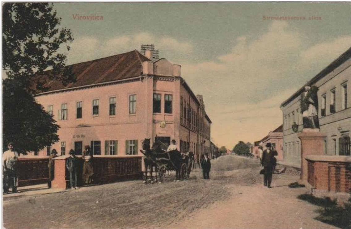
Slika 12. Razglednica s početka XX. st. koja prikazuje zapadni izlaz iz Virovitice i zgradu pučke škole (lijevo). Crkva i samostan su samo stotinu metara iza snimača razglednice.