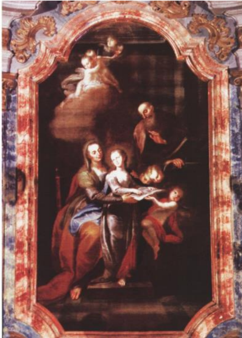
Slika 6. Slika nepoznatoga autora s oltara u crkvi sv. Roka u Virovitici, Sveta Ana podučava Mariju , izrađena je oko 1770. god. kao dar obitelji Pejačević, virovitičkih vlastelina od sredine XVIII. st. Od 3. srpnja 1771. god. Pejačevići su preuzeli patronat nad virovitičkom župom. (HR-FAVI B-II-1-1-35 ; IB 081) Za njihova gospodarenja Viroviticom crkva je obilato interijerski opremljena novim oltarima, kipovima i različitim umjetničkim djelima.