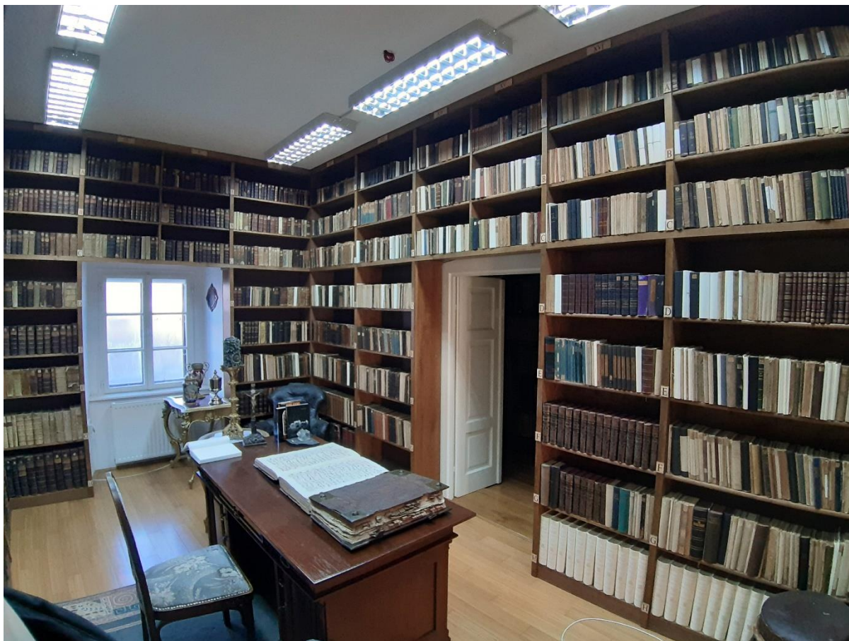
Slika 7. Knjižnica franjevačkoga samostana u Virovitici. Soba starijih izdanja. Foto Vlatko Smiljanić, 2020.

Kako bismo vjerodostojno potkrijepili nastavnu i učiteljsku literaturu franjevačkih visokih škola u Virovitici, potrebno je raščlaniti građu virovitičke samostanske knjižnice. Ona je danas razdvojena u dvije sobe, gdje se u prvoj sobi nalaze najstarije knjige od XVI. do XIX. st., a u drugoj novija izdanja XX. st. i periodičke publikacije. Nama je za ovu temu zanimljiva prva soba koja obiluje starijim izdanjima. 135