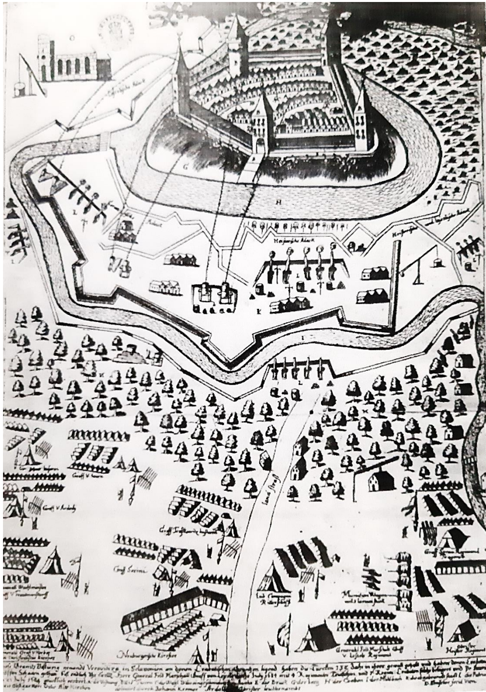
Slika 2. Veduta Virovitice krajem XVII. st., Generallandesarchiv Karlsruhe, inv. br. 8553.