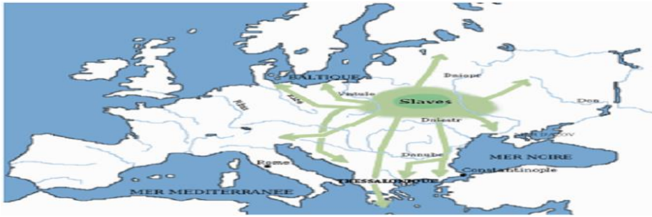
Slika 1. Migracije slavena 2

o podrijetlu Hrvata. U ovom radu pozabavit ćemo se slavenskom teorijom o podrijetlu Hrvata. Slika ispod pokazuje Slavene i njihove rane migracije.