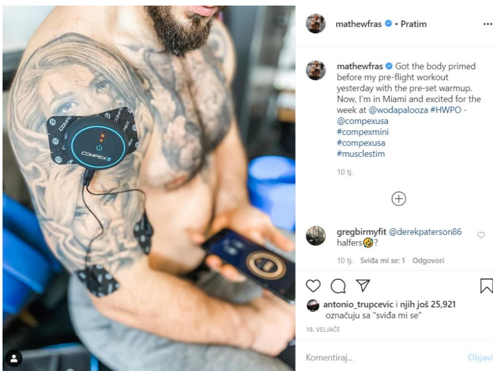
Mathew Fraser promocija za spravu Compex 18. veljače 2020.

prehrambenim suplementima. U lipnju 2020. godine ima 2.1 milijuna pratitelja i 1150 objava na Instagramu. Zanimljivo je što on navodi sve proizvode i tvrtke s kojima surađuje na vrhu profila te se korisnici društvenih mreža mogu direktno prebaciti na stranice tvrtki i proizvoda koje on promovira. Fraser objavljuje sponzorski sadržaj češće od tri prethodno spomenuta sportaša. Često objavljuje o svojim treninzima, planovima prehrane i putovanjima. U sponzorskim sadržajima uglavnom prikazuje kako koristi određeni proizvod, bilo da se pomagala za oporavak od treninga ili prehrambenom suplementu. Objave su popraćene pozivom na radnju i oznakom proizvoda ili tvrtke. On i Tia-Clair Toomey imaju sponzorski dogovor s istom tvrtkom, Chipotle. U nastavku ćemo moći primijetiti sličnosti i razlike u objavama, tekstu i slici kad se radi o sportašu ili sportašici i promoviranja proizvoda.