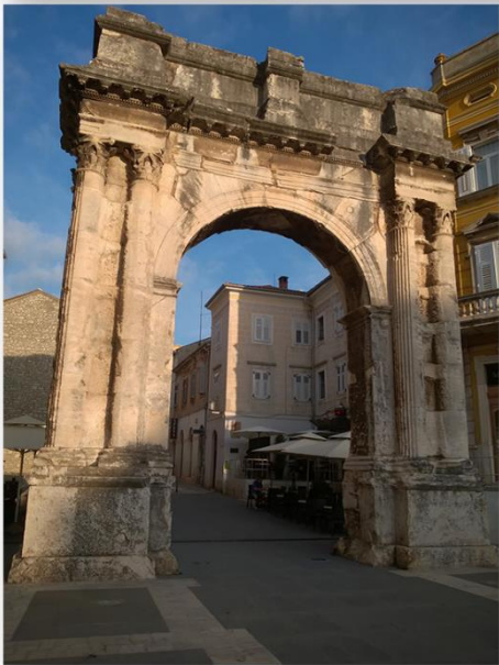
Slika 6. Prikaz: Slavluk Sergijevaca, Pula.