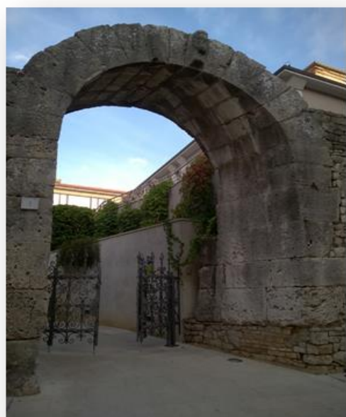
Slika 2. Prikaz Herkulovih vrata