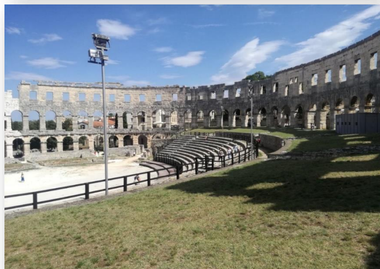
Slika 12. Prikaz Amfiteatra, unutrašnjost