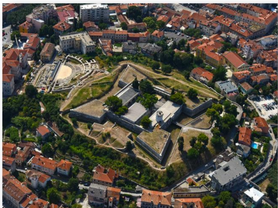
Slika 1. Prikaz današnje Tvrđave iz mletačkog perioda, sagrađenoj na prapovijesnoj gradini