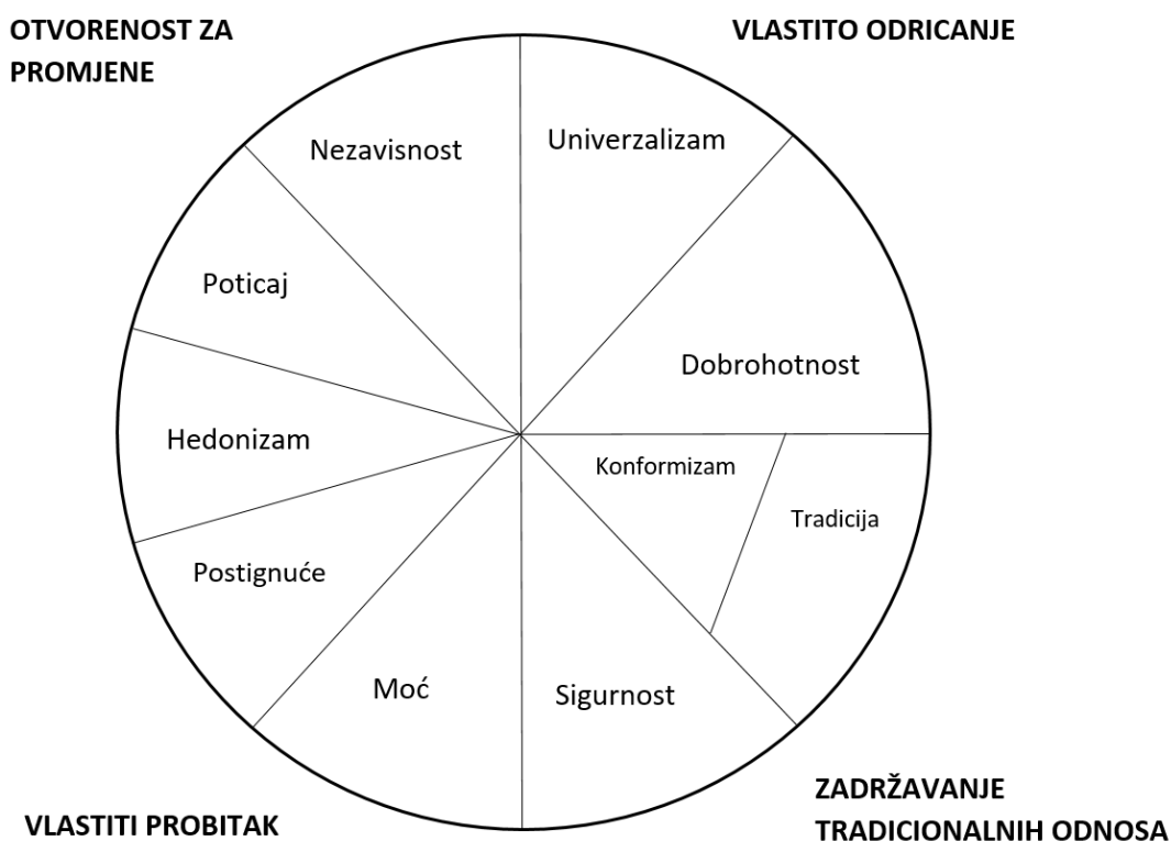
Slika 1. Prikaz kružne strukture i dinamičkih odnosa deset tipova općih vrijednosti

zadovoljavanje potreba i uživanje, dok se konformizam i tradicija nalaze na suprotnim krajevima od poticaja i hedonizma, zadovoljavajući isti motivacijski cilj podređivanja individualnih potreba u korist društveno nametnutih očekivanja. Iz tog razloga, konformizam i tradicija se nalaze unutar jedne regije iako se promatraju kao zasebne vrste vrijednosti (Schwartz, 1992; Schwartz, 1994).