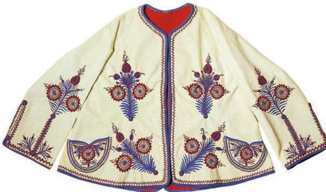
Slika 3. Ženska surka