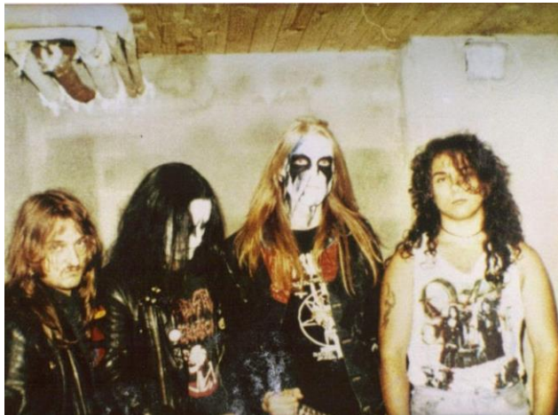
Slika 6 Izgled pripadnika black metal podžanra