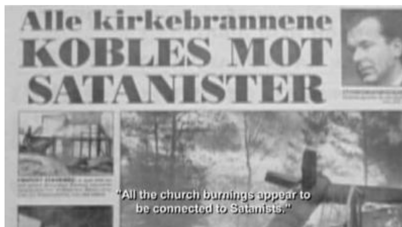
Slika 5 Prikaz moralne panike u norveškim novinama

Najbolji primjer diskriminacije metalaca, s obzirom na predrasude o fizičkom izgledu, je primjer policije koja je zaustavljala mladiće duge kose na norveškim ulicama 1990-ih godina te ih pretraživala za oružje i ispitivala o tome jesu li dio sotonističkog kulta, jesu li nekoga žrtvovali i jesu li sudjelovali u paljenju crkava, iz dokumentarnog filma Until the light takes us (2008). Također, poznat je i primjer uhićivanja mladića duge kose u Iranu, vršenje fizičkog nasilja nad njima te brijanje glava na ćelavo (Dunn i McFadyen, 2008).