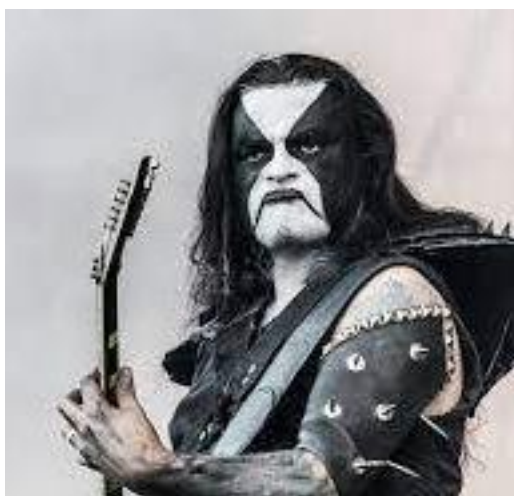
Slika 4 Prikaz corpse paint načina šminkanja

kosa, traper jakne s prišivcima i bedževima bendova, nošenje oružja, korištenje simbolima poput obrnutih križeva i pentagrama, uznemiravajuća umjetnost na naslovnicama albuma, crne kožne jakne, bodlje i šiljci na odjeći i obući, remeni napravljeni od metaka, majice s imenima i albumima bendova, brutalno i agresivno ponašanje na pozornici i koncertima te, u ekstremnim slučajevima, primjerice black metalu , tzv. corpse paint (Slika 4), odnosno oslikavanje lica bijelom i crnom bojom kako bi se postigao dojam izgleda mrtvacu. Također, svaki od heavy metal pravaca ima svoj autentični stil odijevanja i sleng (Aasdal i Ledang, 2007; Beste i sur., 2007).