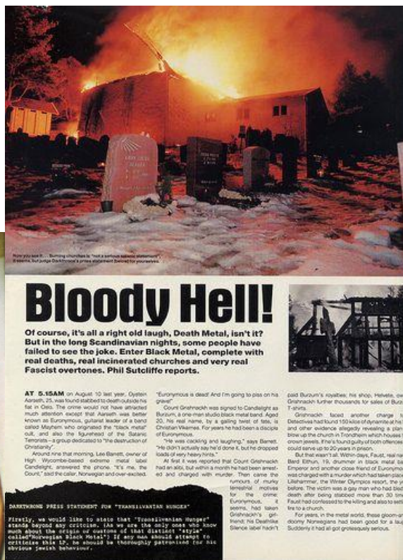
Slika 7 Prikaz izvješća o paljenju crkvi u britanskim novinama

Prouzrokovali su brojne kontroverzije u intervjuima ranih devedesetih godina, u kojima su, iz zabave, zauzimali antikršćanske i mizantropske stavove predstavljajući sami sebe kao sotoniste kako bi provocirali i šokirali javnost (Grude, 1998). Takvo što postižu svojim načinom odijevanja, načinom sviranja, vokalima, nastupima, tekstovima pjesama, korištenjem nečistih tonova te načinom predstavljanja sebe u javnosti, odnosno načinom ponašanja u društvu. Čak je i njihova glazba bila negacija i pobuna protiv kvalitetne produkcije i tradicionalne glazbene strukture, što su postizali korištenjem nečistim tonovima (Grude, 1998).