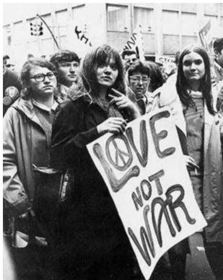
Slika 1 Hippie pokret šezdesetih

Pojam kontrakulture proizašao je iz burnog razdoblja šezdesetih godina 20. stoljeća. Naime, šezdesete su obilježili studentski pokreti, protesti protiv Vijetnamskog rata te poziv na revoluciju i promjenu političke i kulturne stvarnosti iz korijena. Tada je nastupilo okupljanje pobunjenih u hipijevsko-boemske kontrakulturne pokrete. Hippie pokret, prikazan na Slici 1, uvijek se veže uz rock glazbu, uporabu droga te prakticiranje istočnjačke duhovne i religijske prakse. U kontrakulturi element sukoba je središnji te su mnoge vrijednosti specifično proturječne vrijednostima dominantne kulture. Ukratko, kontrakultura je skup ljudi, odnosno društveni pokret koji se radikalno suprotstavlja dominantnoj kulturi, vladajućem poretku i sustavu vrijednosti (Perasović, 2001, Perasović, 2002; Krnić i Perasović, 2013; Yinger, 1960).