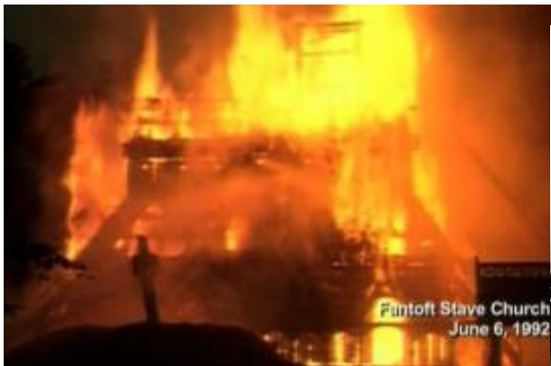
Slika 8 Black metal paljenje norveških crkvi

Moralna panika je postala još ozbiljnijom nakon kriminala koje su počinili te su zaživjeli svoju etiketu. Neki od najgorih kriminala koje su pripadnici black metal pravca počinili, obrađeni u dokumentarnom filmu Satan rides the media (1998) uključuju govor mržnje u obliku antisemitizma, antiislamizma i zagovaranja nacističke ideologije i vladavine jedne rase, gdje je glazbenik jednočlanog benda Burzum, Varg Vikernes frontmanu židovskog heavy metal benda Salem poštom poslao bombu (Dunn i McFadyen, 2008). Paljenje crkvi u Norveškoj, prikazano Slikam 8 i 9, 1990-ih godina kao simbolički čin osvete, u vidu sotonizma, za pokrštanje poganskih skandinavskih naroda u razdoblju srednjeg vijeka, koje krive za gubitak izvornog poganskog kulturnog identiteta, obreda, običaja i vjere u skandinavske bogove.