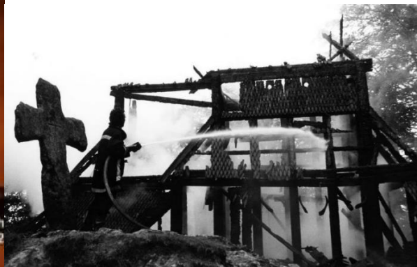
Slika 9 Ostaci crkve u Norveškoj nakon „sotonističkog“ spaljivanja

Kako jedan od najpoznatijih glazbenika ovog pravca, Varg Vikernes, navodi, kršćani su srazvali hramove posvećene poganskim bogovima poput Odina, Thora, Freye i ostalih, sa zemljom, te su na ruševinama hramova izgradili crkve (Aites i Ewell, 2008). Također, aktualan je bio i slučaj potaknut homofobijom, gdje je Faust, član benda Emperor s 37 uboda nožem usmrtio muškarca zato što je posumnjao da je homoseksualac. Varg Vikernes počinio je ubojstvo kolege Euronymousa, „u samoobrani“, usmrtio ga je ubodom nožem u lubanju te je bio osuđen na kaznu zatvora od 21 godine.