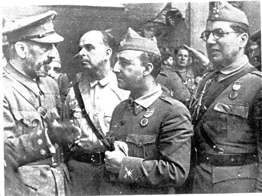
General Franco nakon osvajanja Toleda; s njim su Moscardó, Varela i Franco Delgado

milijun zarađivalo dnevnicu manju od jednog španjolskog pezeta. 5 Trebalo je pronaći način kako osigurati ravnomjernu preraspodjelu zemlje i kako poboljšati životni standard španjolskog seljaka. Tako se pokušalo postići određeni pomak dizanjem minimalne cijene nadnice, što je samo dodatno otežalo situaciju za srednje i male zemljoposjednike, koji su za obradu zemlje koristili nadničare. Budući da država nedosljedno i polovično provodi reforme, seljaci su potpomognuti anarhističkim sindikatima (Seidman, 2011: 16) preuzeli stvar u svoje ruke i bojkotirali upotrebu strojeva, oduzimali zemlju veleposjednicima te pokretali brojne štrajkove. Republikanska vlada našla se u škripcu: s jedne strane raslo je nezadovoljstvo socijalista i anarhista koji su u vladinoj blagoj politici prema reakcionarnim slojevima društva vidjeli pokušaje ponovne uspostave Monarhije, a s druge strane, blagim pristupom u provođenju reformi vlada je podilazila tim istim reakcionarnim krugovima koji su vrebali priliku za ponovni dolazak na vlast. Pod ovakvim okolnostima, pojavilo se plodno tlo za učvršćivanje političkih saveza na ljevici i desnici.