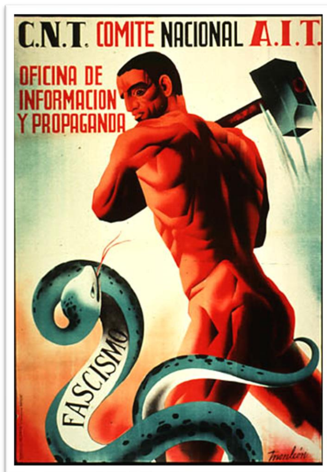
Slika 4. Primjer republikanske propagande.