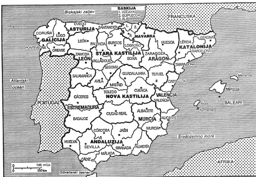
Španjolske pokrajine i provincije

Slika 1. Španjolske pokrajine i provincije.