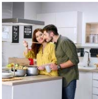
Slika 1. Reklama za Emmezetu Slika 2. Reklama za Emmezetu