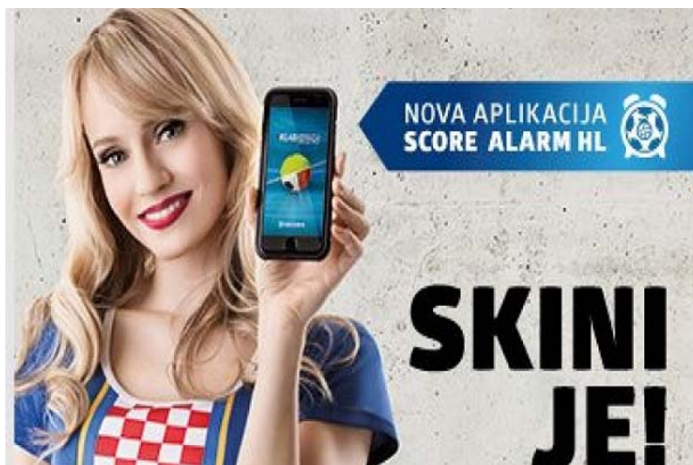
Slika 4. Reklama za Hrvatsku lutriju

Reklamu ovoga tipa iskoristila je Hrvatska lutrija u promociji svoje nove aplikacije: