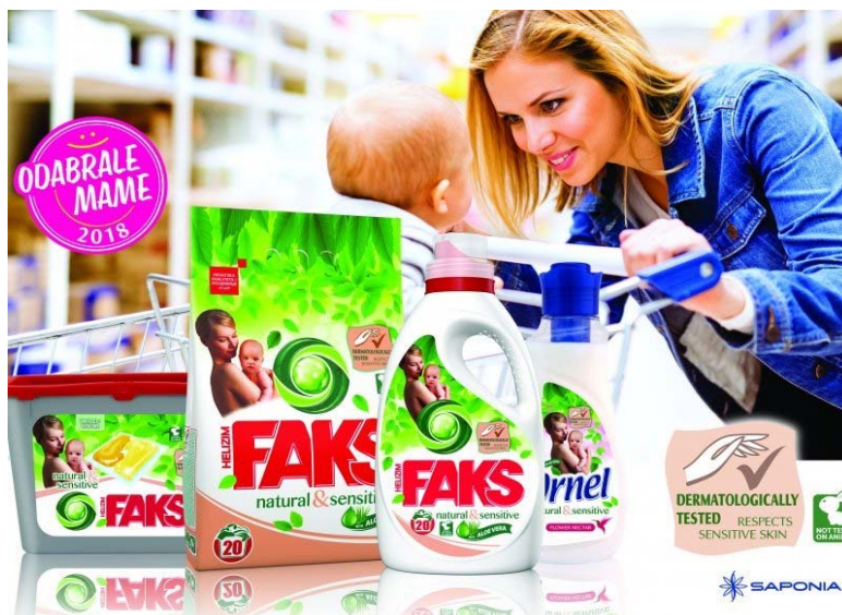
Slika 2. Reklama za Faks

Za ovaj tip reklame primjer je reklama za Faks natural i njihovu novu liniju proizvoda: