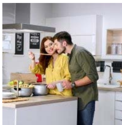
Slika 1. Reklama za Emmezetu (Izvor: snimka zaslona/osobna arhiva) Slika 2. Reklama za Emmezetu (Izvor: snimka zaslona/osobna arhiva)