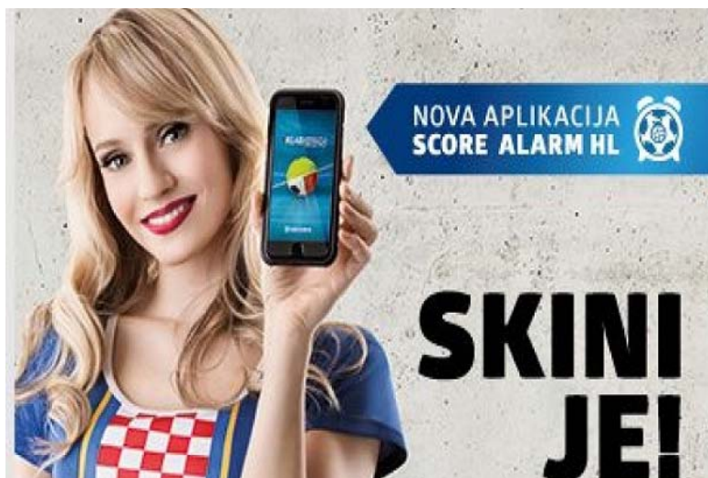
Slika 4. Reklama za Hrvatsku lutriju

Reklamu ovoga tipa iskoristila je Hrvatska lutrija u promociji svoje nove aplikacije: