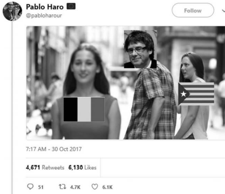
Slika 5. Reproducirani Distracted boyfriend mem (Wiggins, 2019: 67)