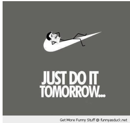
Slika 3. Nike mem (funnyasduck.net, preuzeto 22.6.2021)