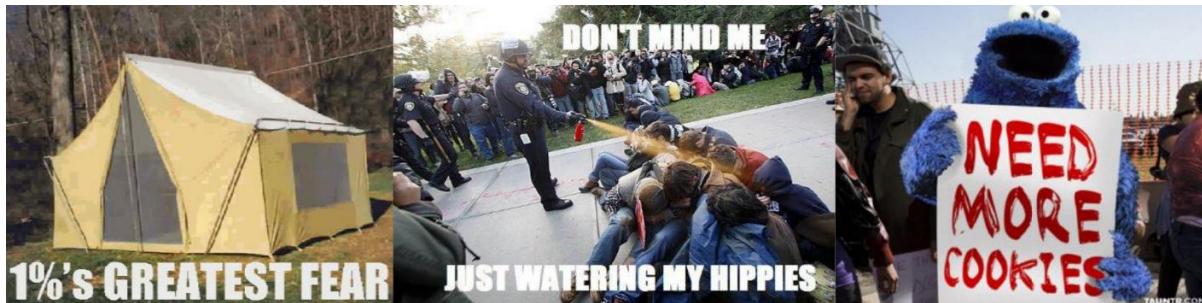
Slika 4. Memi nastali tijekom OWS protesta (Milner, 2013: 2360)

su memi sa stvarnom fotografijom protesta i uklopljenom makronaredbom slike ( image macro ) i fotošopiranim fotografijama (Slika 4.) (Milner, 2013: 2359)