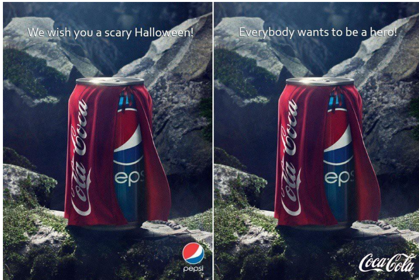
Slika 2. Prikaz Pepsi (lijevo) i Coca-Cola (desno) mem reklame

Coca-Cola i Pepsi. Obje organizacije koriste istu sliku kao podlogu, ali tekst daje značenje. Slika 2 prikazuje Pepsi oglas s tekстом „We wish you a scary Halloween“ (Želimo vam strašnu noć vještica“) želeći prikazati Coca-Colu kao strašnu masku za noć vještica. Međutim, Coca-Cola mijenja tekst s mema u novi: „Everybody wants to be a hero“ („Svi žele biti heroj“); time su htjeli reći da Pepsi pokušava postati Coca-Cola (heroj).