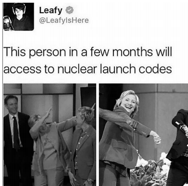
Slika 5. Mem o Hillary Clinton (prijevod: „ova osoba će za par mjeseci imati pristup kodovima za nuklearna lanisiranja“) (Denisova, 2019: 188)

emisijama te svojim ponašanjem na istim; naime, koristila je internetski slang (izraz) i geste („dab“ pokret rukama) (Slika 5.) (Denisova, 2019: 187).