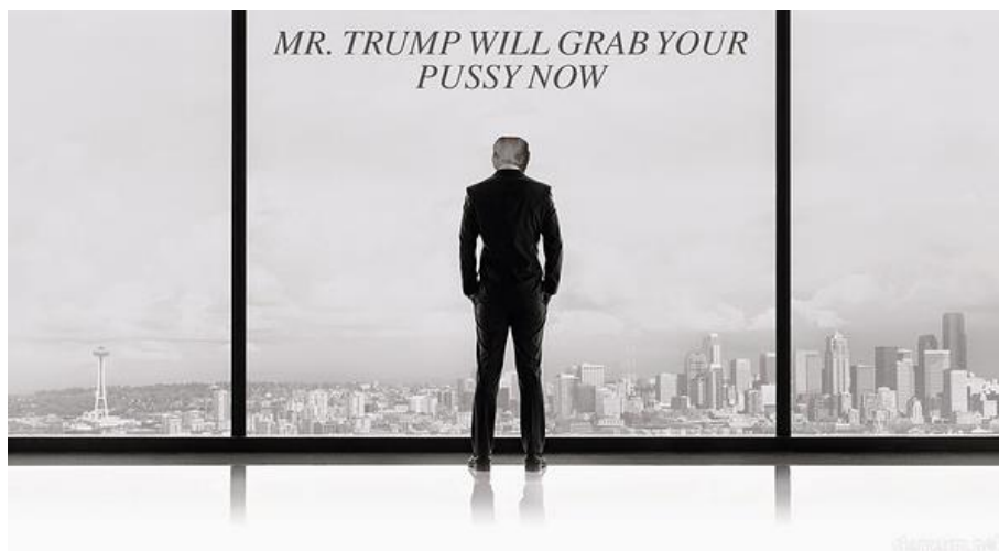
Slika 7. Mem o Donald Trumpu