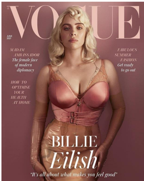
Slika 1. Billie Eilish

Billie Eilish globalno je poznata pjevačica i kantautorica. Na početku karijere Billie Eilish nosila je široku odjeću jer nije željela pokazivati svoje tijelo. Na najnovijoj naslovnici za Vogue odlučila je pokazati svoje obline i obući se „provokativnije“ nego inače. Ovaj potez privukao je puno pažnje te pozitivnih i negativnih komentara. Jedan dio ljudi u komentarima ispod objava na društvenim mrežama komentirao je da je pokazala svoje tijelo radi medijske pažnje, dok drugi dio ljudi smatra da ju ne treba osuđivati i da je to napravila jer je sada dovoljno zrela. Billie Eilish je u prijašnjim intervjuima tvrdila da se radi tjelesno dismornog poremećaja ne osjeća ugodno u svome tijelu te da ga ne želi izlagati javnosti. U intervjuu je odgovorila na komentare o naslovnici za Vogue : „Ovom naslovnicom poručuje da svoje tijelo danas voli, da se osjeća samopouzđano, ali i da se nikog ne bi trebalo osuđivati zbog toga koliko kože odluči ili ne odluči pokazati“ ( super1 , 2021). Također, komentirala je da se javnost najviše zanima za neuobičajen potez neke osobe te se toliko fokusiraju na to da ga učine još gorim.