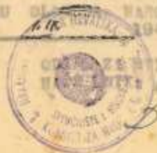
Prilog 3 – Odgovor na molbu za stipendijom

MIROVAČKI OBLASTI Zagreb, dne 11. 11. 1948.