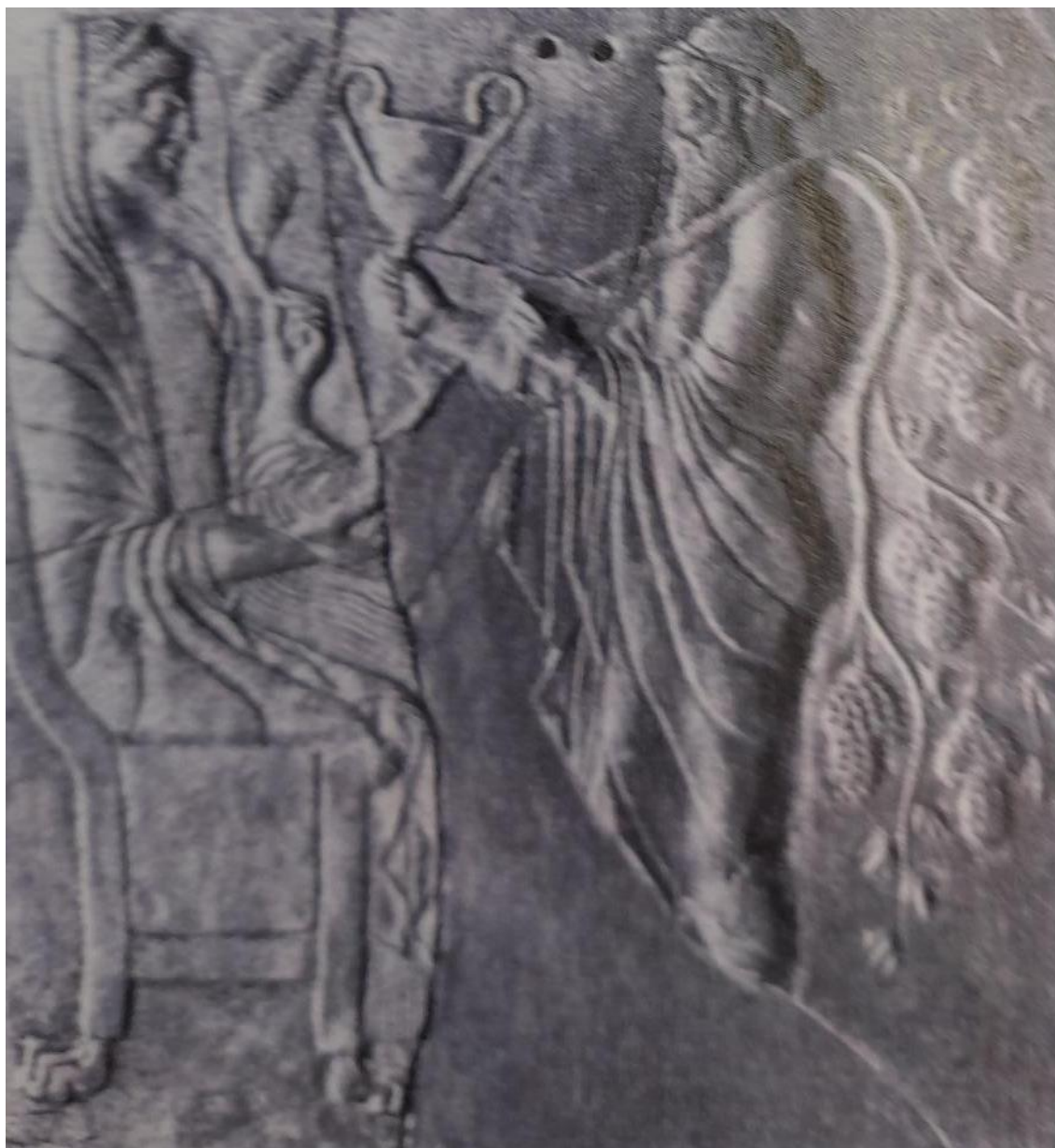
Slika 3 8

Samele, a drugi put iz Zeusova rebra). Njegova prisutnost se najviše izražavala u vinu, ekstazi, umjetnosti i zagrobnom životu.