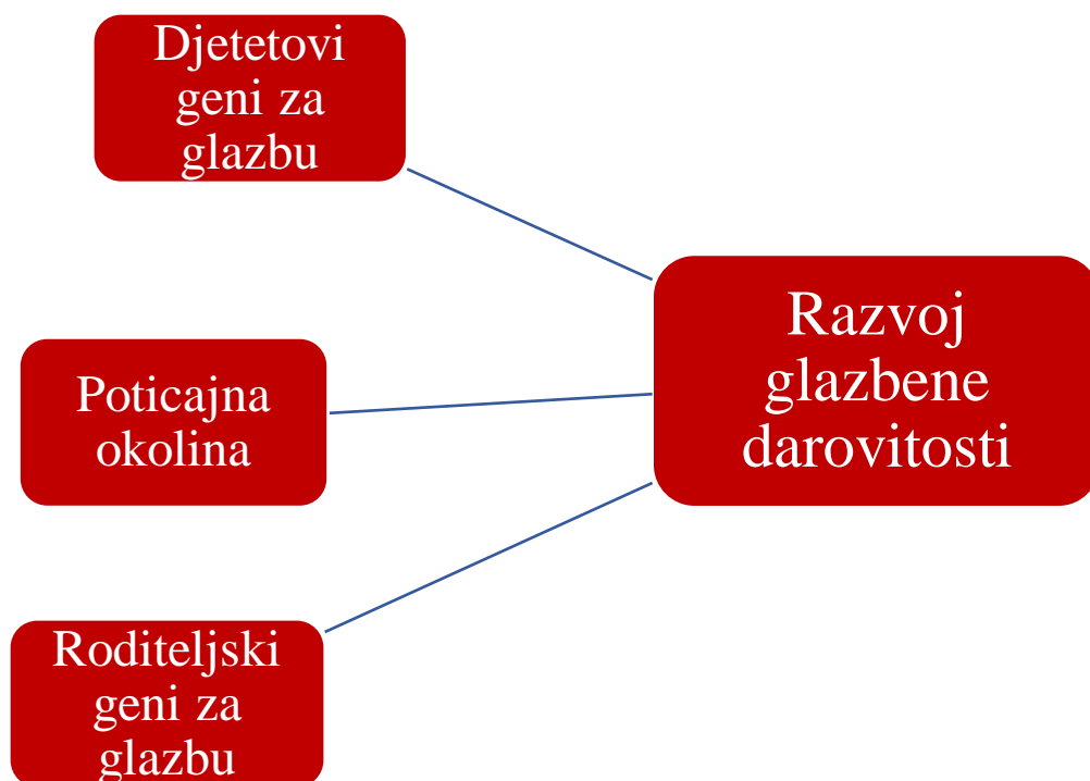
Slika 2. Pasivna povezanost nasljeđa i okoline. (Čudina Obradović i Obradović, 2006., str. 239)