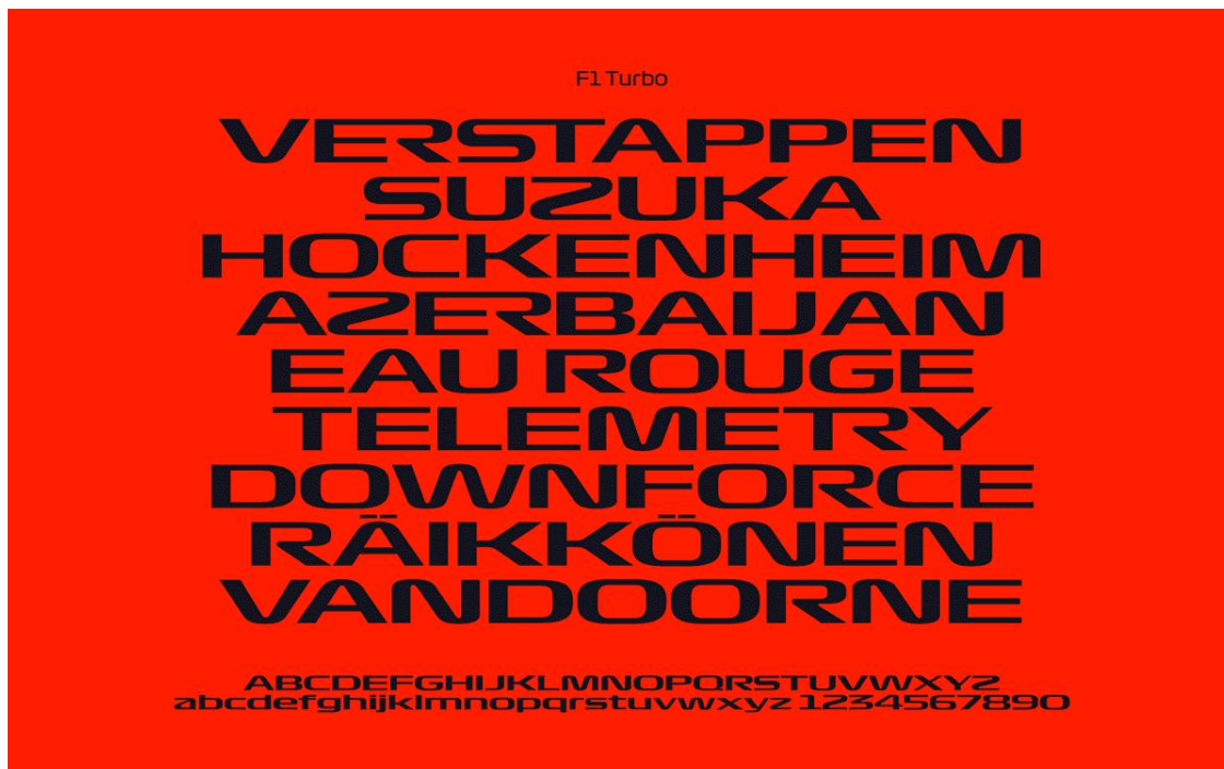
Slika 2. Tipografija Formule 1

ново sportsko okruženje, čime se posebna pozornost posvećuje digitalizaciji i tehnologiji koja će učiniti sport revolucionarnim (Thinkmarketingmagazine, 2022). Jednostavnije rečeno, novi dizajn predstavlja buduću generaciju auto-moto sporta te nastoji ukomponirati elemente za koje se brend zalaže, a to uključuje inovaciju, tehnologiju, dinamičnost i brzinu. S istim elementima u fokusu, kreirana je i posebna tipografija (Slika 2).