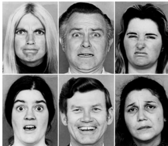
Slika 2 Šest osnovnih emocija

Neverbalna komunikacija muškaraca i žena razlikuje se u većini navedenih znakova, od samog tumačenja do korištenja. No, ono što je zajedničko svim ljudima na zemlji je izražavanje šest osnovnih emocija (Slika 2), a to su: sreća, tuga, strah, ljutnja, gađenje i iznenađenje.