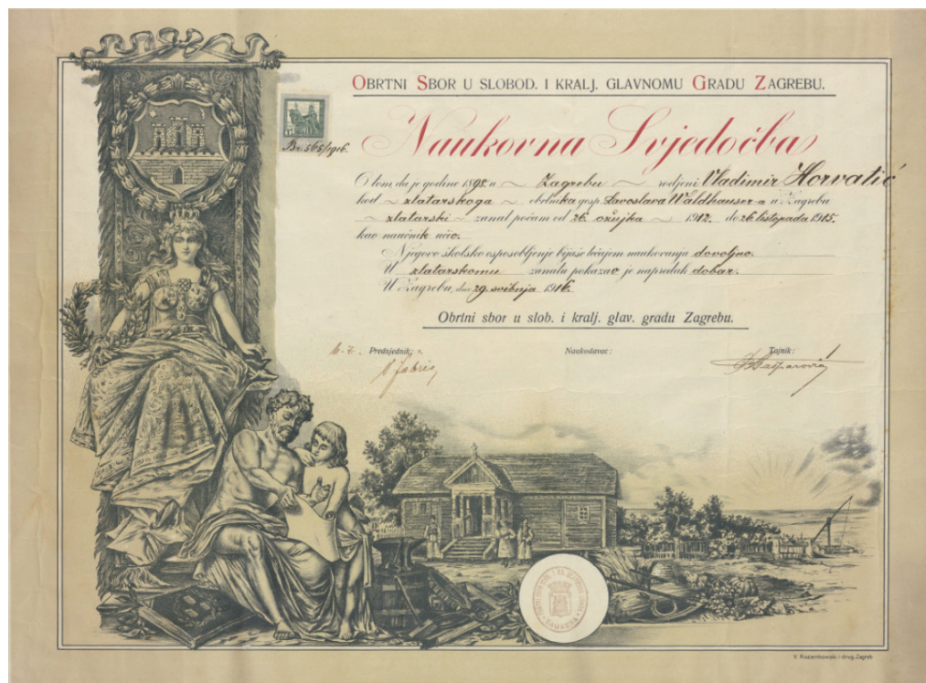
Slika 17: Naukovna svjedodžba, 1916.

lavnom individualno, ali 1902. počinju se javljati masovni istupi koji izražavaju ksenofobiju, odnosno traže izvan poljoprivrede krivca za višak agrarnog stanovništva. U srpnju 1903., dakle u vrijeme kada ban Teodor Pejačević dolazi na bansku stolicu, proradio Odbor za namještanje djece u obrt i trgovinu pod okriljem Obrtnog zbora, koji posluje u Zagrebu u Ilici 37 i koji je već smjestio 30 djece u nauk. 8