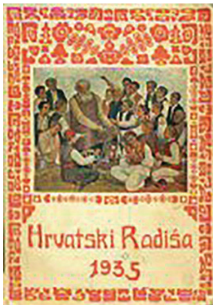
Slika 18: Naslovnica Kalendara Hrvatskoga Radiše iz 1935. god.

Od 1. studenoga 1935. godine u Stanici je angažiran i dr. Zoran Bujas, 25 što bi označilo i početak intenzivnijeg rada Stanice. S obzirom na navedenu temu, kao i nastojanje prikaza suodnosa Stanice i Hrvatskog Radiše, za arhivsku obradu uzeta je 1935. godina. Naime, to je prva godina iz koje imamo arhivsku građu koja definira rad Stanice, iako je većinom škartirana i svodi se na Urudžbeni zapisnik koji se danas čuva pod oznakom HR-DAZG-239 Zavod za psihologiju i fiziologiju rada, knj. I-204. Urudžbeni zapisnik otkriva nam broj korisnika pregledanih u Stanici 1935. godine, ali i neka općenita postupanja vezana uz samo