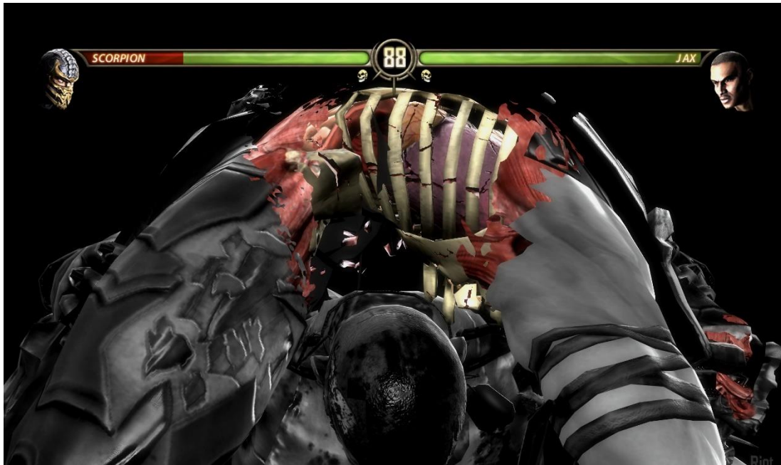
Slika 6. Scena nasilja, Mortal Kombat