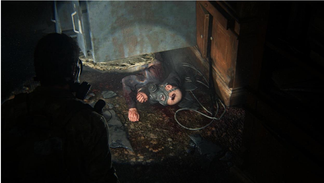
Slika 4. Eutanazija, Last of Us