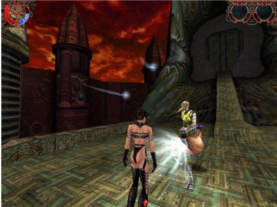
Slika 5. Julie Strain, Heavy Metal: F.A.K.K. 2

dobi... Tako je spomenuta Lara Croft u zadnjim nastavcima Tomb Raidera prikazana s odjećom koja joj pokriva cijelo tijelo. Također, neki od glavnih ili važnih sporednih ženskih likova u novijim videoigrama prikazani su kao transrodne osobe ili osobe homoseksualne orijentacije, poput Ellie Williams u Last of Us ili Judy Alvarez u Cyberpunk 2077 .