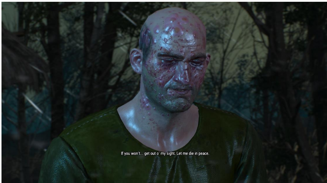
Slika 3. Eutanazija, Witcher 3: Wild Hunt

usmrtili lika koji pati, ne krši li igrač tada još jedno deontološko načelo – poštivanje dostojanstva osobe? Preferencije programera videoigara pri konstruiranju narativa pokazuju kako je eutanazija u videoigri moralno opravdana onda kada igrač u potpunosti zna cjelokupnu istinu o situaciji u kojoj se lik nalazi, te onda kada zna da ga čeka ili neizbježna sudbina ili da je u nepodnošljivoj boli koja ne prestaje (prema: Perušić, 2022: 85-86). Zaključno se za pojavu eutanazije u videoigrama može reći kako bi ona pozitivno mogla utjecati na mlađe igrače koji će jednog dana možda postati primjerice etičari, suci, doktori, političari, novinari, svećenici i tako dalje. Iako simulirano iskustvo, susret s eutanazijom u videoigrama omogućuje igračima iskustvo odlučivanja umjesto drugoga i donošenja nekog teškog izbora (prema: Perušić, 2022: 89).