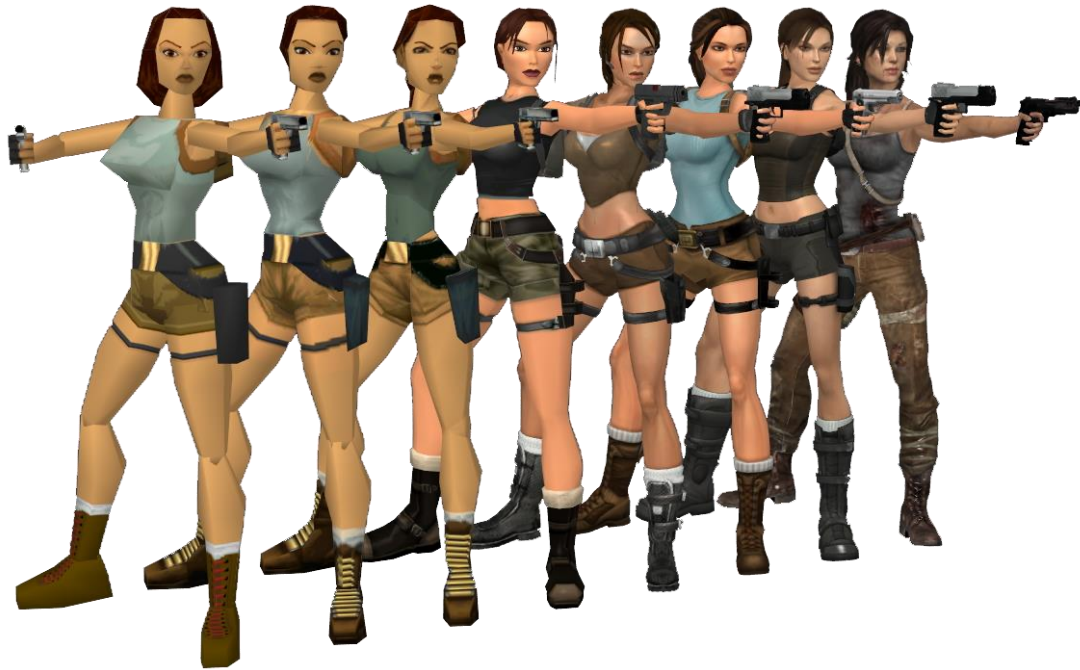
Slika 6. Evolucija Lare Croft, Tomb Raider