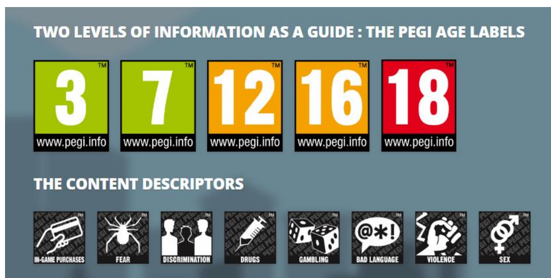
Slika 9. PEGI oznake i oznake s opisima sadržaja videoigara

Uz PEGI oznake postoje i takozvani deskriptori sadržaja , a radi se o opisima samog sadržaja pojedine videoigre. Navedene oznake također pomažu roditeljima pri zaštiti djece od neželjenog sadržaja prikazanog u videoigramama, a i igračima predstavljaju neku vrstu upozorenja o tome kakav sadržaj u videoigri mogu očekivati. Postoji osam kategorija takvih opisa, to jest osam deskriptora sadržaja : „kupnja unutar igre“, „strah“, „diskriminacija“, „droge“, „kockanje“, „uvredljive riječi“, „nasilje“, te „seks“.