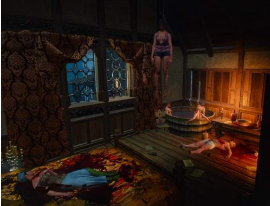
Slika 5. Scena nasilja, Witcher 3: Wild Hunt

logika mogla bi se primijeniti i na videoigre, samo što svijet videoigre ne napuštaju neka opipljiva sredstva, već moralne vrijednosti. Utječe li pojava nasilja na internalizaciju nemoralnih vrijednosti – to se ne može u potpunosti dokazati pošto na to utječu mnogi drugi čimbenici, a nekonzistentnost u istraživanjima isto i pokazuje.