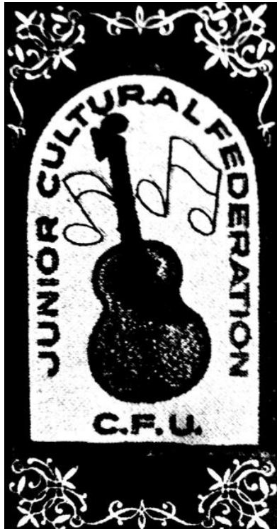
Slika 5. Emblem „Pomladka“ Hrvatske bratske zajednice

njezinom većem značaju i području djelovanja. Da nije bilo Pomlatka, Hrvatska bratska zajednica teže bi prebrodila veliku ekonomsku krizu koja se dogodila između dva svjetska rata. 45