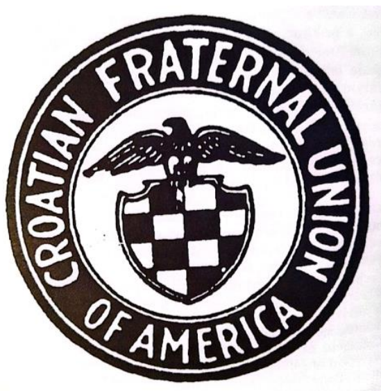
Slika 3. Emblem Hrvatske bratske zajednice (preuzeto iz: Smoljan, I., „Hrvatska dijaspora“, Horizont press, Zagreb 1997., str. 44)

Osnivači HBZ-a bili su šarolika skupina hrvatskih useljenika, predstavnika različitih regija i sredina unutar Hrvatske. Među njima su bili stručnjaci, poput liječnika i odvjetnika, kao i fizički radnici, a dijelili su zajedničku želju za osnivanjem organizacije koja bi služila potrebama hrvatskih useljenika u Americi. Prve godine HBZ-a bile su obilježene osjećajem optimizma i entuzijazma među njezinim članovima, koji su u organizaciji vidjeli sredstvo izgradnje snažne i živahne hrvatsko-američke zajednice.