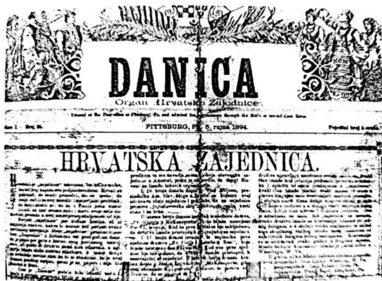
Slika 2. Danica, hrvatski list

najpoznatijih prvih tiskovna koji je 1898 počeo objavljivati Franjo Zotti. Te su novine izvrstan primjer kako oglašavati parobrodske agencije i bankare. Kako je većina hrvatskih iseljenika pripadala radničkom sloju, mnoge su se hrvatske tiskovine zvale radničkim glasilima. 25