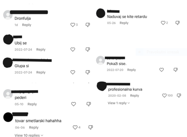
Slika 2. Primjer govora mržnje na TikToku