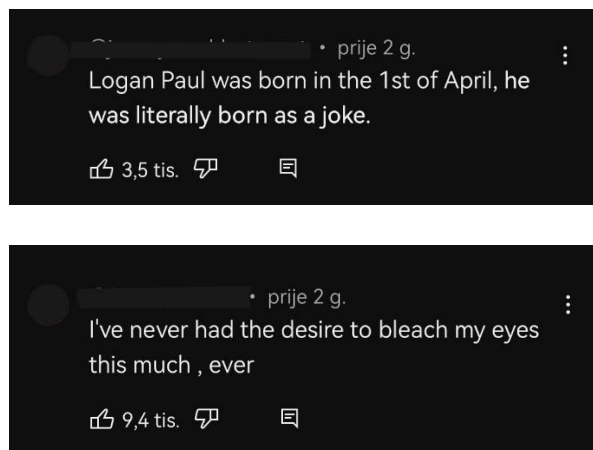
Slika 4. Primjer govora mržnje na YouTubeu

„YouTube je društvena mreža koja služi za dijeljenje, pregledavanje i komentiranje videozapisa“ (Štavalj, 2014: 13) Govor mržnje je lako ostvariv na ovoj društvenoj mreži. Na primjer, dovoljno je objaviti videozapis u kojemu je osoba vrijeđana, maltretirana i sl. te u nazivu videozapisa upotrijebiti pogrdne izraze. Nakon toga slijede komentari koji u većini slučajeva potiču nastavak nasilja, omogućavaju iznošenje mišljenja u smislu odobravanja govora mržnje te daju „zeleno svjetlo“ počinitelju nasilja. Problem govora mržnje na YouTubeu je taj što žrtva koja je oštećena govorom mržnje ponovno proživljava nasilje u slučaju ako gleda videozapis i čita komentare. (Sticca i Perren prema Štavalj, 2014: 13)