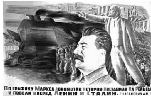
Slika 11. i Slika 12. stvaranje Staljinovog kulta ličnosti

Osim stvaranja kult ličnosti, propaganda je veličala radničku klasu u skladu s marksizmom. Nakon njemačke invazije u prvi plan dolazi ratna propaganda. Cenzura je tada igrala veliku ulogu u propagandi. Mnoge su se stvari zataškavale kako ne bi došlo do pada morala među pripadnicima Crvene armije.