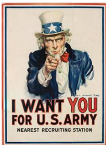
Slika 5. James Montgomery Flagg "I Want You for U.S. Army" 1917.

Još jedan od značajnijih primjera je plakat „Odbijte Nijemce kupnjom ratnih obveznica“ (Beat back the Hun with liberty bonds). On spaja čak dvije važne karakteristike ratnih plakata toga doba – dehumanizaciju neprijatelja i financiranje rata. Ovaj američki plakat prikazuje monstruožnu, prijeteću figuru koja predstavlja njemačkog neprijatelja ( Hun ), odnosno prijetnju demokraciji i slobodi. Stvarajući strah, potiče ljude da kupuju ratne obveznice te tako financijski pripomognu vojnim naporima svoje države. Apelira na patriotizam i želju za zaštitom američkih ideala.