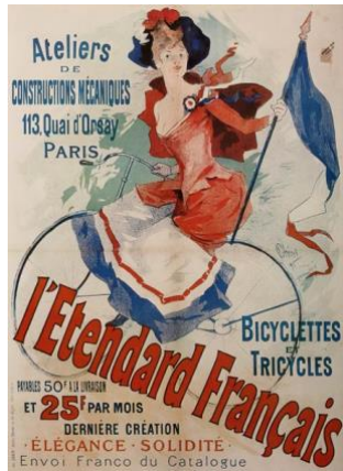
Slika 1. Jules Cheret - L'Etendard Français, plakat za trgovinu biciklima 1891