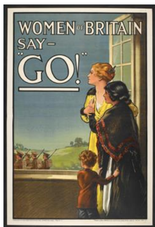
Slika 3. Savile Lumley "Women of Britain Say 'Go!'" 1915.