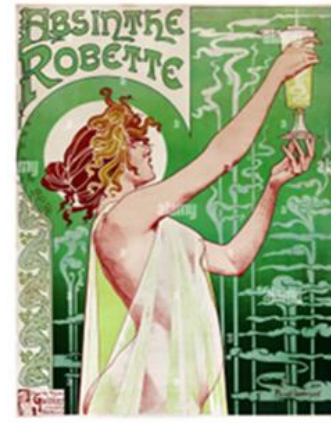
Slika 2. Henri Privat-Livemont plakat za jako alkoholno piće Absinth 1898

Plakati ovog razdoblja karakteristični su po ilustrativnom stilu u kojem su dizajnirani i velikim marginama. Bili su ručno crtani i bojani, a najčešće su ih krasili ženski likovi.