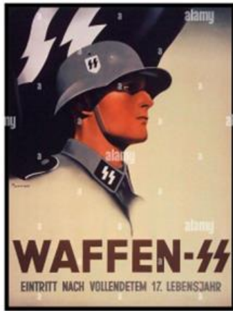
Slika 9. Die Waffen-SS ruft Dich! (Oružane snage SS-a te zovu!)

masovna ubojstva (Shirer, 1977: 144-148). Ovim plakatom su poticali mržnju prema Židovskom narodu kod svojih sljedbenika, a efekt je bio baš onakav kakav su željeli.