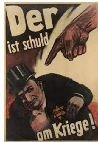
Slika 10 "On je kriv za rat!" – bogataš s Davidovom zvijezdom

Nasuprot Njemačkoj, izuzetni primjeri ratnih plakata se mogu vidjeti u komunističkom SSSR-u. Sovjetska propaganda je bila implementirana s vrha prema dolje, kao i u svakoj drugoj totalitarnoj državi (Nevezhin, 1997: 49). Nije bila tako planski razrađena kao Njemačka, ali ih spajaju dvije stvari - stvaranje kulta ličnosti i demonizacija neprijatelja. U njihovim plakatima je, također, prevladavala crvena boja jer osim što stvara osjećaj važnosti i ljutnje, ona je boja koja karakterizira ideologiju komunizma. Kao što se u Njemačkoj na zastavi i plakatima mogla vidjeti svastika, tako se kod komunista pojavljivao srp i čekić. To je bio njihov simbol, simbol industrijskih proletarijata i seljaka koji žive kao jedno. Pojava ovog simbola trebala je probuditi osjećaj pripadnosti i domoljublja (Haramija 1993: 205).