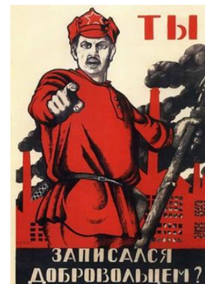
Slika 13. i Slika 14. Primjeri sovjetske propagande