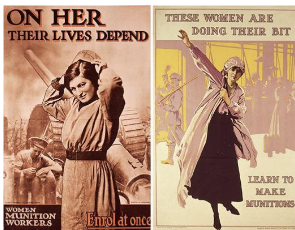
Slika 4. Žene kao ključna radna snaga u ratu

Još jedan od značajnijih primjera je plakat „Odbijte Nijemce kupnjom ratnih obveznica“ (Beat back the Hun with liberty bonds). On spaja čak dvije važne karakteristike ratnih plakata toga doba – dehumanizaciju neprijatelja i financiranje rata. Ovaj američki plakat prikazuje monstruožnu, prijeteću figuru koja predstavlja njemačkog neprijatelja ( Hun ), odnosno prijetnju demokraciji i slobodi. Stvarajući strah, potiče ljude da kupuju ratne obveznice te tako financijski pripomognu vojnim naporima svoje države. Apelira na patriotizam i želju za zaštitom američkih ideala.