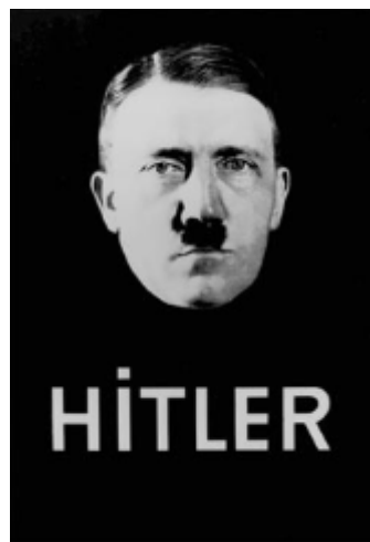
Slika 7. i Slika 8. stvaranje Hitlerovog kulta ličnosti

Propagandni plakati su se koristili i kao utjecajno sredstvo prilikom poziva za novačenje i mobilizaciju stanovništva. Pozivalo se muškarce u SS vojsku, elitnu postrojbu najbližu Hitleru. Primjer takvog plakata prikazuje vojnika uzdignute glave, ponosnog što štiti svoga vođu. Cilj je bio, kao i uvijek, potaknut osjećaj domoljublja i dužnosti prema domovini. U to su vrijeme, osim pojedinaca, postojali timovi za izradu ovakvih propagandnih poruka pa autor nije potpisan. Osim u SS, pozivalo se mlade, odnosno maloljetnike na novačenje u Hitlerovu mladež ( Hitlerjugend ). Na nekim plakatima su se nalazile i žene u nacističkim uniformama, jer cilj je bio potaknuti i žene da sudjeluju u nacističkim ratnim naporima. Na primjeru plakata na kojem se nalazi čovjek sa šeširom, a ruka upire u njega, dok piše „On je kriv za rat!“, odlično se vide Hitlerov i Goebbelsov stav prema Židovima. Naime, smatrali su da su Židovi krivi za Prvi svjetski rat te da Nijemci imaju pravo uzvratit. Time su opravdavali antisemitizam i kasnije