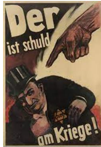
Slika 10 "On je kriv za rat!" – bogataš s Davidovom zvijezdom

Nasuprot Njemačkoj, izuzetni primjeri ratnih plakata se mogu vidjeti u komunističkom SSSR-u. Sovjetska propaganda je bila implementirana s vrha prema dolje, kao i u svakoj drugoj totalitarnoj državi (Nevezhin, 1997: 49). Nije bila tako planski razrađena kao Njemačka, ali ih spajaju dvije stvari - stvaranje kulta ličnosti i demonizacija neprijatelja. U njihovim plakatima je, također, prevladavala crvena boja jer osim što stvara osjećaj važnosti i ljutnje, ona je boja koja karakterizira ideologiju komunizma. Kao što se u Njemačkoj na zastavi i plakatima mogla vidjeti svastika, tako se kod komunista pojavljivao srp i čekić. To je bio njihov simbol, simbol industrijskih proletarijata i seljaka koji žive kao jedno. Pojava ovog simbola trebala je probuditi osjećaj pripadnosti i domoljublja (Haramija 1993: 205).