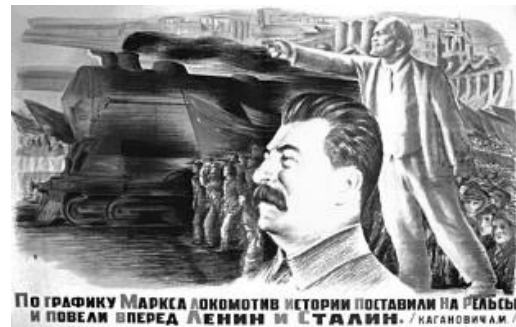
Slika 11. i Slika 12. stvaranje Staljinovog kulta личности

Osim stvaranja kult ličnosti, propaganda je veličala radničku klasu u skladu s marksizmom. Nakon njemačke invazije u prvi plan dolazi ratna propaganda. Cenzura je tada igrala veliku ulogu u propagandi. Mnoge su se stvari zataškavale kako ne bi došlo do pada morala među pripadnicima Crvene armije.