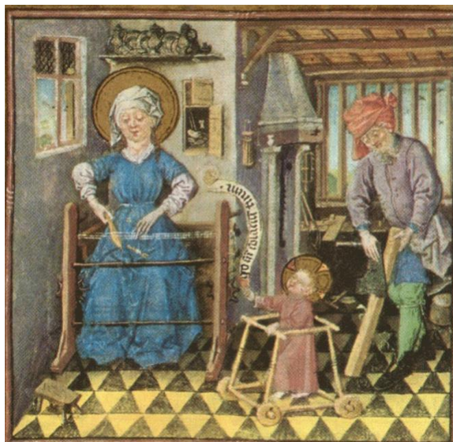
Slika 2. Prikaz svete obitelji u radu i Isusa kao djeteta u hodalici; oko 1440. godine, naslikao majstor Časoslova Katarine od Clevesa (Karbić, 2019, 83).

Unatoč pozitivnim stavovima o djetinjstvu i samoj djeci, ni negativni stavovi nisu uspjeli zaobići ovu tematiku. Kod negativnih se stavova posebno ističe već spomenuti sv. Augustin koji za djecu kaže kako su ništa više doli slabih, nerazumnih, ljubomornih i agresivnih bića. Ipak, bez obzira na razlike u mišljenjima i viđenjima djece, opće je prihvaćeno srednjovjekovno stajalište bilo kako djeca nisu vlasništvo svojih roditelja, već isključivo vlasništvo Boga te da je roditeljska uloga ponajviše briga za njih, odgajanje u dobre kršćane i obrazovanje (Karbić, 2019, 83).