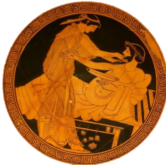
Slika 1. Prikaz Grka i hetaire (prostitutke visoke klase) iz unutarnje zdjele ili čaše s drškom (490.-480. pr. Kr.)

U antičkoj je Grčkoj bio razvijen i tradicionalni običaj „ mladoga ljubavnika “, u kojemu su stariji ljubavnici dječake između 12. i 18. godine podučavali ljubavnome umijeću, što bi se u današnjemu vremenu smatralo blago rečeno – neprihvatljivim. Sama je seksualnost toga doba bila vrlo izražena, što vidimo i po ostacima grčkoga antičkoga umijeća, poput raznoraznih slika ili ukrašenih vaza u kojima se jasno oslikava ondašnja povezanost društvenoga ranga i seksualne poze (Močibob, 2019, 8 navedeno u Knibiehler, 2004).