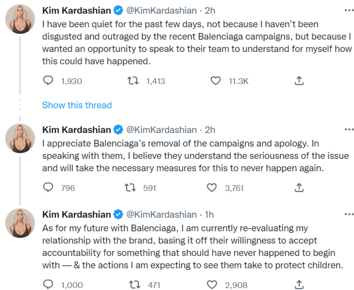
Slika 3: Reakcija Kim Kardashian na Balenciaginu kampanju putem svog Twitter profila.