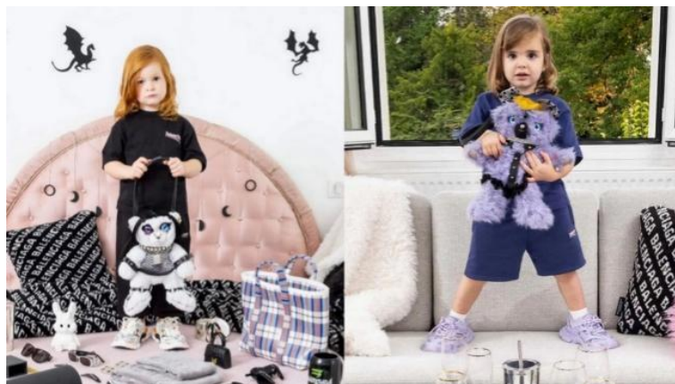
Slika 1: Fotografije proljetne kampanje Balenciage