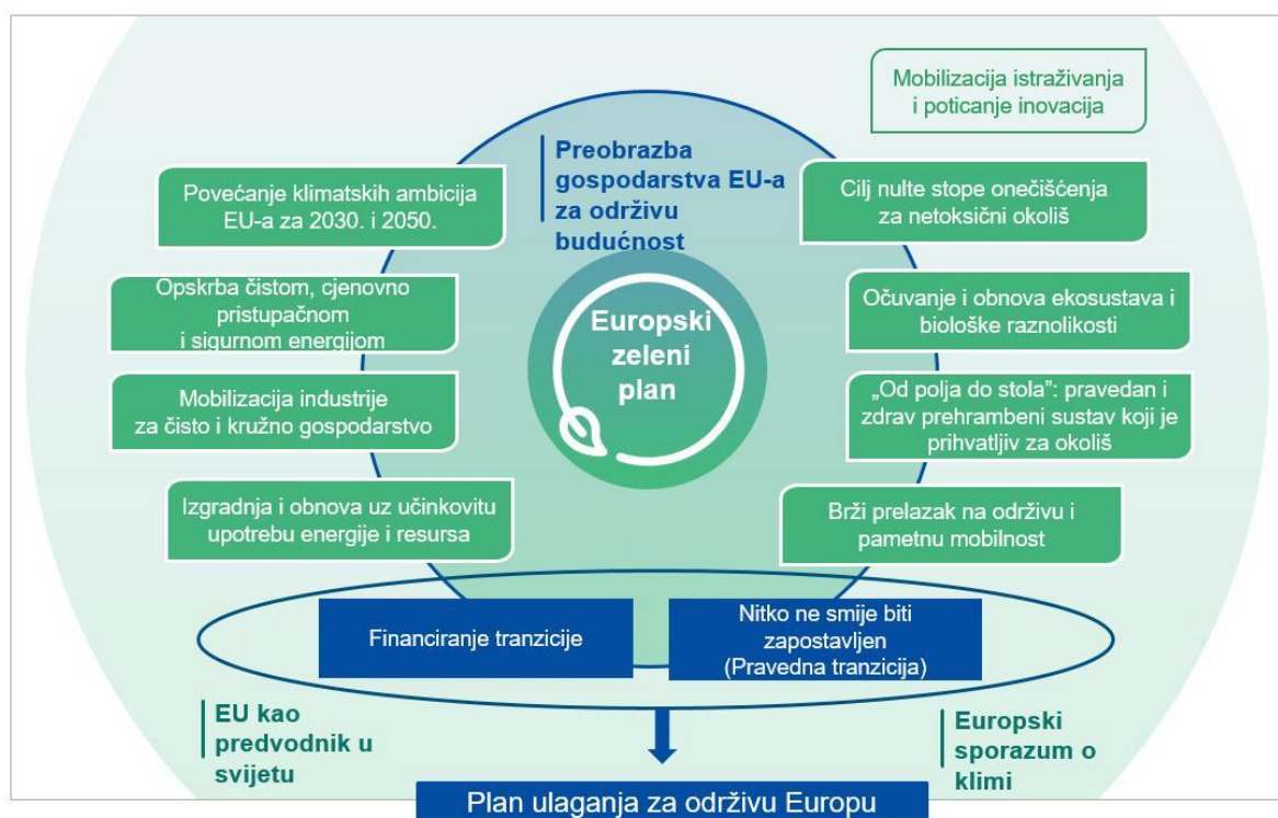
Slika 1: Europski zeleni plan

Kao što je vidljivo sa slike 1, EZP se sastoji od niza strategija koje uključuju: klimatsku politiku, energetska politiku, kružno gospodarstvo, zaštitu okoliša i bioraznolikost, održivu mobilnost bi čemu se prioritetno misli na poboljšanje postojećih i izgradnju novih prometnih infrastruktura, digitalne transformacije, socijalnu politiku te integraciju poljoprivrede i turizma strategijom „Od polja do stola“. Fond za inovacije sustava EU također se obvezao na podupiranje istraživanja u svrhu održivog razvoja.