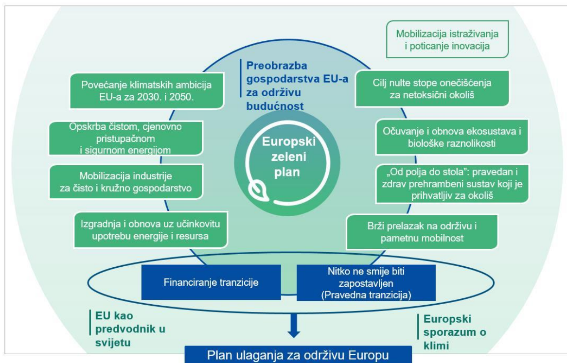
Slika 1: Europski zeleni plan

Kao što je vidljivo sa slike 1, EZP se sastoji od niza strategija koje uključuju: klimatsku politiku, energetska politiku, kružno gospodarstvo, zaštitu okoliša i bioraznolikost, održivu mobilnost bi čemu se prioritetno misli na poboljšanje postojećih i izgradnju novih prometnih infrastruktura, digitalne transformacije, socijalnu politiku te integraciju poljoprivrede i turizma strategijom „Od polja do stola“. Fond za inovacije sustava EU također se obvezao na podupiranje istraživanja u svrhu održivog razvoja.