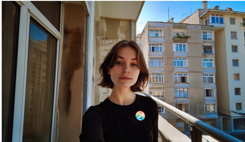
Slika 5. Nitkolina (Možemo!, 2024)

Programski koordinator Tomislav Medak na konferenciji za medije predstavio je i Kodeks političkog komuniciranja u izbornoj kampanji stranke Možemo! u kojem je naznačeno da se „u odsustvu nacionalnog zakonskog okvira koji bi upravljao korištenjem generativne umjetne inteligencije u političkim kampanjama“, stranka obvezuje odgovorno i transparentno koristiti umjetnu inteligenciju u svojim političkim kampanjama (Možemo!, 2024). Kod ove se kampanje postavlja pitanje je li stranka zaista razvila avatar s namjerom da upozori na opasnost širenja lažnih vijesti u političkim kampanja ili da se on primjeni kao dodatni alat za komentiranje i izazivanje protustranaka koristeći umjetnu inteligenciju. Naime, avatar Nitkolina je u jednom od videa pozvala premijera na sučeljavanje, a pomoću generativne umjetne inteligencije osmišljene su i producirane pjesme koje na verbalno grub način komentiraju stanje u državi i političare iz suparničkih stranaka.