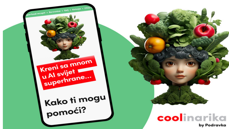
Slika 4. SuperfoodChef-AI by Coolinarika (Podravka, 2023)