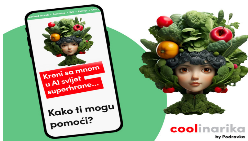
Slika 4. SuperfoodChef-AI by Coolinarika (Podravka, 2023)