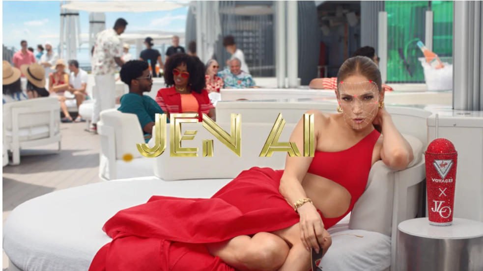
Slika 2. Jen AI (VML, n.d.)

Uz avatar i deepfake promotivni video, kampanja je iznjedrila i platformu putem koje su korisnici mogli dobiti personaliziranu poruku u kojoj ih Jen A.I. poziva na krstarenje (Virgin Voyages, 2023). Cilj kampanje bio je potaknuti na kupnju krstarenja na Virgin Voyages kruzerima, a za programiranje avata i generiranje personaliziranih pozivnica korišten je model GPT-4 (Virgin Voyages, 2023). Na službenoj stranici tvrtke VML (n.d.) objavljeni su rezultati koji s približno 20 milijuna organskih prikaza, 200 tisuća interakcija i 25 tisuća