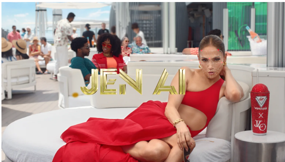
Slika 2. Jen AI (VML, n.d.)

Uz avatar i deepfake promotivni video, kampanja je iznjedrila i platformu putem koje su korisnici mogli dobiti personaliziranu poruku u kojoj ih Jen A.I. poziva na krstarenje (Virgin Voyages, 2023). Cilj kampanje bio je potaknuti na kupnju krstarenja na Virgin Voyages kruzerima, a za programiranje avata i generiranje personaliziranih pozivnica korišten je model GPT-4 (Virgin Voyages, 2023). Na službenoj stranici tvrtke VML (n.d.) objavljeni su rezultati koji s približno 20 milijuna organskih prikaza, 200 tisuća interakcija i 25 tisuća