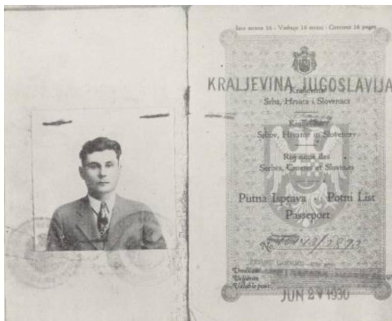
Slika 2. Prikaz putovnice izdana 1930. u vrijeme Kraljevine Jugoslavije