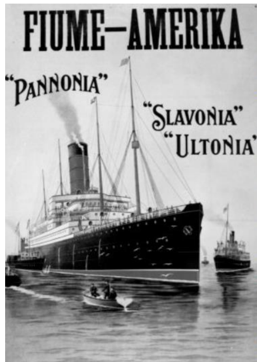
Slika 1. Plakat Cunard Linea koji početkom 20. stoljeća odvozi 300.000 emigranata iz riječke luke