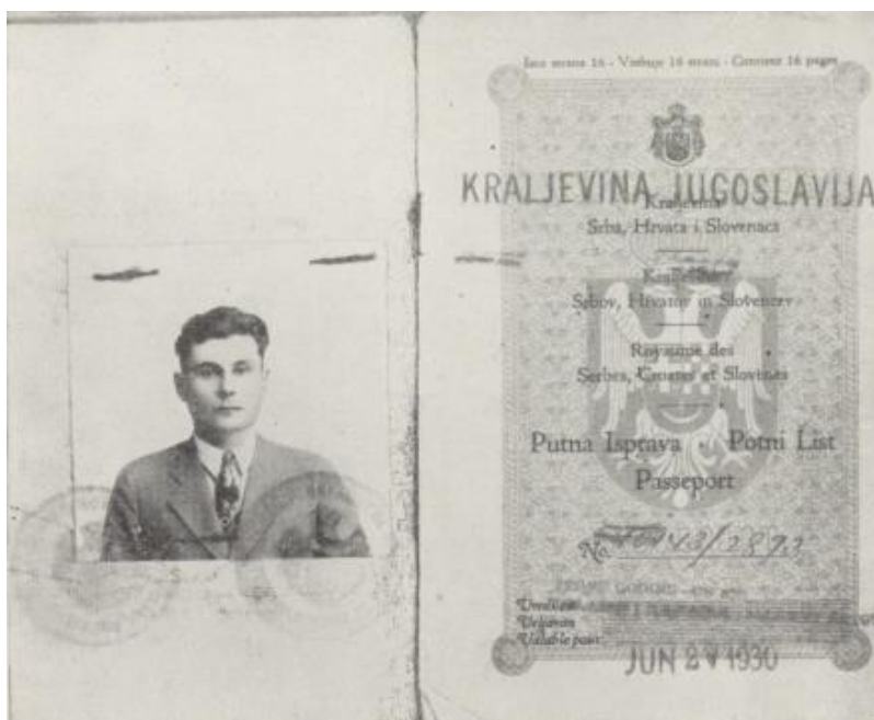
Slika 2. Prikaz putovnice izdana 1930. u vrijeme Kraljevine Jugoslavije