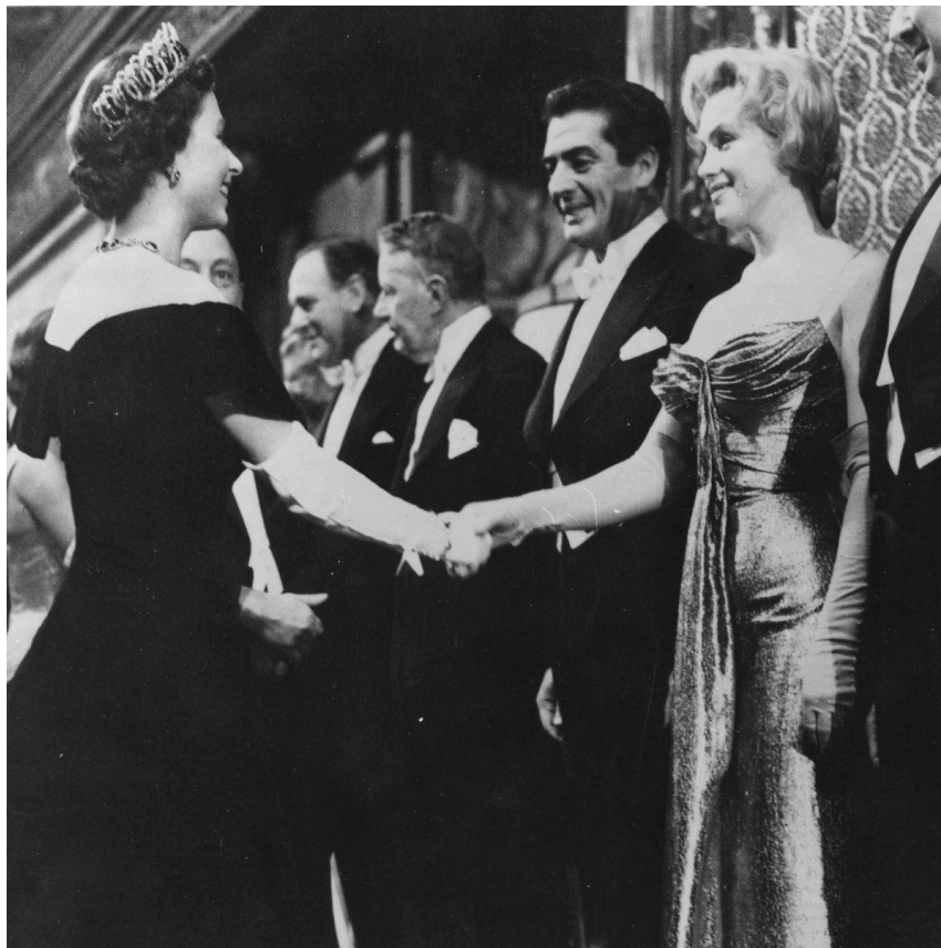
Slika 3- Marilyn Monroe u haljini koju je nosila prilikom upoznavanja s kraljicom Elizabetom II

Još jedan primjer vizualnog komuniciranja odjećom je i onaj glumice, pjevačice, modela i pop ikone Marilyn Monroe. U ranim godinama svoje modelske karijere Marilyn je naučila kako pomoću šminke i odjeće može stvoriti vlastiti imidž i slati jasne poruke, a kako navodi Jeffrey Meyers u knjizi The Genius and the Goddess: Arthur Miller and Marilyn Monroe (2010: 27), Marilyn je u početku težila da bude poželjna, pa joj je odjeća pomagala u stvaranju imidža filmske dive. Najupečatljiviji primjer komuniciranja odjećom, kada je u pitanju Marilyn Monroe je haljina koju je nosila prilikom upoznavanja s britanskom kraljicom Elizabetom II (Slika 3). Kako je navedeno u modnom magazinu Grazia (2022), ove dvije značajne žene upoznale su se 1956. godine na jednoj predstavi u Londonu. Ono što je obilježilo njihov susret je haljina izraženog dekoltea s kojom je Marilyn prekršila protokol o odijevanju koji je bio zatražen prije dolaska na predstavu. Njezina duga haljina, iako elegantna u svom kroju, bila je definitivno izvan okvira konzervativnosti. Zlatna haljina sa svojim tankim naramenicama i dubokim dekolteom, jasno je naglašavala njezine ženstvene obline i atraktivnost kao i odlučnost da se istakne na događaju. Poruka koju je svojim odabirom odjeće poslala je da je samouvjerenija i spremna istaknuti svoju osobnost i stil, čak i ako to znači odstupiti od očekivanja ( Grazia , 2022).